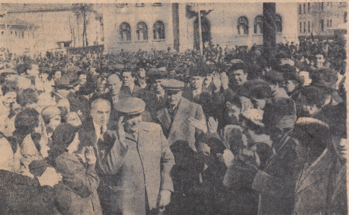
În mijlocul locuitorilor din orașul Pitești

Vizita conducătorilor de partid și de stat a prilejuit pretutînd în regiune o puternică manifestare a atașamentului oamenilor muncii față de partid, a hotărîrii lor de a munci cu elan pentru îndeplinirea marelui program de înflorire a patriei trasat de Congresul al III-lea al partidului.