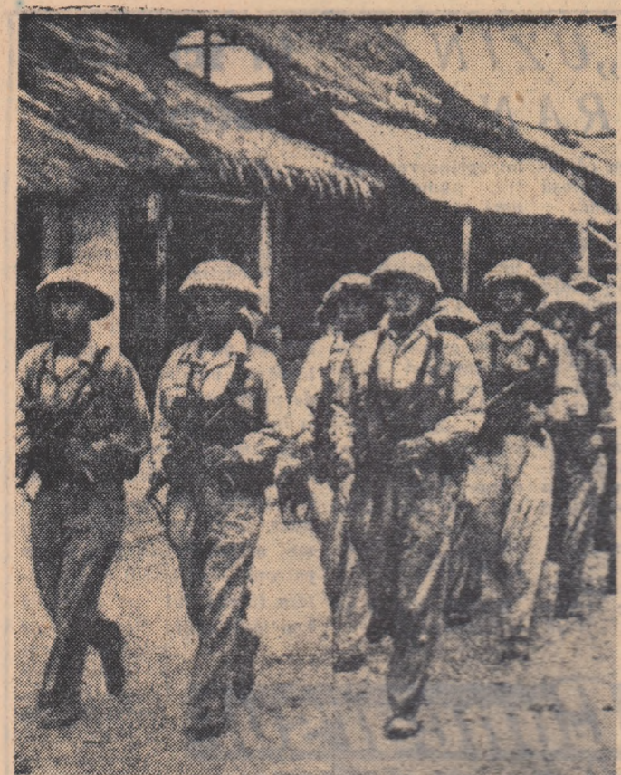
LAOS: Un avion ciankaișt doborât de către forțele patriotice

Helsinki, 20 februarie 1961 (prin telefon)