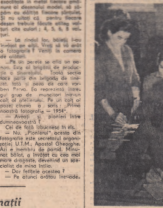
Oră de clasă la Școala de meserii confecții-textile din Capitală.