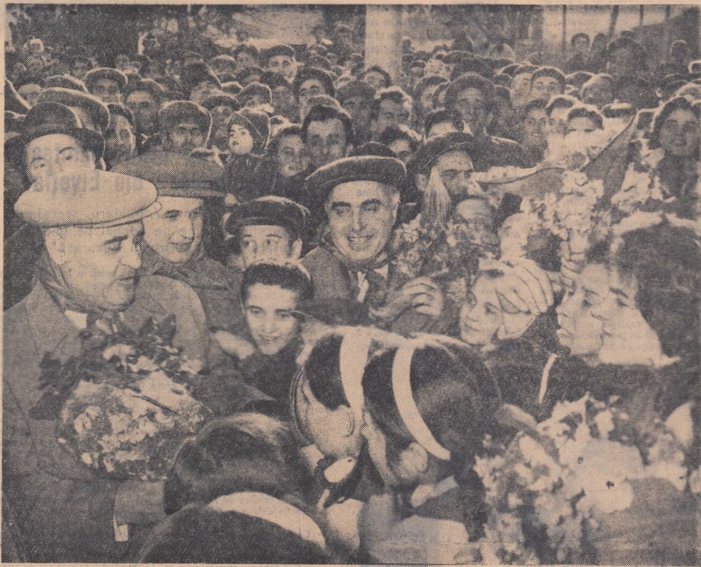
La Curtea de Argeș.

Construirea acestor noi obiective vine să se adauge și-riului de realizări îndeplinite pe meagurile acestei regiuni în anii puterii populare. Aci s-a dezvoltat o nouă ramură industrială — industria petrolieră — care dă aproape un sfert din producția de țîței a țării noastre. S-au înălțat numeroase unități industriale noi, au fost modernizate și dezvoltate cele existente. La Colibași a luat ființă uzina metalurgică „Vasile Tudose”, la Govora s-a construit o mare uzină de produse sodice. S-a dezvoltat,