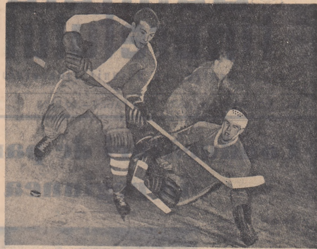
Fază din meciul de hochei dintre echipa Leningrad și reprezentativa București I.