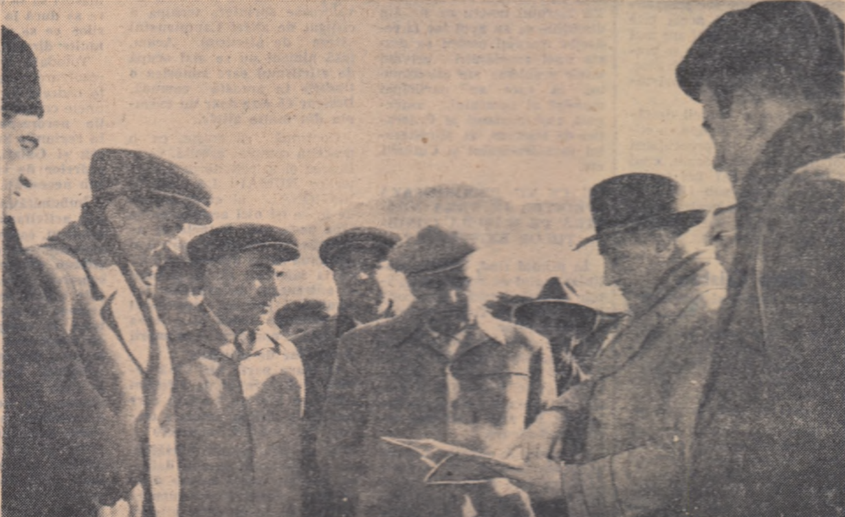
Examinînd amplasamentul hidrocentralei de pe Argeșul superior.