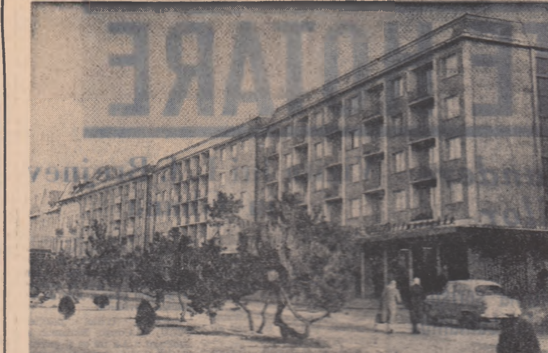
Si in Tg. Mures, construc- ția au atins un ritm ne- cunoscut pînă acum. Iată un grup de 3 blocuri noi cu câte 4 etaje. In primul bloc se afliă și cinematograful cu ecran lat „Nicolae Bălăescu”.

Săliile sînt pline de vizitatori. O asemenea animatie e rară în expoziții, unde lumea privește solomon de obicei. Printre arti- știi mulți sînt cunoscuții artiști- lor care expun. Artista e pentru ei prietenul, vecinul de masă la cantină, tovarășul din secție. Se mîna omul cu vecinul și priete- nii s-au uitat la ce se uită și ei, el și cu vîzută ceea ce nu vede el. În clipa cînd se miră de asta, a descoperit în arta viața, oglîndi- rea poetică a realității. Călitatea cea mai vizibilă în această expoziție este entuzias- mul. Entuziasmul care înflăc- tește studiul zilnic al amatorului și îl impinge să se depășească. Unele nume de artiști le umă- resc de cîtiva ani. La început pictau pentru că le plăcea pic- tura și voiau să-și reproducă acea emoție pe care o simțeau în expozițiile artiștilor consa- crați. Acum pictează că să re- producă emoții simțite față de realitate. Această expoziție e plină de compoziții cu scene de muncă, din uzine și de pe gora- re, cu peisaje industriale și scene din viața zilnică. Mai ales pei- soajul industrial umește în acest ansamblu, prin intensitatea li- rică a interpretării. Săntierul sau hala de turnare cu o fru- mușete dură, bărbătească. Din acest mediu sever, peisagiștii