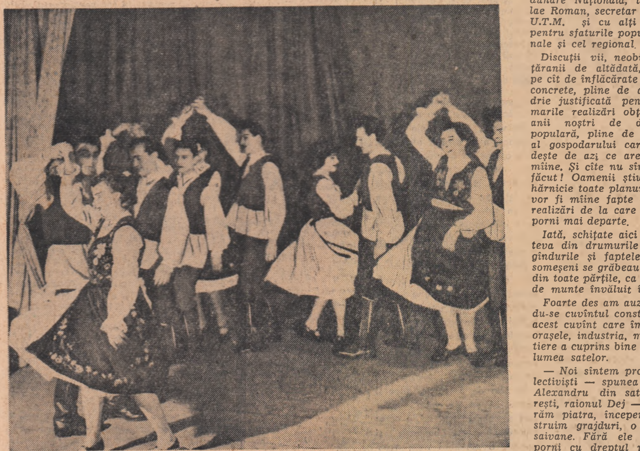
Echipa artistică a Întreprinderii „Solidaritatea” din Oradea, pregătește în cinstea alegerilor un bogat program artistic, lată un aspect de la repetițiile formației de dans.

(Din Manifestul Consiliului Central al Frontului Democratiei Populare).