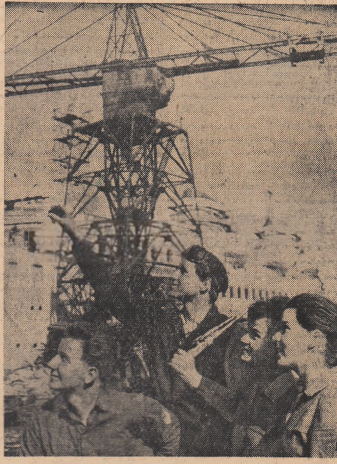
În fotografie: Tineri constructori ai socialismului din R. D. Germană, muncitori la Șantierul Naval „Neptun” din Rostock.

Deci, să recapitulăm. În S.U.A. s-a descoperit remedii crizei și „declinul psihologic” alimentat de criză: reclamele. Se găsesc însă unii oameni care nu înțeleg însemnătatea „descoperirii”. Cum adică — spun ei — reclamele vor deschide porțile uzinelor închise, vor da de lucru milioanele de șomeri, vor salva economia atît de bolnavă a S.U.A.? Nu, autorii „descoperirii” nici măcar nu au adevărate pretenții. Ei vor doar ca americanul să uite cuvîntul „criză” ce dezvăluie bolile incurabile ale capitalismului. Să uite doar cuvîntul „descoperire”. Ce boala nu poate fi vindecată... — Și putem să mai notăm ceva despre înclinațiile spre binefaceră ale celor 80: „descoperirea” aceasta va aduce paralele frumusele trustraturilor de publicitate care vor înghiți milioane de dolari grași reclamelor. E. O.