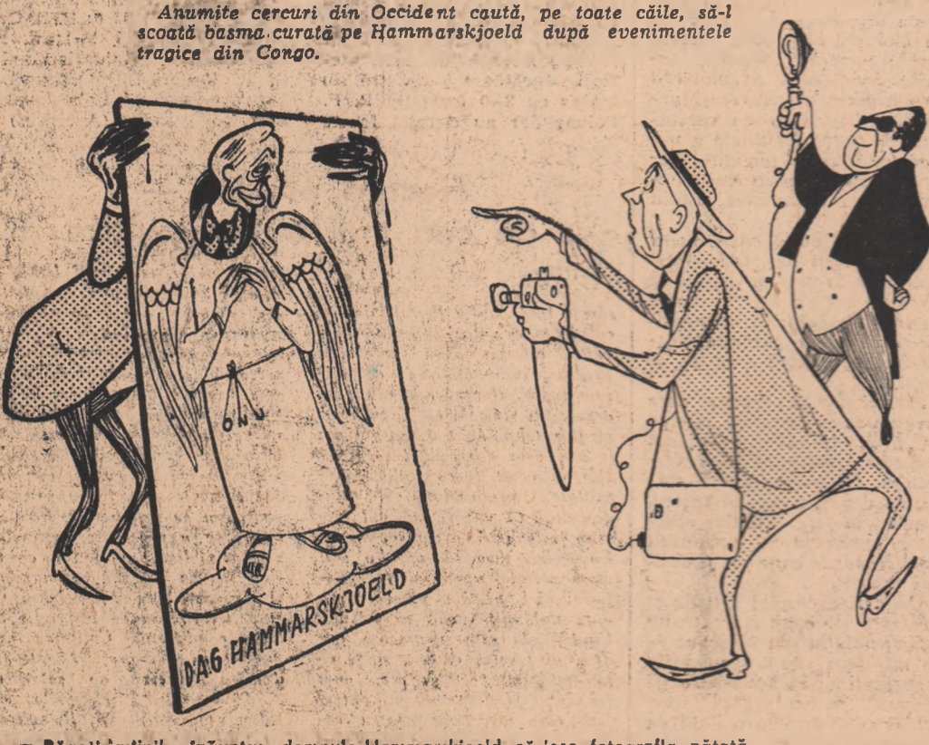
Băgați mințile înăuntru, domnule Hammarskjöld, că iese fotografia pătoșă... Desen de V. VASILIU