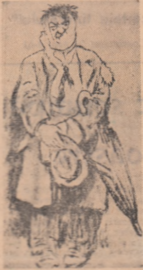
Afiș o caricatură publicată în 1933 în revista „CUVINTUL LIBER”...