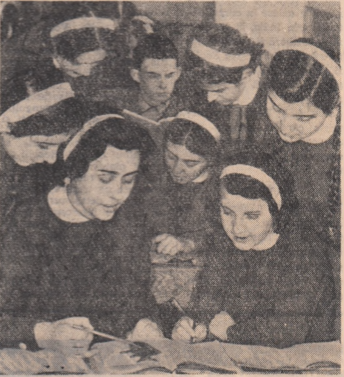
Un grup de elevi din clasa IX-a B, de la Școala medie nr. 3 „Eftimie Murgu” din Timișoara discută împreună despre lecția predată.

Selecționata de hochei pe gheață a orașului Moscova care se află în turneu în R. S. Cehoslovacia a întilnit la Plzeň echipa locală Spartak. Hocheiștii sovietici au obținut victoria cu scorul de 8-3 (3-0; 3-1; 2-2).