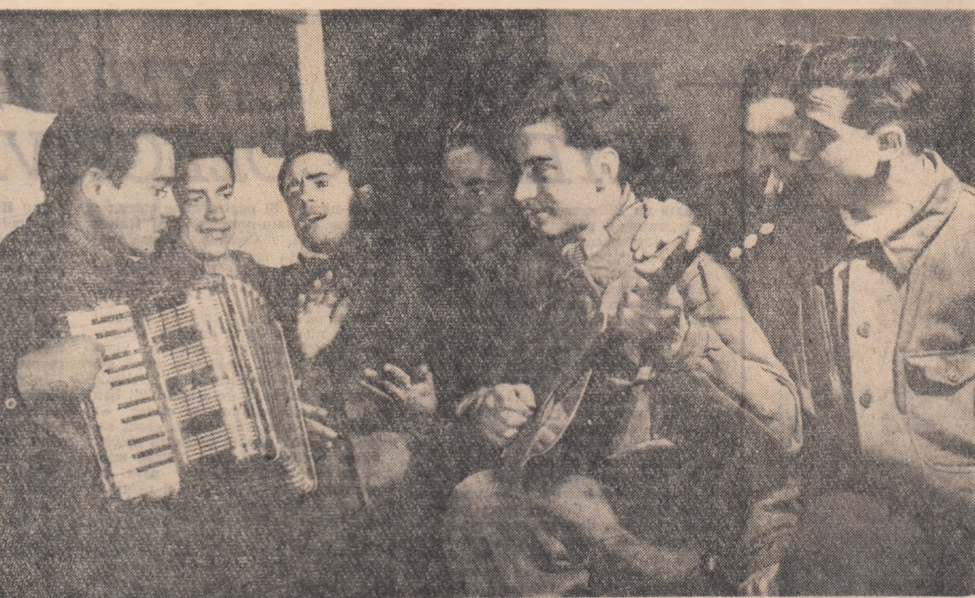
Cluburi, terenuri sportive sînt puse la dispoziția elevilor pentru a-și petrece timpul liber în mod plăcut și instructiv. Iată-i pe elevii școlii profesionale de mecanici agricoli din comuna Ianca regiunea Galați repedînd în frumosul club al școlii un cîntec din programul artistic pe care-l vor prezenta în ziua alegerilor.

BRABIE I. VOICU student Institutul politehnic București