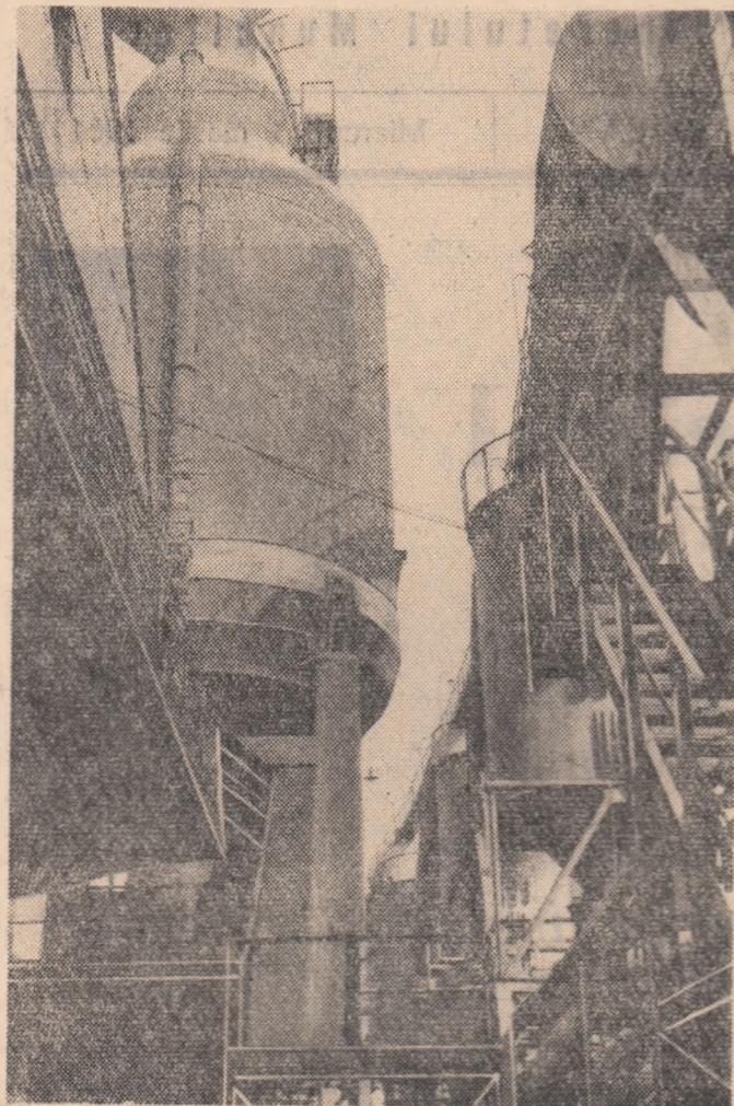
De aici din marile furnale ale Hunedoarei pornesc zilnic spre uzinele patriei mii de tone de metal.