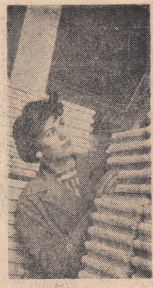
În sala Stana Tomilă lucrătorii fruntași la Combinatul Poligrafic „Casa Școlii”.

Anul acesta poporul nostru muncitor sărbătorește o aniversare deosebit de scumpă — 40 de ani de la înființarea Partidului Comunist din România. Sub conducerea partidului, oamenii muncii din patria noastră au obținut victorii de seamă în construcția socialistă. Recent, au fost publicate Directivele C.C. al P.M.R. cu privire la criteriile principale ale întrecerii socialiste în cinstea aniversării a 40 de ani de la înființarea Partidului Comunist din România, în care se arată că principala obiectiv la întreceri trebuie să fie calitatea produselor.