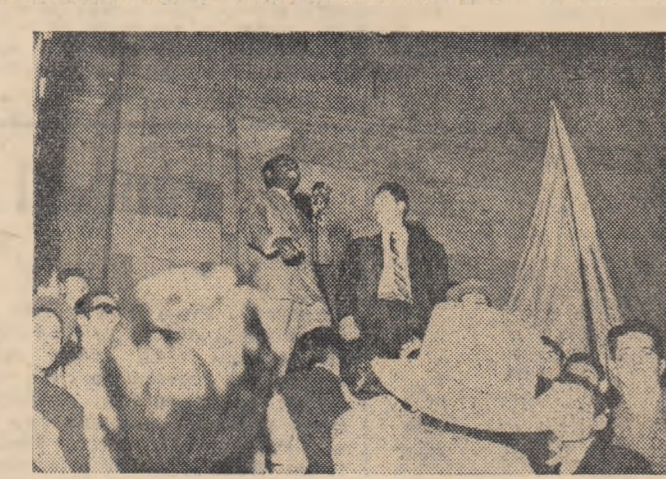
O demonstrație a muncitorilor din Bogota, capitala Columbiei, s-a transformat spontan într-o manifestație de solidaritate cu revoluția cubană în momentul în care deputatul Nacional Diaz din Mișcarea națională revoluționară a vorbit muncitorilor despre lupta poporului cuban. Multumim o scundă lozincă: „Cuba, da; Yanchei nu!”

La 28 februarie studenții africani din Franța au început o grevă de două zile în semn de protest împotriva persecuțiilor la care sînt supuși într-o măsură tot mai mare de guvernul francez. În comunicatul „Federației studenților din Africa neagră care studiază în Franța” se arată că după expulzarea ilegală din Franța a patru studenți din Camerun, poliția din Paris a arestat doi studenți din Guineea și doi studenți din Mali, care de asemenea au fost expulzați din Franța. Ziarul „L'Humanité” anunță că la 2 februarie la Toulouse fasciștii au maltratată, sub protecția poliției un student tunisian pe motiv că acesta intenționa să se alăture unei greve a studenților. În seara zilei de 21 februarie fasciștii au maltratată tot la Toulouse un student marocan. La 23 februarie, în piața centrală a acestui oraș a fost rănit încă un student african. Rasiștii francezi dijuzază manifeste care conțin înjurări și amenințări la adresa studenților africani.