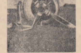
Un avion american doborât de forțele Patet-Lao.

„Așadar, pe mine! — mi-a spus prietenos Kong Le. La 6 dimineața ne întâlnim în cor-