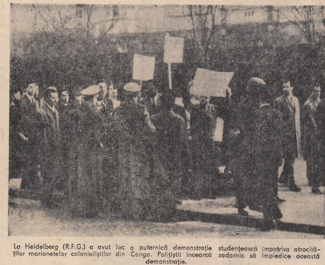
La Heidelberg (R.F.G.) a avut loc o puternică demonstrație studențească împotriva atrocităților marionetelor colonialiștilor din Congo. Poliștii încearcă zadarnic să împiedice această demonstrație.

În grozavă crimă a contrarevoluției — lansarea unei bombe la colegiul „Academia Nobel” din Havana, în urma căreia numeroși studenți și profesori au fost răniți — a strigat protestul plin de minie al poporului cuban. La chemarea Confederației Oamenilor Muncii din Cuba și Federației universitare a studenților, în apropierea clădirii colegiului „Academia Nobel” a avut loc o mare manifestație a studenților și un miting de protest împotriva provocărilor contrarevoluționare și împotriva actelor teroriste. Reprezentanții studenților, reprezentanții Confederației Oamenilor Muncii din Cuba și ministrul învățământului, Armando Hart, care au luat cuvântul la miting, au demascat activitatea criminală a proefilor catolici reacționari și a unor profesori din școlile și colegiile particulare, care încearcă să inspire elevilor ură față de revoluție și față de transformările din Cuba. Vorbitorii au subliniat că majoritatea covârșitoare a elevilor din școlile și colegiile particulare se pronunță cu hotărâre împotriva contrarevoluționarilor.