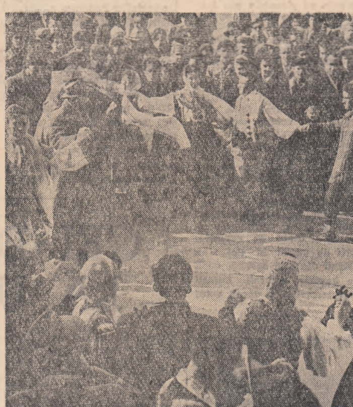
Și în Piața Republicii din Capitală cîntecul și jocul sînt o expresie a bucuriei populare.

Pînă la orele 11 toți alegătorii din acest sat au votat.