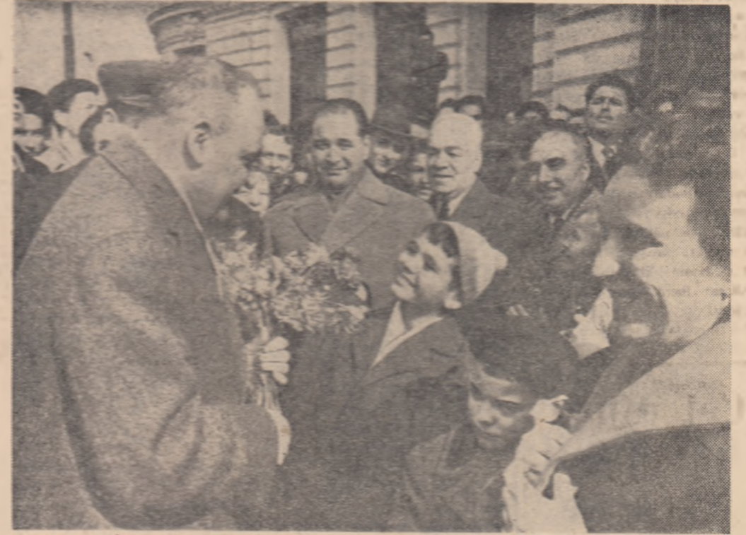
În Piața Republicii, conducătorii partidului nostru au stat de vorbă cu oameni ai muncii și cu tinerii viitoare ale țării, viitorii constructori ai comunismului.