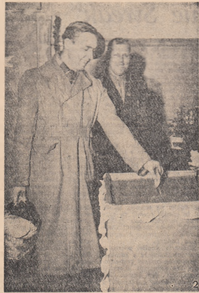
2 Simeria, ora 8,20. În gară trenul nu stă decît 10 minute. Dar al timp să mergi la secția de vot și să-ți faci datoria de cetățean.

3 Spîni, ora 8,45. Cu cai sprintari poți ajunge repede la Turdas, la secția de votare. Colectivștii se grăbesc pentru că și aci vor să fie primii, așa cum sînt primii întodeuna la muncă.