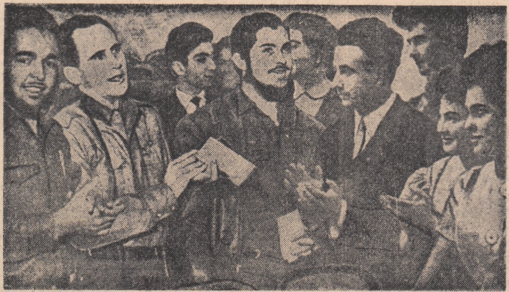
Studentii universității din Moscova primesc ocașii dragi — delegația tinerilor din Cuba

Dusmanii revoluției, a subliniat Castro, au vrut să lase Cuba neapărată și fără a păstra. Tocmai de aceea ei s-au străduit să împiedice livrarea de arme Cubei, tocmai de aceea au provocat explozia de pe „La Coubre”.