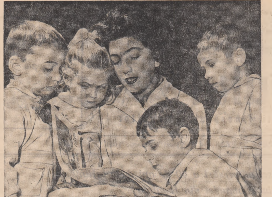
Intr-o zi obișnuită la grădinița cu orar normal de pe lângă Întreprinderea „Electromotor“ din Capitală.

Înainte vreme în comuna Golăși, raionul Brăila, ca de altfel în toate satele țării stăpînite de crunta cîrdășie burghezo-moșierească, primăvara venea mai ales cu sărăcie.