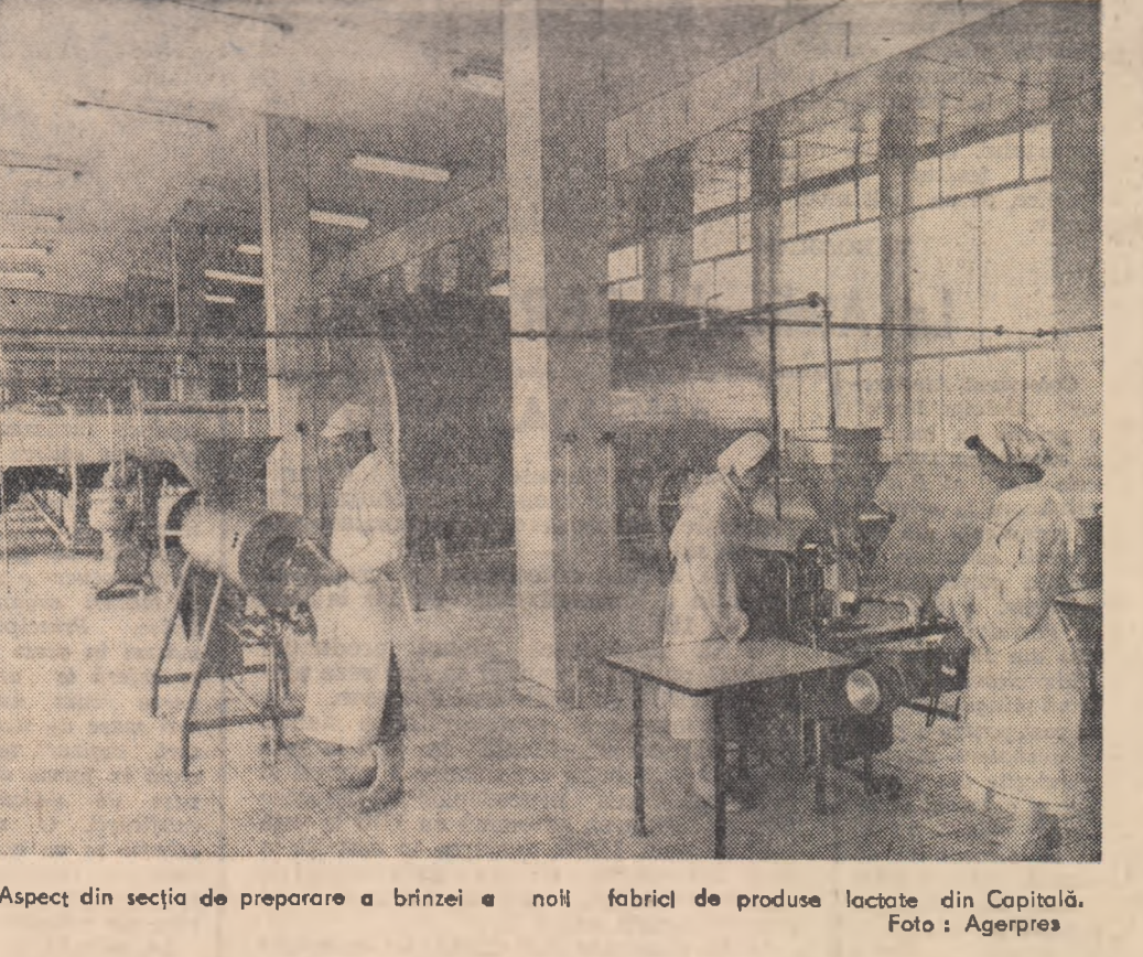
Aspect din secția de preparare a brînzei a noului fabric de produse lactate din Capitală.

In magazinele alimentare din Capitală au apărut primele produse ale fabricii de prelucrare a laptelui de la Militari-București. Într-o încăpere cu utilaj perfecționat, nou instalat, industria noastră alimentară va produce zilnic 300.000 litri de lapte și va produce 20 de sortimente de brînzetură, lapte, chei, lapte acidulat, lactofrac, smîntîna, unt, înghețată, lapte pasteurizat pentru consum.