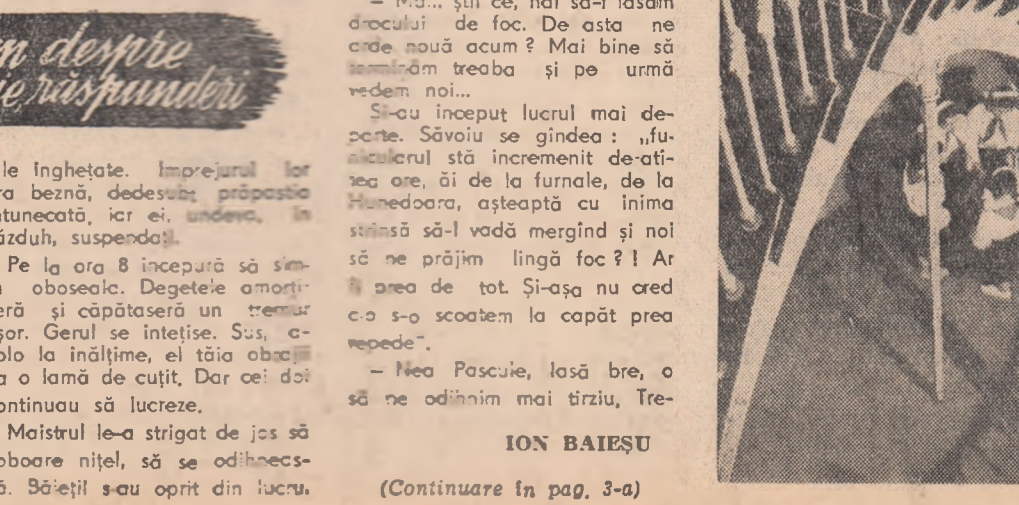
Aspect din țesătoria fabricii de sticlă a întreprinderii „Partizanul Rosu” din Brașov.