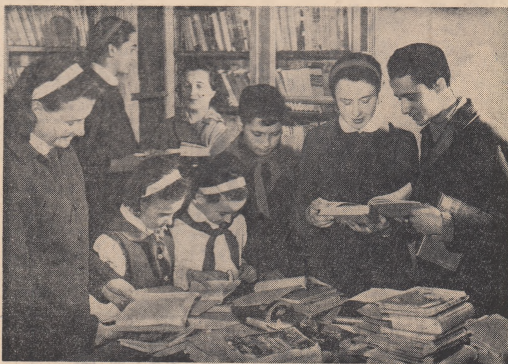
O parte din cititorii bibliotecii Școlii medii nr. 3 „Eftimie Murgu” din Timișoara.