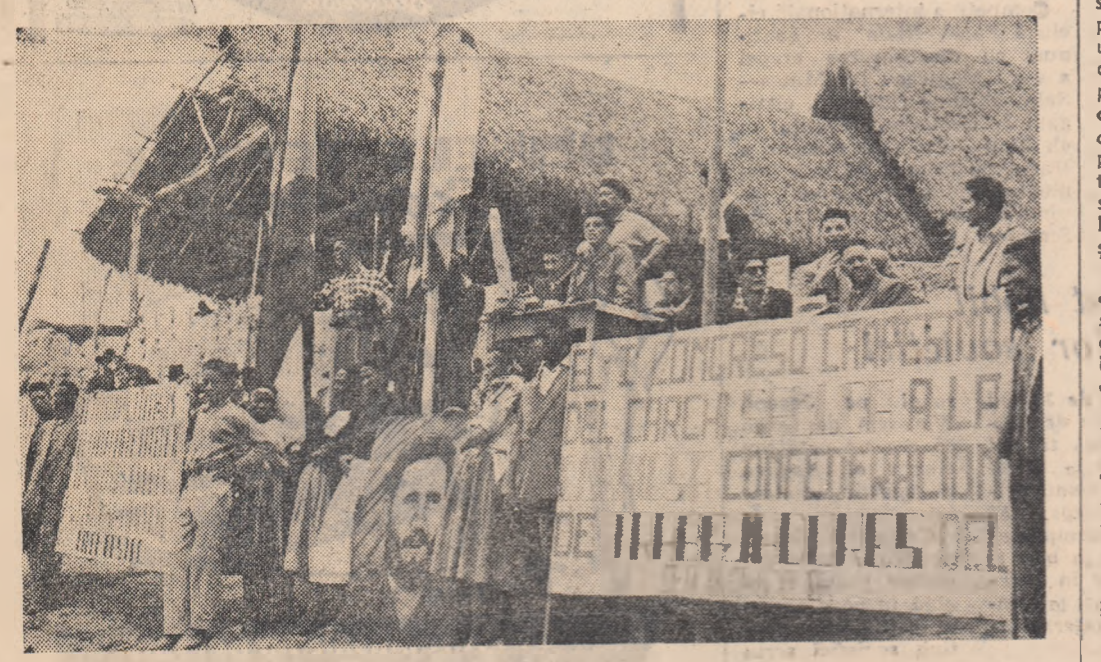
Delegații la primul Congres al Federației tărănimii din provincia Carachi (Ecuador) și-au manifestat solidaritatea cu Cuba