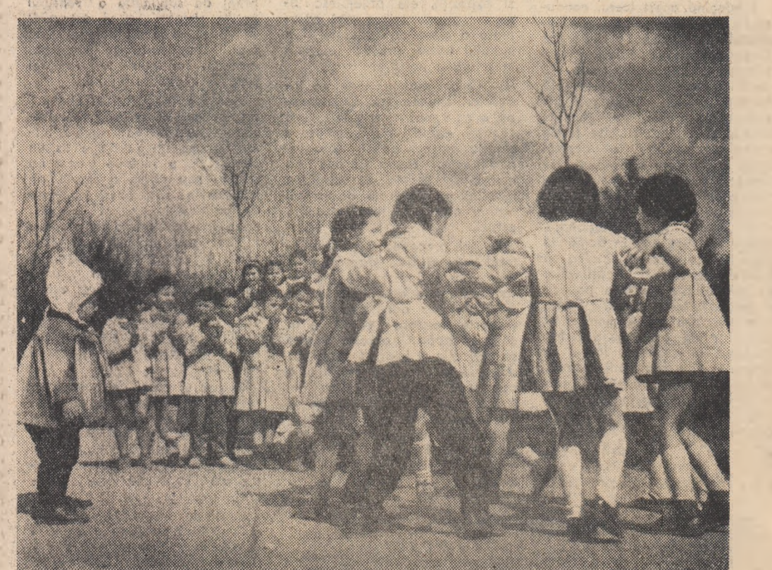
A venit primăvara! Copiii au umplut parcurile cu jocurile și voiașia lor...