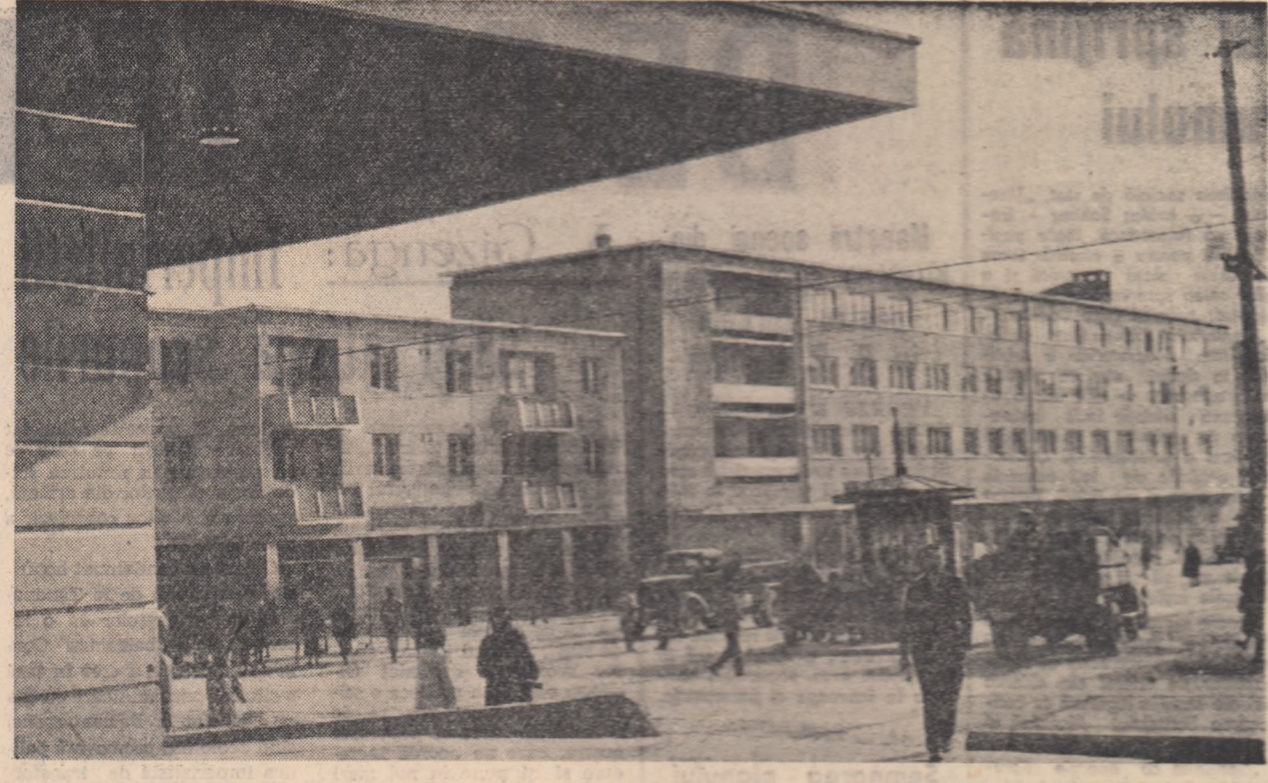
Foto orașului Medgidia se schimbă zi cu zi. Noi locuințe pentru oamenii muncii sînt date în folosință. În fotografie: un aspect din centrul orașului.