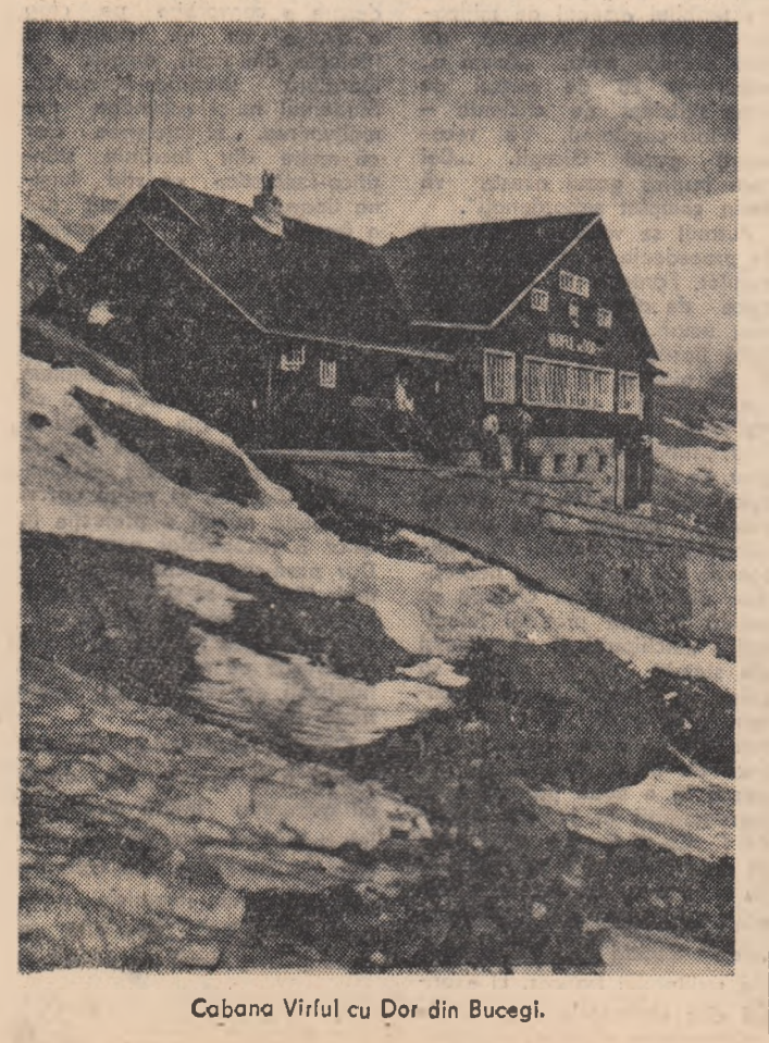
Cabana Virful cu Dor din Bucegi.

tinuăm să învățăm cu toții, pentru că în acest an avem planificat să obținem 2.500 litri lapte pe cap de vacă furajată. Sistemul hotărîții să depășim această cantitate. Vom depune toate eforturile pentru îndeplinirea prevederilor recente Hotărîrii a C.C. al P.M.R. și a Consiliului de Miniștri, cu privire la creșterea numărului de animale propriu-zise obținute și sporirea producției acestora.