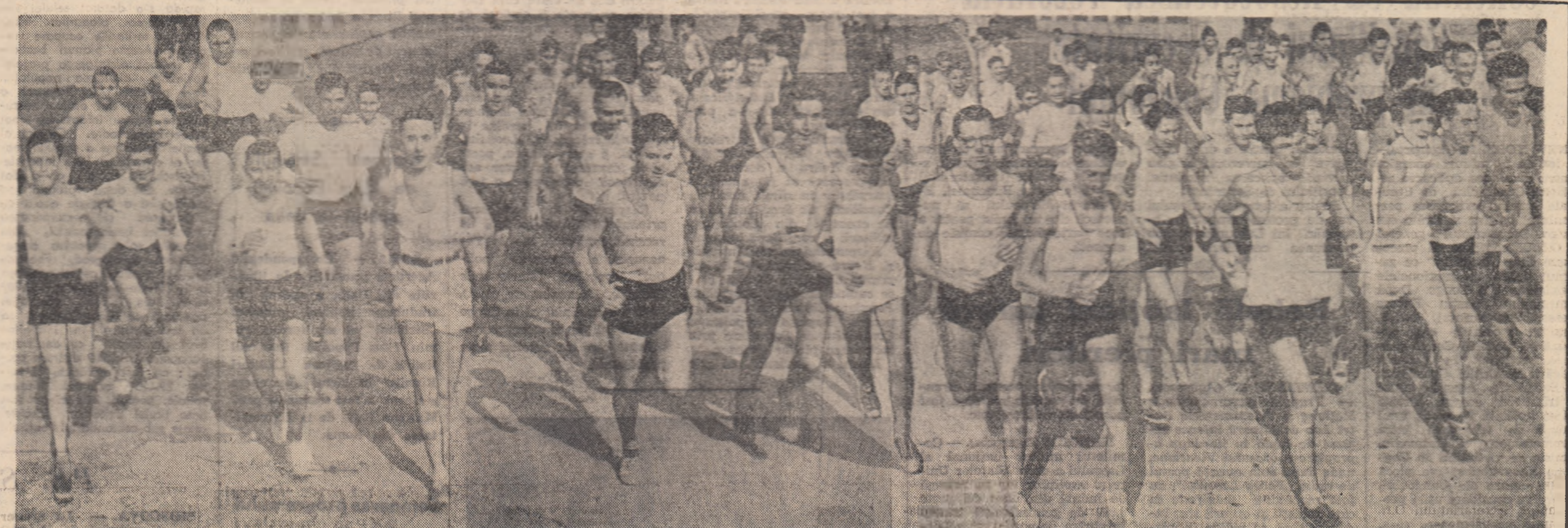
Primăvara, este anotimpul cel mai prielnic întrecerilor de cros. Tineri, începând încă de pe acum antrenamentele, concursurile pregătitoare, în vederea participării la tradiționalele crosuri de masă ce se desfășoară în fiecare an în țara noastră.

In cinstea acestei glorioase aniversări să facem să răsună orașele și satele patriei de muncă entuziasmată a brigăzilor, să sporim numărul brigăzilor utemiste de muncă patriotică, astfel ca și prin activitatea obștească, prin rezultatele acțiunilor întreprinse să dovedim recunoștința nemărginită și dragostea noastră profundă față de P.M.R., conducătorii întregii și sărbii al poporului nostru, să ne aducem o contribuție sporită la întărirea și înflorirea patriei noastre.