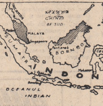
unele dintre ele au și o însemnată valoare strategică — sînt puse la dispoziția unui grup de state care, toate sînt membre ale N.A.T.O.

Fiindu-i peste puțință să ex-ploateze singură avuțiile uriașe ale Irianului de vest, Olanda s-a văzut silită să deschidă porțile coloniei ei nu numai capitalului monopolist american, ci chiar și celui vest-european. Astfel, încă în anul 1957, guvernul de la Haga încluse Irianul de vest într-un plan de „valorificare” elaborat în comun cu guvernele Germaniei occidentale, Franței, Italiei, Belgiei și Luxemburgului. Astfel, resursele de mapi-terii prime ale Irianului —