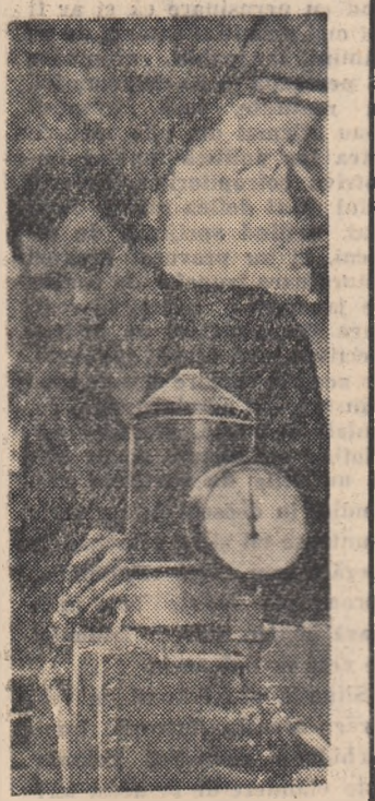
Tindrul Mureșan Ion de la secția montaje filtre a Uzinelor „Timpuri Noi” din Capitală se numără printre fruntașii în producție din întreprindere.