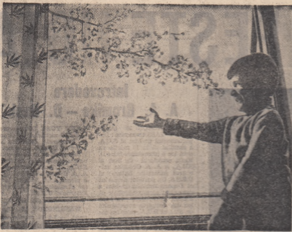
Bun soț primăvară!