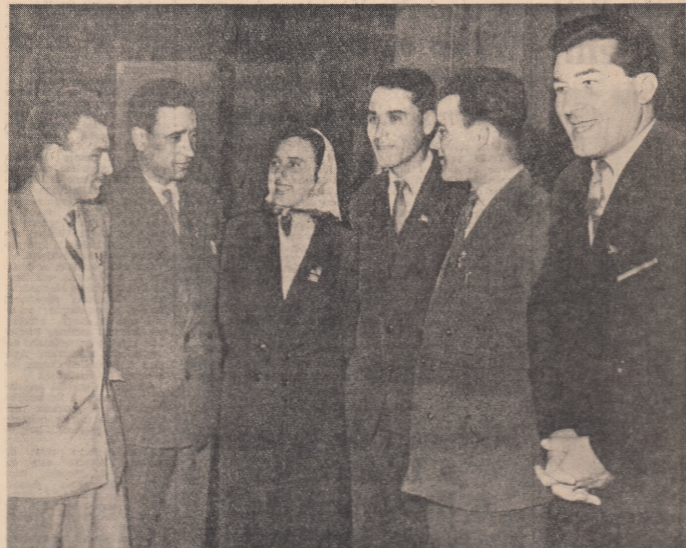
În-a poză o lucrările

metodelor de activitate ale organelor puterii de stat. In desfășurarea acestui proces apare tot mai mult importanta rolului pe care organele supreme ale puterii de stat, li au in soluționarea problemelor de mare însemnătate ale construcției economice, social-culturale și de stat din etapa actuală. Pentru ca