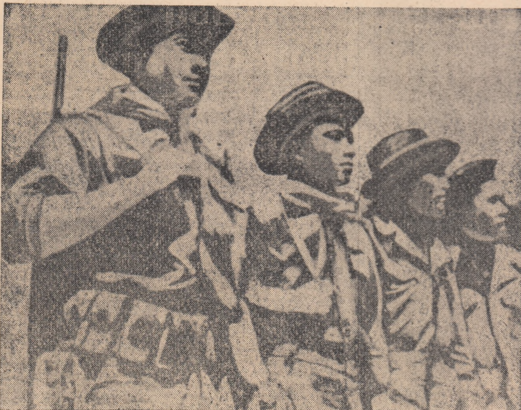
Studentii laotieni înrolați în cadrul forțelor patriotice.

VIENG KUANG 21 (Agerpres). — Recentele înfringeri suferite în luptele cu forțele guvernamentale și trupele Patet Lao au provocat o mare confuzie în rândul soldaților din unitățile de ocupație ale cillei rebele aflate la Vientiane.