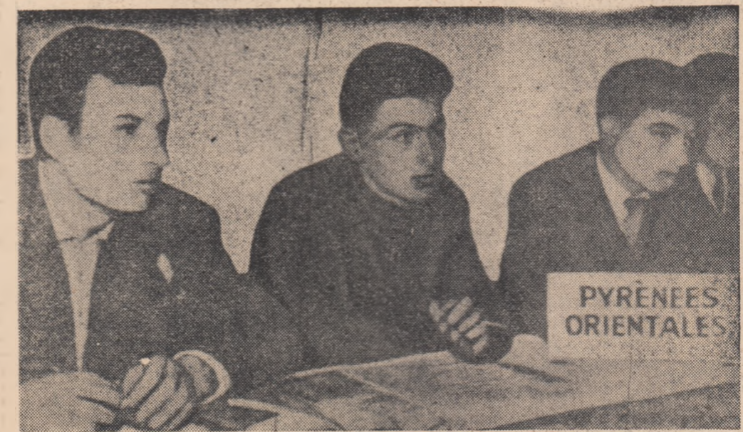
Un grup de tineri participanți la Congres.