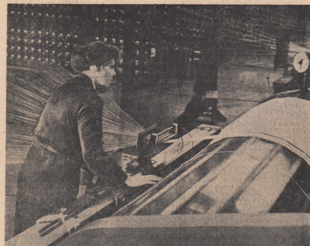
Producția de fibre sintetice a luat un mare avânt în Republica Populară Polonă. În fotografie un aspect din modernă fabrică de mătase artificială Gorzów

GENEVA 22 (Agerpres). — TASS transmite: La 22 martie a avut loc o sesiune a conferinței celor trei puteri în problema încetării experiențelor cu arme nucleare.