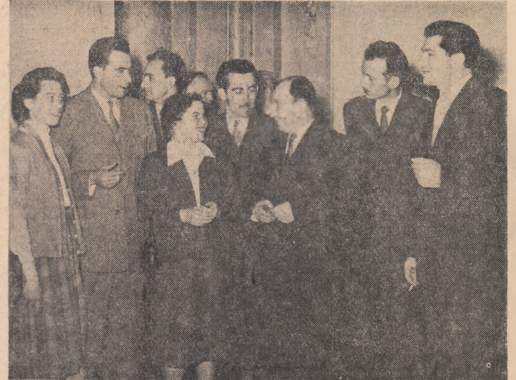
Într-o pauză a lucrărilor.

Data alegerilor se stabilește prin Decret de către Consiliul de Stat. Decretul poate fi emis și înainte de expirarea mandatului Marii Adunări Naționale.