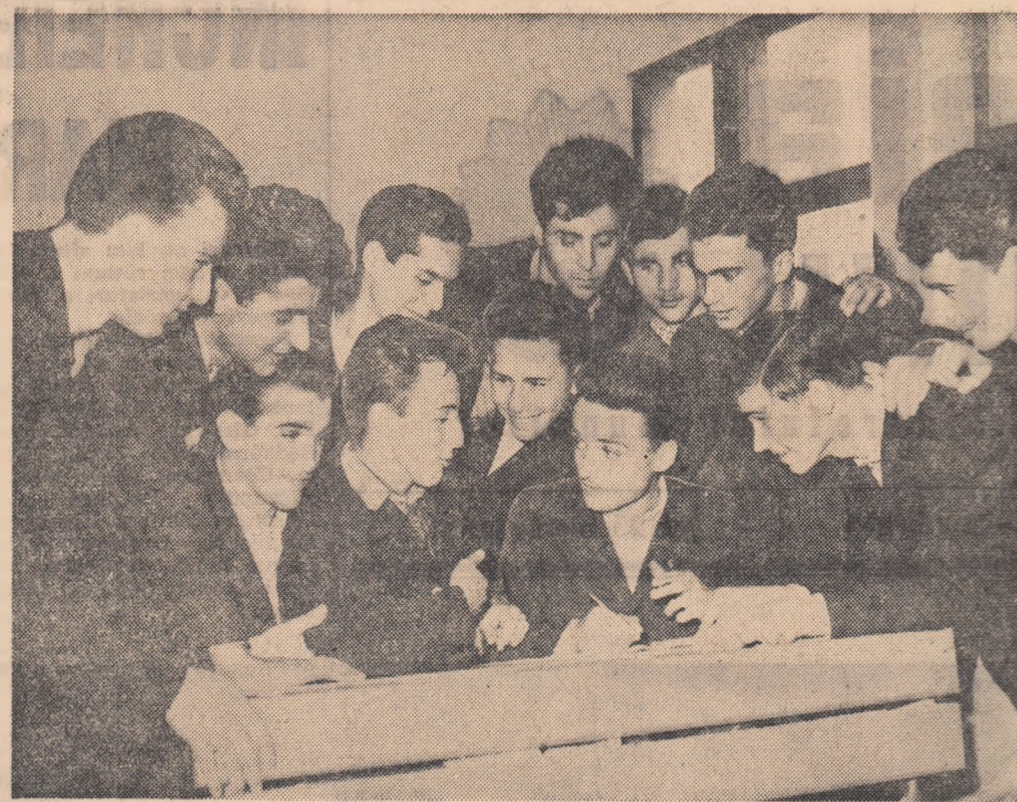
Vacanța de primăvară a sosit. Elevii din clasa XI-a B a Școlii medii „Filimon Sîrbu” din Capitală sînt hotărîți să devină campioni (și școlii bineînțeles) la handbal în 7. N-au început bine vacanța și-au și trecut la întocmirea formației care va întîlni echipele celorlalte clase. Și după cum se vede din fotografia noastră nu-i lucru ușor să întocmești oca mai bună reprezentativă.

ION PARASCHEVICU președintele comisiei de atletism a orașului București