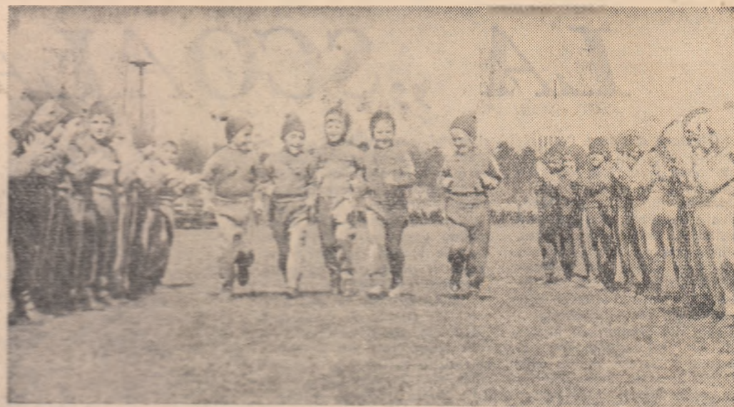
Sportivi și spectatori la primul concurs

Milioane de tineri din lumea capitalistă să învețe