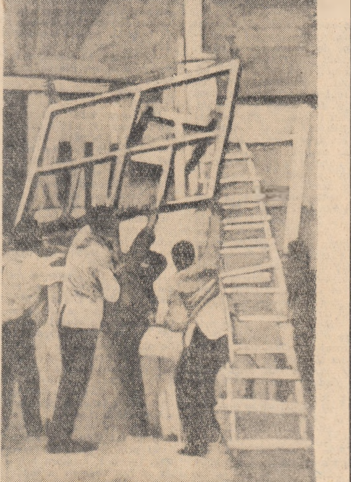
Lupta studenților italieni pentru mărirea numărului de burse, pentru taxe mai scăzute și pentru obținerea altor drepturi se intensifică tot mai mult. În fotografie: în semn de protest împotriva refuzului rectoratului de a li libera diplome, studenții Academiei de Belle Arte din Roma s-au baricadat în interiorul clădirii institutului lor.