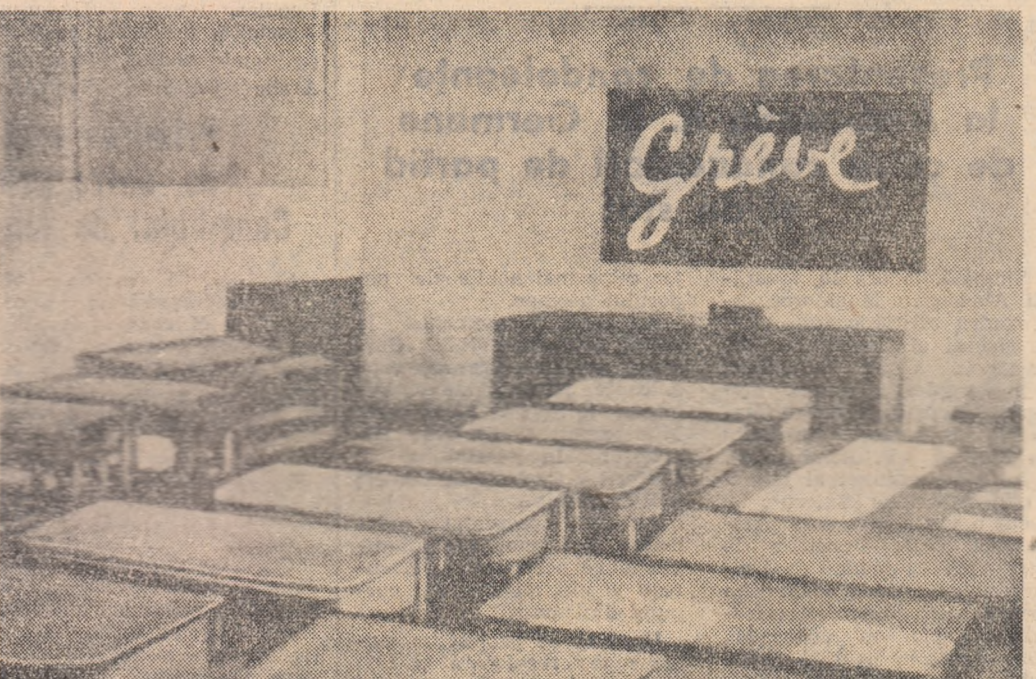
Grevă! Pe tablă, în sala de clasă goală, se află înscris acest cuvînt. Profesorii nu au venit astăzi la cursuri iar părinții în semn de solidaritate nu și-au trimis copiii la școală. Asemenea fapte se petrec aproape cotidian în Franța.

și mai mulți elevi nu sînt deloc rare. În timp ce școala elementară are nevoie în fiecare an de încă 14.000 de instituții, școlile normale din toată țara nu formează decît 6.000. Administrația este nevoită să atrîbie posturi de învățători la mii de persoane care nu posedă minimum de calificare pedagogică necesară. În școala medie situația este aceeași. La facultatea de științe din Paris un profesor la 269 studenți și un asistent la 134 de stu-