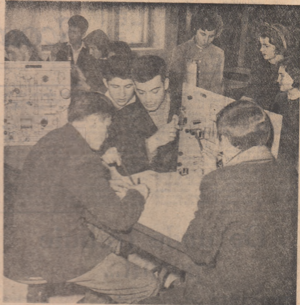
La cercul de fizică al noului laborator al Școlii medii nr. 4 din Galați.