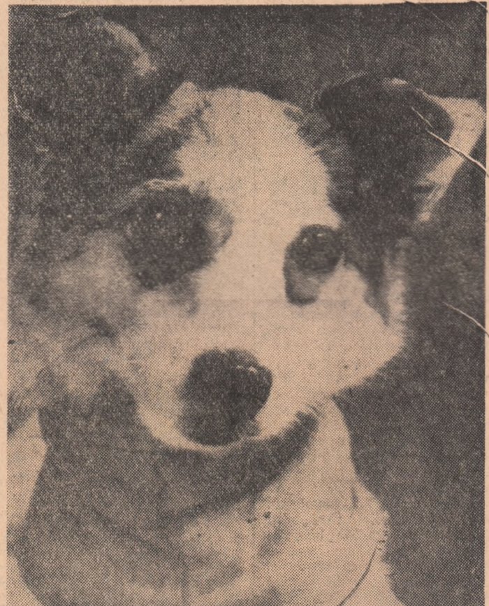
lată cățelușă „ZVIOZDOČKA” pasagera celei de-a cincea nave cosmice sovietice. După cum se vede, se simte foarte bine după zborul întreprins.