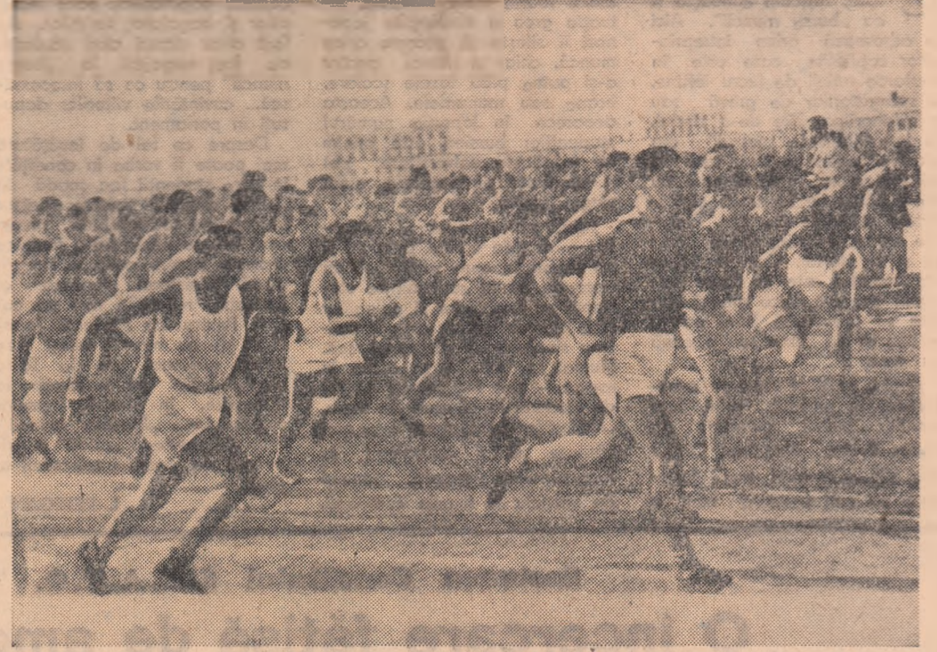
Aspect din cadrul crosului organizat de clubul Metalul București la 12 martie 1961 pe terenul II din Complexul stadionului „23 August”. Scopul? Depistarea elementelor talentate pentru atletism. Participanți: 1.500 tineri.

Vaca și prizonierul: Patria, I. C. Frumu, Arta; Războiul vesel: Republica, București; Flacăra, 23 August, Libertății; Flacăra zăpezii: Magheru, Elena Pavel, înfrățirea între popoare, V. Roșu, Al. Sahia, Miorița; Viraj în noaptea: A. Alecsandru, Lumina, Gh. Doja; Nu vreau să mă însor: Central, Unirea, Volga, B. Delavrancea; Fata din Kiev: Victoria; Regele Neapoliului: Maxim Gorki, Drumul serii; Pricindele — dimineața; Lady Hamilton — după-amiază: 13 Septembrie; Pricindele: Muna, G. Cosbuc; Portretul unui necunoscut: Tineretului, C. David, Aurel Vlaicu; Poveste nordică: 8 Martie; O fereastră deschisă spre cer: Al. Popov, Moșilor; Piine și trandafiri: Grivița, G. Bacovia, Donca Simo, 30 Decembrie; Congo în luptă, Rațiunea împotriva demenței: Olga Bancic; Cîntecul mării: Cultural; Calisele varietatului: T. Vladimirescu; Cocosău: Popular; Frumosa aventură: 16 Februarie; Sibona: M. Eminescu; rsul Alb: 8 Mai, Floreasca; Hatifa: N. Bălcescu.