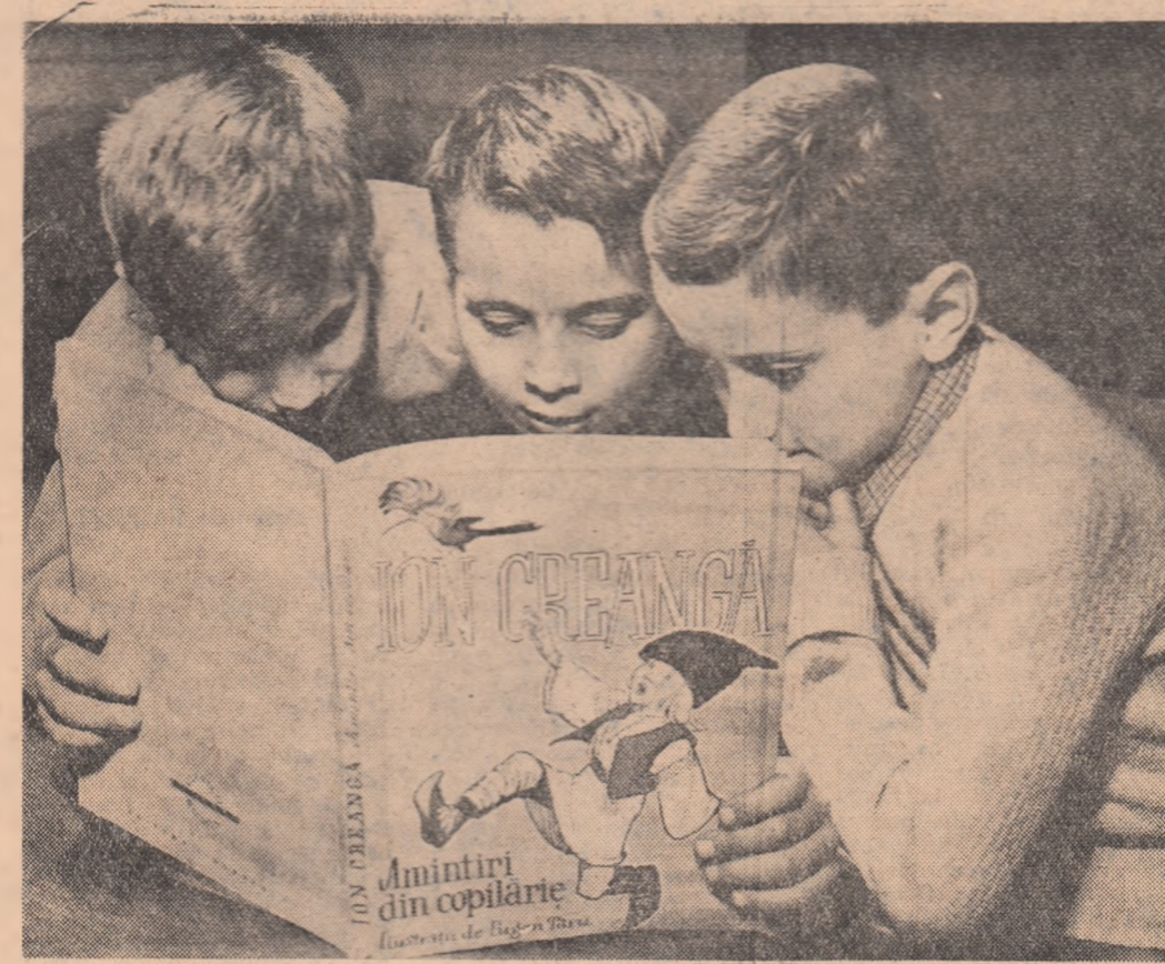
Și cea mai tînără generație de cititori o copiază de nădrăvniile lui Ionică.