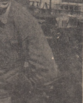
In cursul acestui an va începe să funcționeze parțial o mare uzină de termocentrale în orașul Karl Marx (R. D. Germană). În fotografie: Un grup de tineri constructori pe șantierul uzinei.

Existența lagărului mondial socialist, creșterea nenecitată a puterii lui — iată forța reală care este în stare să pună la respect pe imperialiști și să preîntîmpine un război mondial.