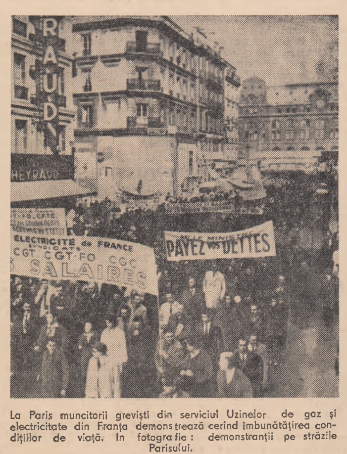
La Paris muncitorii greviști din serviciul Uzinelor de gaz și electrice din Franța demonstrează cerind îmbunătățirea condițiilor de viață. În fotografie: demonstrații pe străzile Parisului.

Pe lângă Combinatul din Szalimvaros funcționează școli și cursuri permanente de ridicare a calificării. În oraș funcționează de asemenea o școală medie de metalurgie care pregătește cadre de metalurghiști. În ultimii ani, la Szalimvaros s-au construit peste 5500 de apartamente, cîteva școli, un spital, un stadion, o casă de cultură, două cinematografe și alte clădiri.