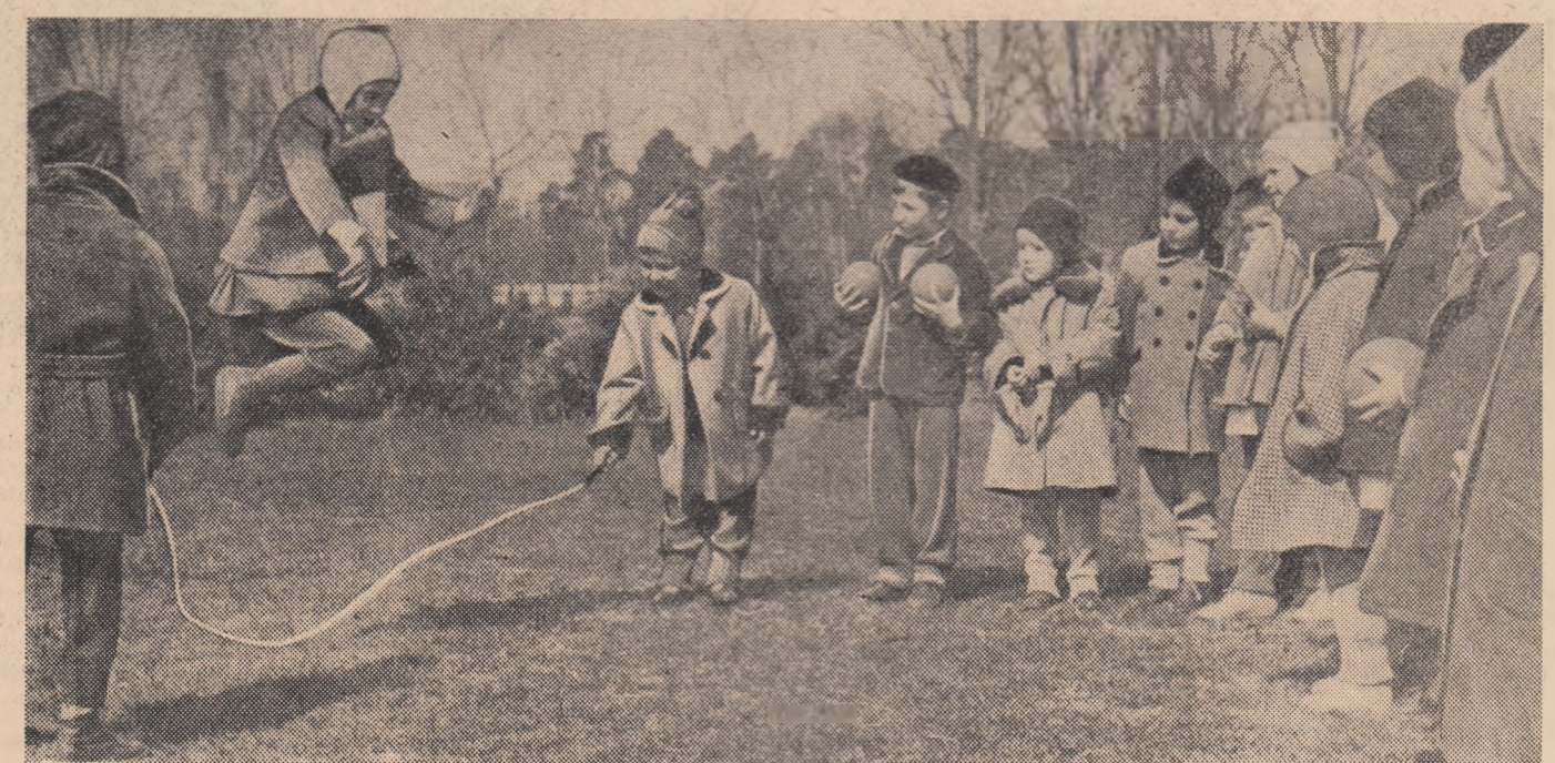
O întrecere... neoficială dar cu spectatori.

„Ne afirmăm încă o dată hotărîrea că vom învăța și ne vom pregăti în așa fel încît să îndreptăm