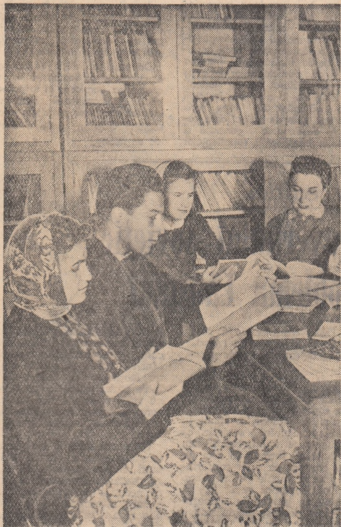
Un aspect din sala de lectură a bibliotecii centrale regionale din Baia Mare.

PRODUSE ALE ÎNTEPRINDERII „13 DECEMBRIE” SIBIU