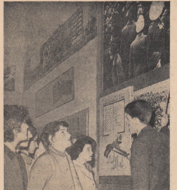
Muzeul de Istorie a partidului este vizitat în aceste zile de mii de tineri. Vă prezentăm în fotografia noastră un grup de tineri muncitori bucureșteni într-una din sălile acestui muzeu.