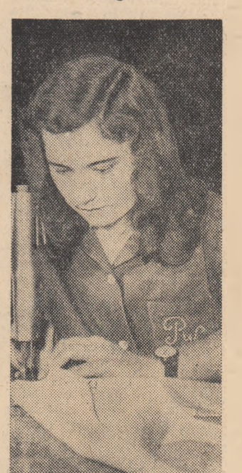
Utemista Rodnomschi Catalina de la Fabrica de confecții „Mondiala” din Satu Mare se situează printre frunțașele secției.