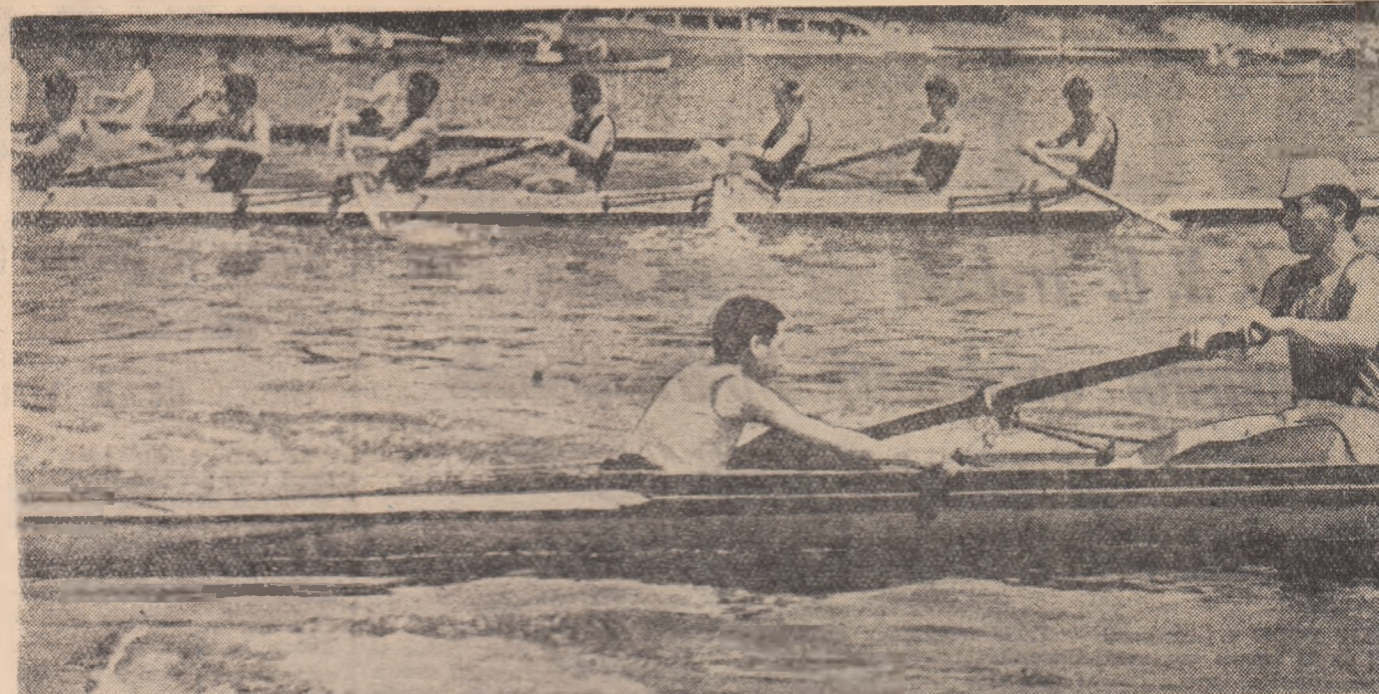
La îndemnul primăverii, canotorii au ieșit în larg.

Violoncelistul sovietic Sviatoslav Knushevski și-a început sîmbătă seara turneul de concerte în țara noastră. Ca solist al Filarmonicii de Stat „George Enescu”, artistul so-