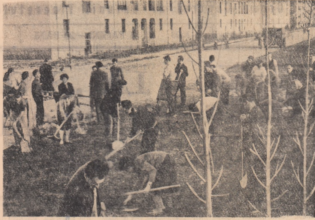
Pe Soseaua Mihai Bravu din Capitală au și apărut noi blocuri. Brigadierii ai muncii patriotice — cercetători de la Institutul de studii și proiectări energetice — amenajează pentru locatarii spații verzi: plantează pomi, sădesc flori.

• In anul acesta, numeroși tineri din raionul Ploiești au cerut să fie înscrși în brigăzile de muncă patriotică. Numărul brigăzilor a crescut astfel de la 222, cite erau anul trecut, la 252, numărul tinerilor brigadierii ai muncii patriotice depășind în prezent cifra de 9.500. Fiind bine organizate, avind obiective de lucru precise, brigăzile au reușit să obțină încă de pe acum succese remarcabile.