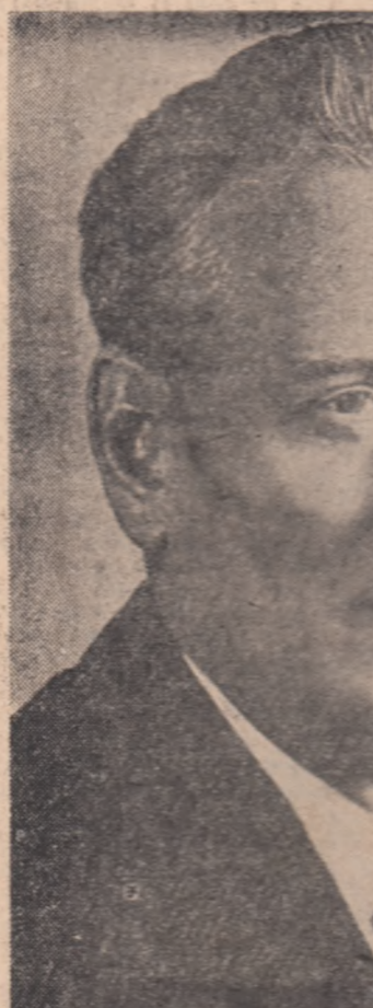
Primul secretar al Comitetului Central al Partidului Comunist din Cehoslovacia, Președintele Republicii Socialiste Cehoslovace, Antonin Novotny

antebeluc, 1937, producția industrială a Cehoslovaciei este azi de 4 ori mai mare. Și în domeniul agriculturii, socialismul a reperut o importantă victorie. Noile rețele de producție socialiste au ieșit victorioase și s-au consolidat în întreaga economie națională a R. S. Cehoslovace. R. P. Romînă și R. S. Cehoslovacă, alături de Uniunea Sovietică și de celelalte țări ale invincibilului lagăr al socialismului, luptă neobosit pentru pace trîdnică în lumea întreagă. Ele se pronunță cu fermitate pentru înlăturarea dezamării generale și totale, pentru triumful politicii leniniste de existență pașnică. Soluțind prezența în țara noastră a înaltilor oaspeți, poporul romîn e convins că această vizită va constitui o nouă și importantă contribuție la dezvoltarea pe mai departe a relațiilor de prietenie și colaborare romîno-cehoslovace, la continuă întîrire a lagărului păcii și socialismului. Tineretul romîn transmite înaltilor oaspeți din Republica Socialistă Cehoslovacă și prin ei întregului popor cehoslovac, tineretului frate cehoslovac, salutul său fierbînt. Bine ați venit, oaspeți dragi!