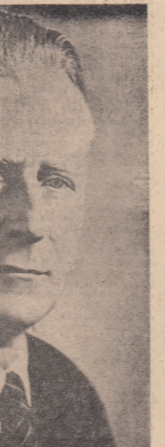
Președintele Guvernului Republicii Socialiste Cehoslovace, membru al Biroului Politic al C.C. al Partidului Comunist din Cehoslovacia, Viliam Siroky

Primul secretar al Comitetului Central al Partidului Comunist din Cehoslovacia, președintele Republicii Socialiste Cehoslovace, Antonin Novotny este unul dintre cei mai de seamă luptători ai clasei muncitoare și ai Partidului Comunist din Cehoslovacia. S-a născut la 10 decembrie 1904, într-o familie de muncitori și a învățat meseria de lăcătuș mecanic. Din tinerete a lucrat cu devotament și entuziasm în rîndurile Partidului Comunist din Cehoslovacia, al cărui membru a devenit în anul 1921. El a desfășurat o bogată activitate în siml organizației proletare de cultură fizică, fiind conducătorul uneia dintre asociațiile acestuia.