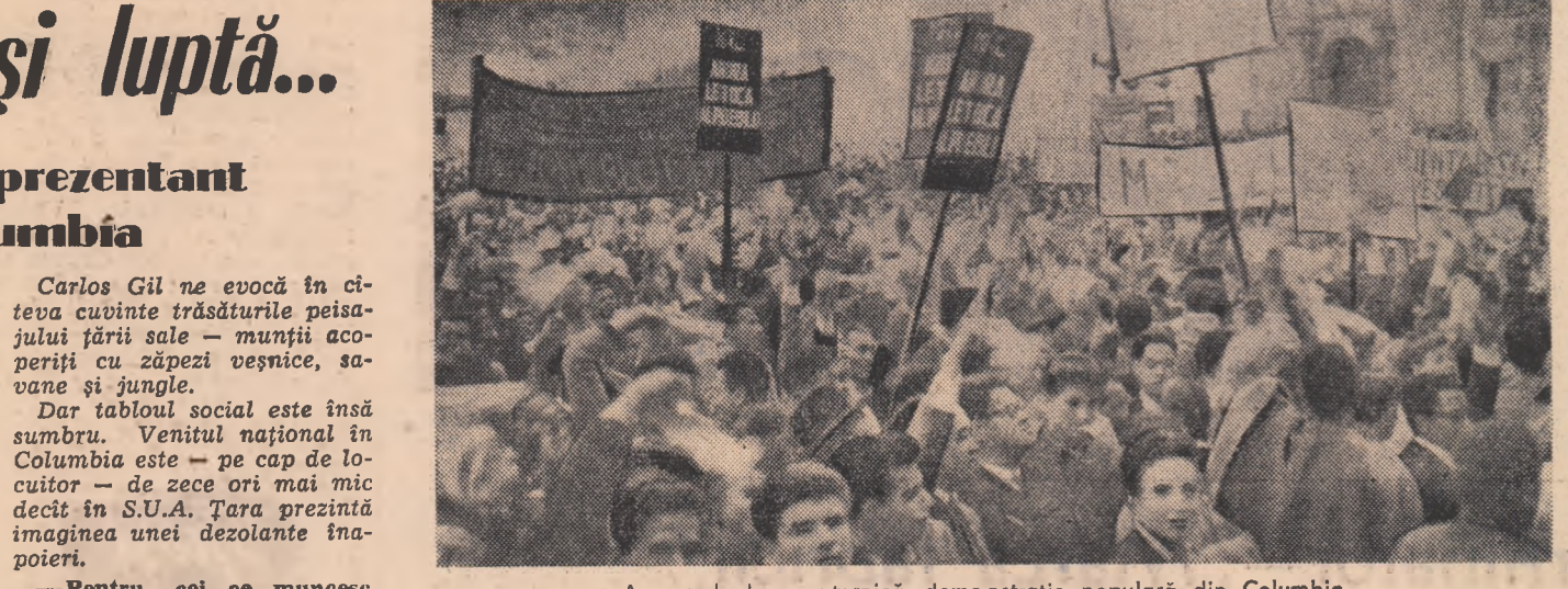
Aspect de la o puternică demonstrație populară din Columbia.

— Poporul Columbiei are de făcut față unei situații pline de dificultăți. Dictatura militară a fost răsturnată de cîțiva ani dar poporul meu nu se bucură de reale drepturi democratice. Represiunile împotriva forțelor patriotice se înmulțesc. În același timp, presa S.U.A. devin din ce în ce mai fășșe încercînd să provoace sgrumarea mișcărilor democratice. Coaliția forțelor reacționare își propune să împingă Columbia pe drumul