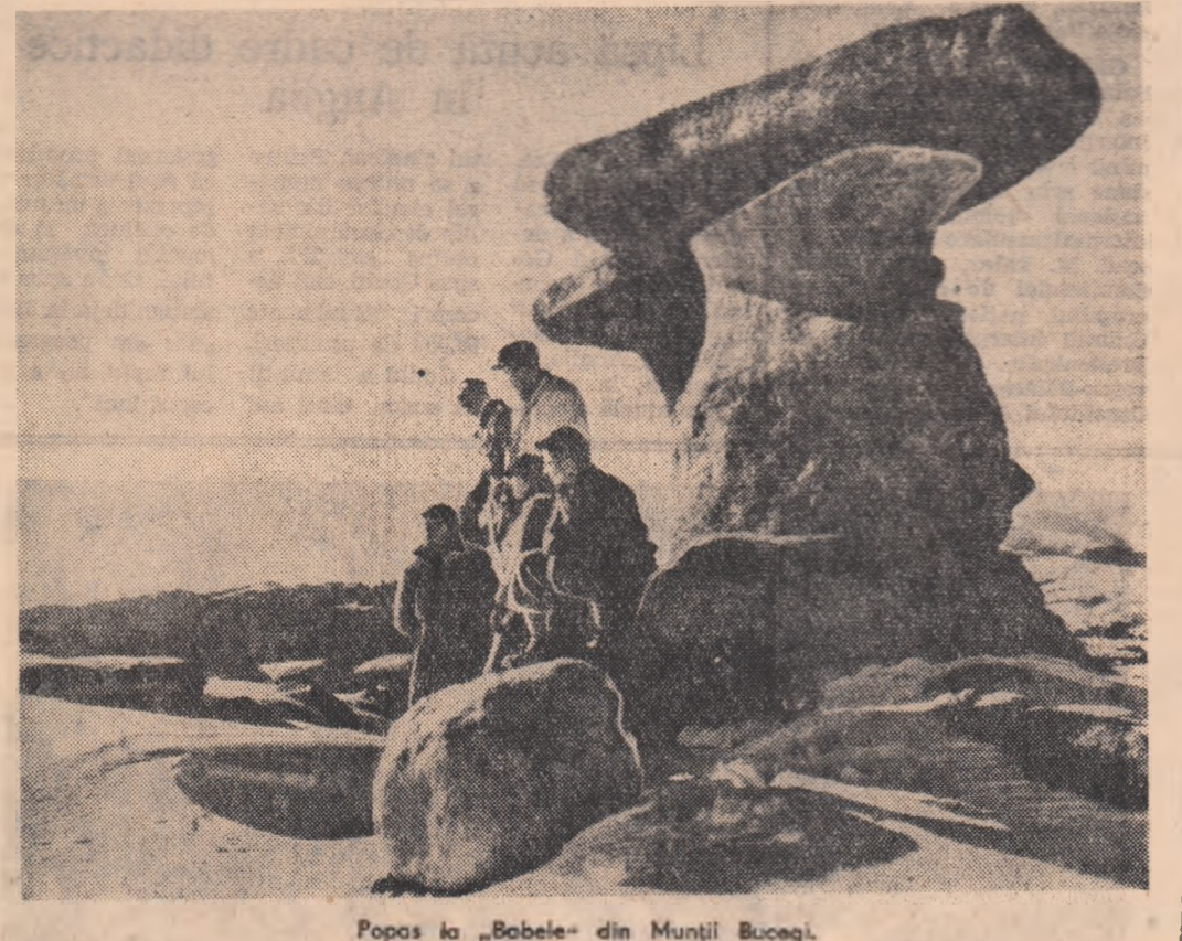
Popos la „Babele” din Munții Bucegi.

R. P. Romină — Belgia 1-0 Marți în orașul Coimbra din nordul Portugaliei echipa selecționată de juniori a R. P. Romine a susținut ultimul meci din preliminariile turneului de fotbal U.E.F.A. întîlnind echipa Belgiei. Tinerii fotbalști romini au obținut victoria cu scorul de 1-0 (0-0).