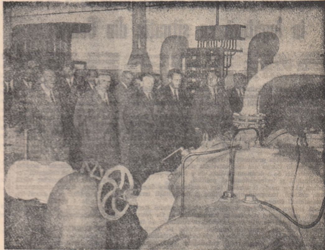
În vizită la Combinatul chimic Borzești.

În aplauzele și uralele puternice ale celor prezenți au luat loc la masa prezidului membrii delegației cehoslovace în frunte cu tovarășul Antonin Novotny și persoanele oficiale care însoțesc delegația.