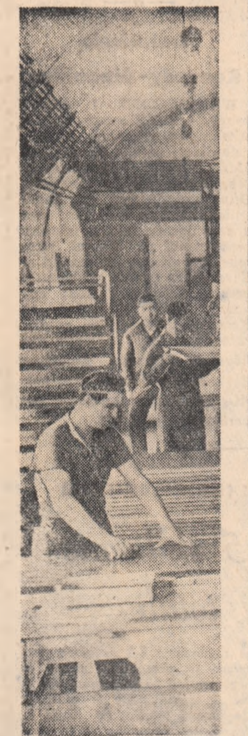
La fabrica de mobilă din cadrul I.P.R.O.F.I. București-Pipera care a intrat parțial în producție la sfîrșitul anului 1960 s-a fec în prezent ultimele lucrări de montare și revizie a agregatelor în vederea intrării în exploatare a tuturor sectoarelor de producție a fabricii de mobilă. Aspect din secția de șlefuit cu petrol a plăcilor de furnire.

— Procedeați toți utemistii din organizația noastră în felul acesta? Marea majoritate da. Dar nu toți. Unii mai chiulesc — și privirea secretarului se oprise asupra lui Apostol — alții fac muncă de proastă calitate și pentru ei primim observații pe drept de la brigada. Magdalena tresări și se uită repede în jurul ei. Și de