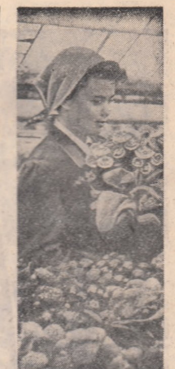
La Codlea, într-una din serele de flori ale întreprinderii Fructexport.

Harnicii constructorii ai noului oraș pot fi înțelșii în aceste zile la punctele forestiere Bogdana, Heltiu și Căiniș unde au plantat aproape 5 hectare au stejar. Tinerii de aici s-au angajat însă ca pînă la 8 mai să planteze 20 hectare. Corespondentul voluntar Iuliu Ciorna ne scrie: „Pe drumurile ce duc spre comuna Tîrșoș din raionul Oca ai să înțelșești alte zeci de tineri. Ei s-au angajat să repare toate drumurile comu-