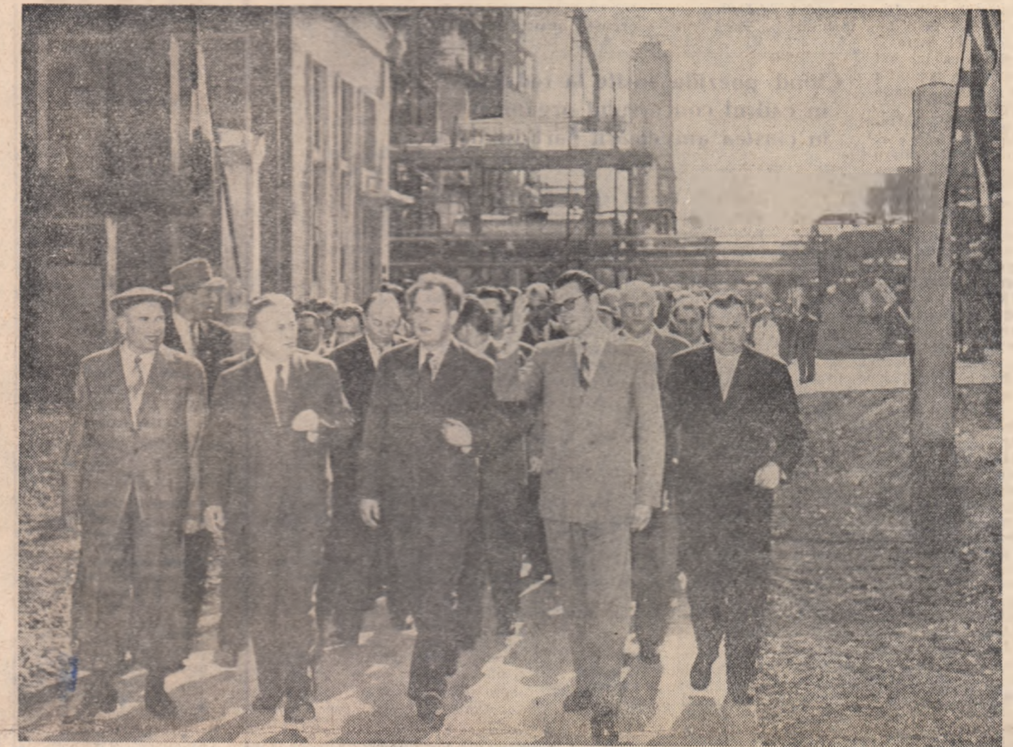
Oaspeții în vizită la Rafinăria 10-Onești.