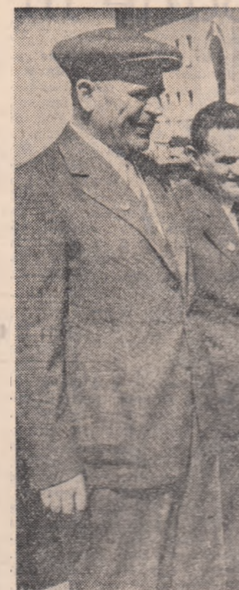
La Onești pionierii cu înțelșii cu flori pe înalții oaspeți.