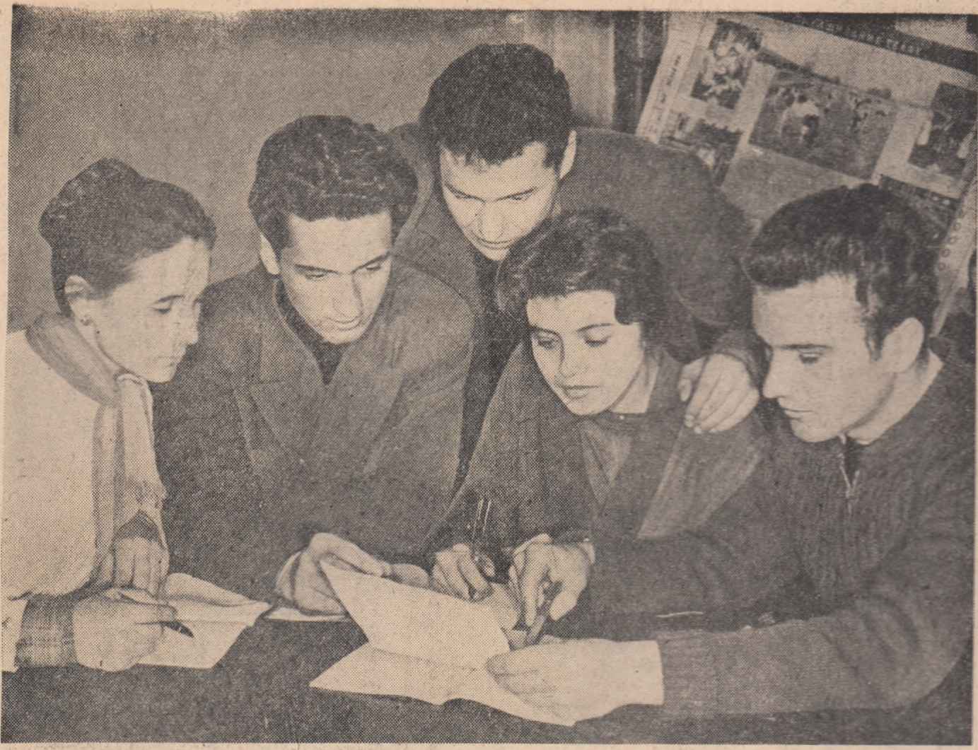
Grupă 150 din anul IV al Facultății de agricultură - Institutul agronomic din Craiova este fruntoasă la învățatură. În fotografie clijva studenți din grupă rezolvând în colectiv o problemă de studiu.