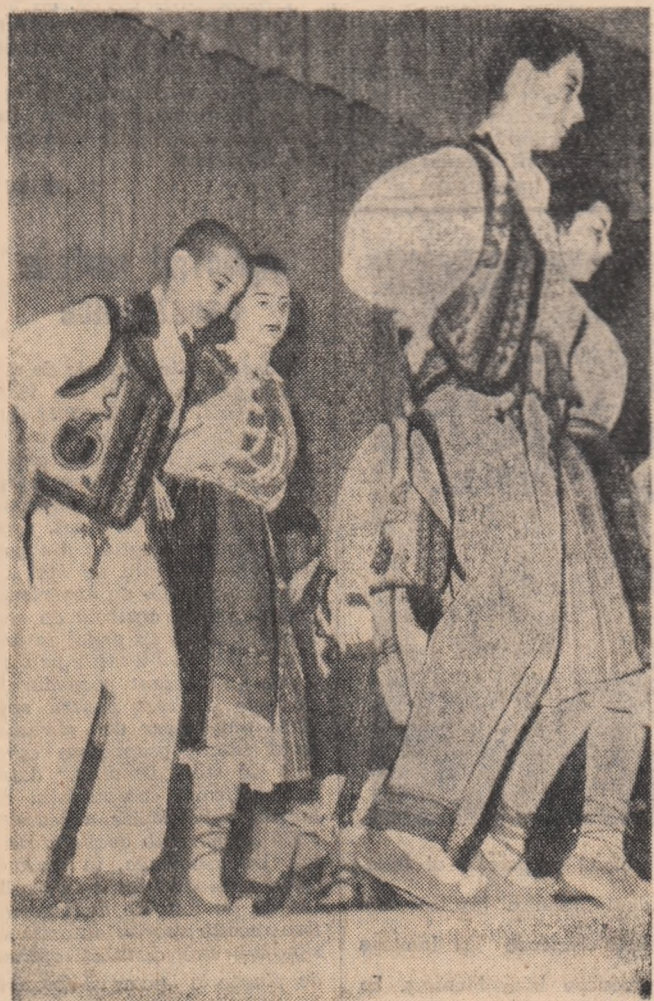
„Suiți olonească” un dans prezentat de echipa Școlii pedagogice din București

Mecul a început. Un cronichar de volei ar consemna neapărat că se fac destule greșeli tehnice, că se întrebunțează prea rar blocajele, că preluările sînt unele defectuoase, că... Dar ceva este mai important decît toate acestea. Noi notăm: se joacă entuziast, cu bună dispoziție, iar dacă se mai greșește uneori, cel în cauză își primește pe loc „pedeapsa”. Mustrele usturătoare a galeriei. Scor final: Filatură-Țesătorie 2-1.