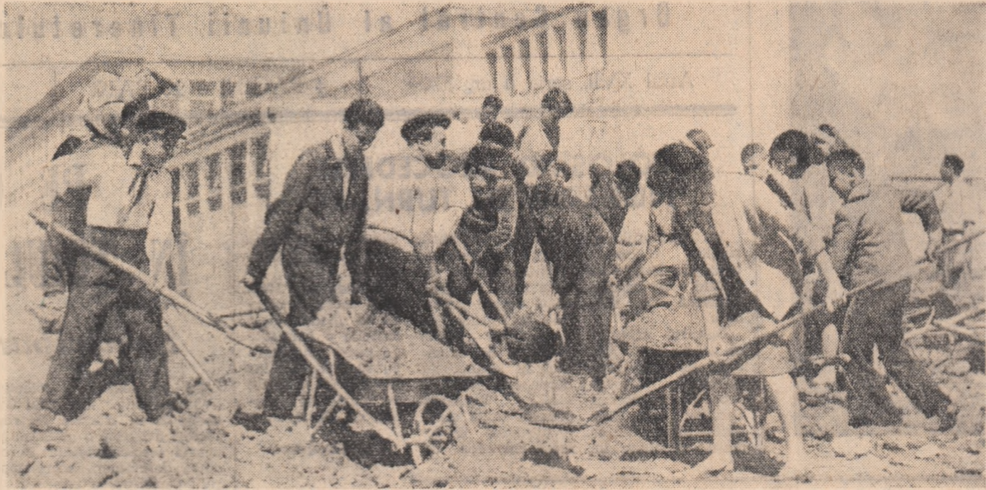
Zeci de elevi și părinți au luat duminică, cu prilejul deschiderii Concursului cultural-sportiv al tineretului, la amenajarea unei baze complexe sportive ce va deservi Școala medie nr. 23 „Dimitrie Bolintineanu” din București.