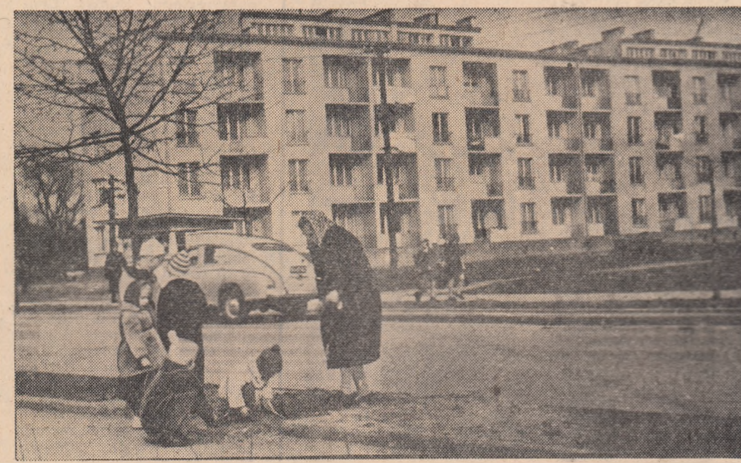
Noile clădiri din orașul polonez RZESZOW.

Muncitorii, tîrătorii ogoarelor, intelectuali, tineretul au ales în această zi pe cei mai buni reprezentanți în organele de stat ale puterii, al votat pentru programul înfloririi continue a Poloniei socialiste.