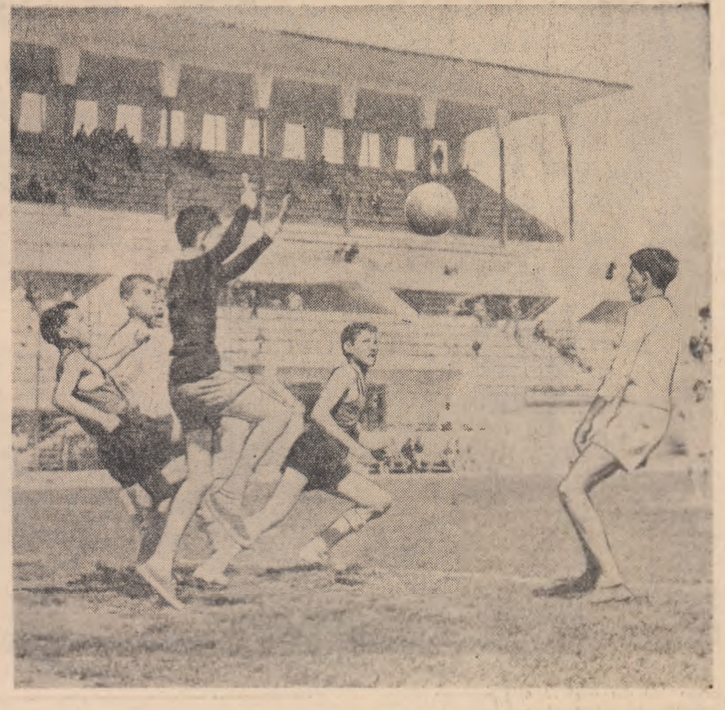
O fază polipitantă din timpul desfășurării unei partide de fotbal dintre echipa Școlii sportive de elevi din Ploiești și echipa de pitici a „Petrolului”.