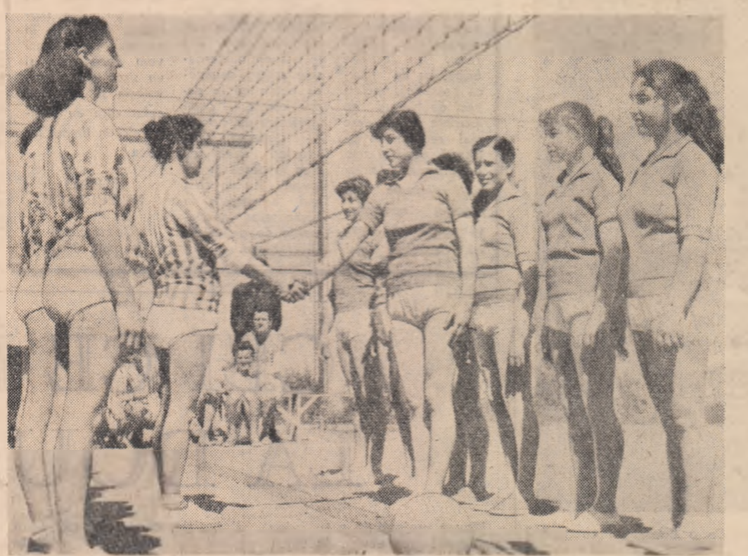
Căpitanii celor două echipe de volei de la Întreprinderea „Victoria socialistă” își string mîinile. Peste câteva secunde partida va începe.

Cu prilejul desfășurării Concursului cultural-sportiv al tineretului organizațiile U.T.M. trebuie să ia astfel de măsuri încît să fie atrași în activitatea culturală, artistică și sportivă un număr cât mai mare de tineri, încă din primele zile de desfășurare ale Concursului cultural-sportiv.