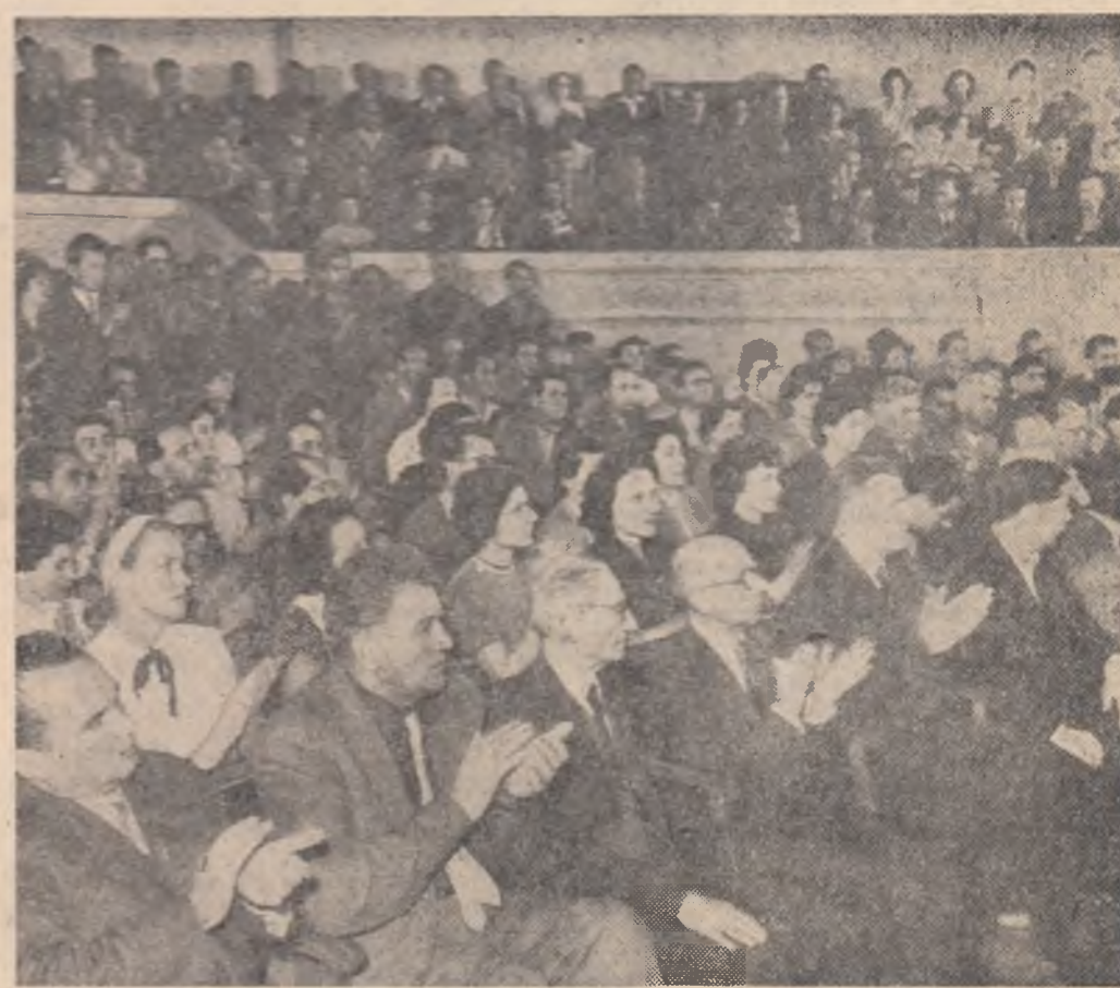
Aspect de la mitingul de protest al oamenilor de știință din Capitală.

● Poporul cuban își apără cu îndrăjire patria (pag. IV-a)