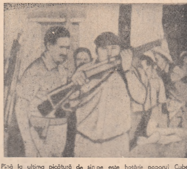
Pînă la ultima picătură de sînge este hotărîrea poporului Cubei să-și apere libertatea. Fotografia noastră înfățișează luptătorii ai mișcării populare.