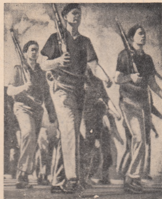
Poporul cuban își apără cu arma în mînă libertatea patriei.