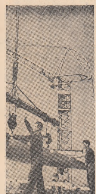
La blocul nr. 1 din lotul nr. 2 șantierul Pieptăreni se montează încă un etaj din elemente prefabricate.

gospodăriile colective însămînțează și 12 soiuri noi de plante de cultură, pentru care grîu de primăvară, ovăz, in de ulei și de furaj, de leguminoase boabe și plante furajere. Începînd din primăvara acestui an G.A.S. și gospodăriile colective extind în cultură 15 soiuri noi de plante agricole primare, în cadrul schimbului reciproc de seminte valoroase, din Uniunea Sovietică, R. P. Bulgaria, R. D. Germană și din alte țări.