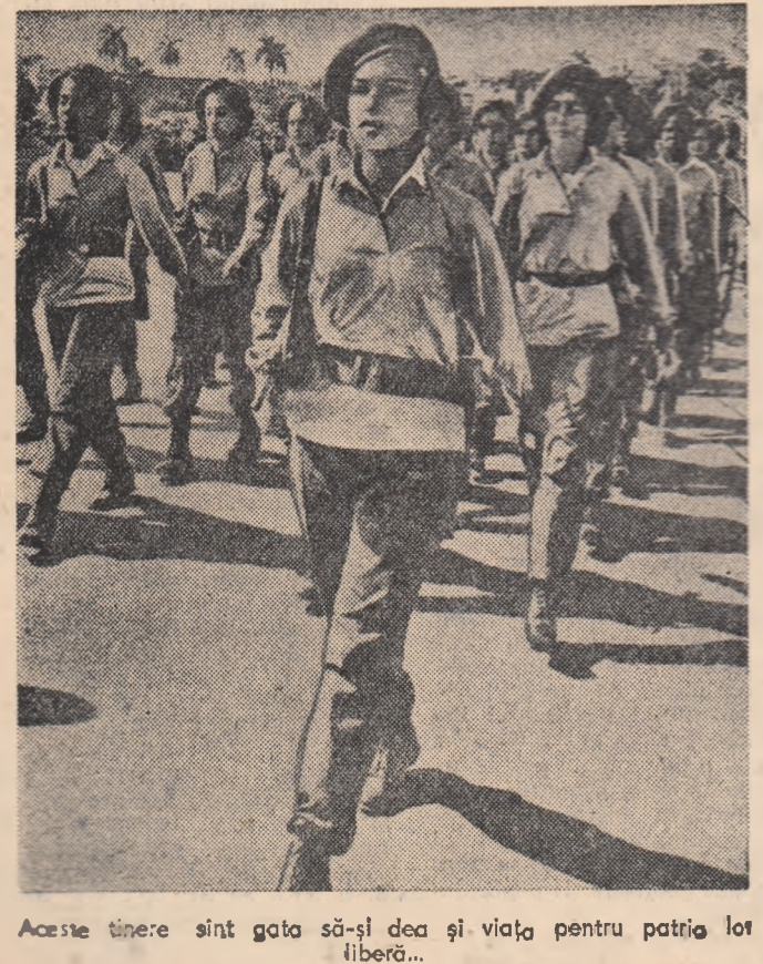
Aceste tinere sînt gata să-și dea și viața pentru patria lor liberă...

Mii de oameni au defilat prin fața clădirii ambasadei. Mulți dintre ei au venit direct de la lucru. Demonstrații s-au instalat pe grămezile de blocuri de beton armat, pregătite pentru repararea caldărilor, în benele autocamionelor, pe garduri. Unii s-au cășărat pe două macarale. Pe brațul uneia dintre macarale demonstrații au arborat drapelul de stat al Republicii