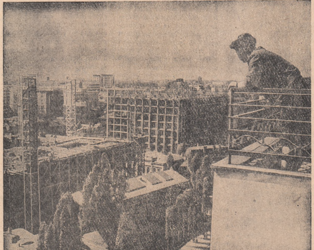
Construcții noi pe Bulevardul Magheru.

Comitetul Central al Partidului Muncitoresc Român