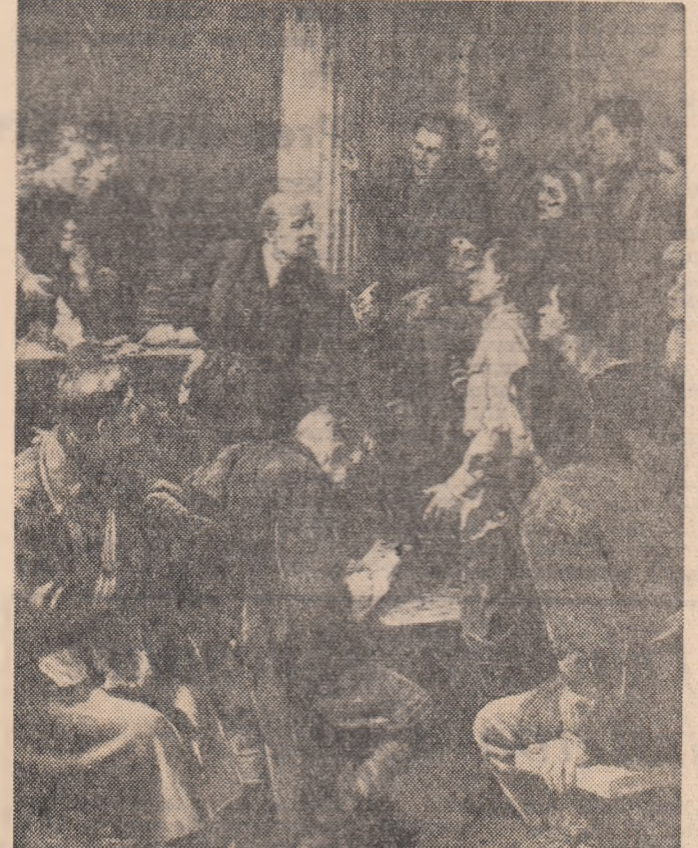
V. I. Lenin în mijlocul delegaților la cel de al III-lea Congres al Comsomolului, (pictură de P. BELOUSOV)

(Din „Amintiri despre V. I. Lenin” vol. II.)