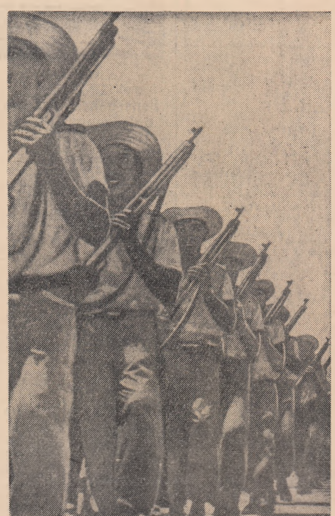
Armata revoluționară cubană stă de straji apărării patriei.