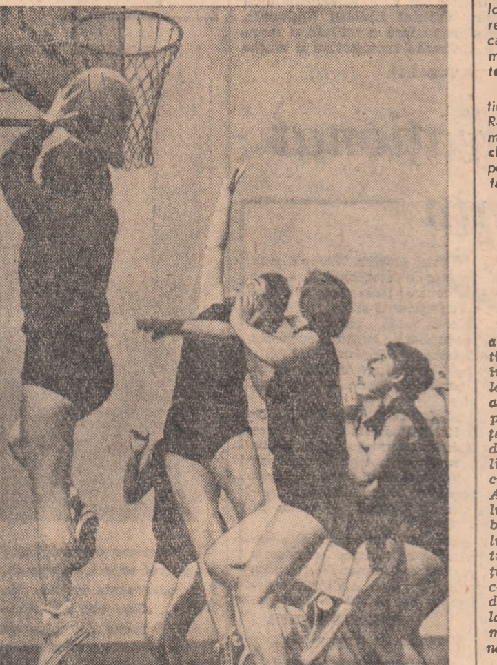
Echipa de baschet-fete a Complexului școlar din Bîrlod, în timpul unei întreceri.