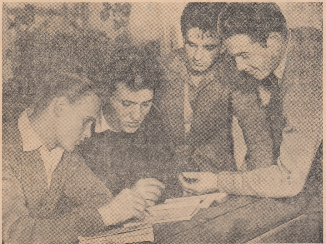
Elevii din clasa a IX-a a Școlii medii serale nr. 11 a Altilerelor C.F.R. Grivița Reșe din Capitală, rezolvind împreună probleme de matematică.

Prin telefon de la trimisul nostru special, am primit din partea tovarășului Gheorghiu-Dej, prim-secretar al Comitetului Central al Partidului Muncitoresc Român și președintele Consiliului de Miniștri al R. P. Române, un cald și frățesc mesaj de prietenie din partea Comitetului Central al Partidului Muncitoresc Român, a guvernului Republicii Populare Române, a tuturor oamenilor muncii din țara noastră.