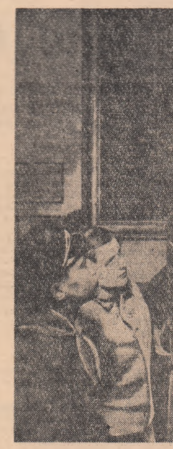
În vizită la Muzeul Doitana.