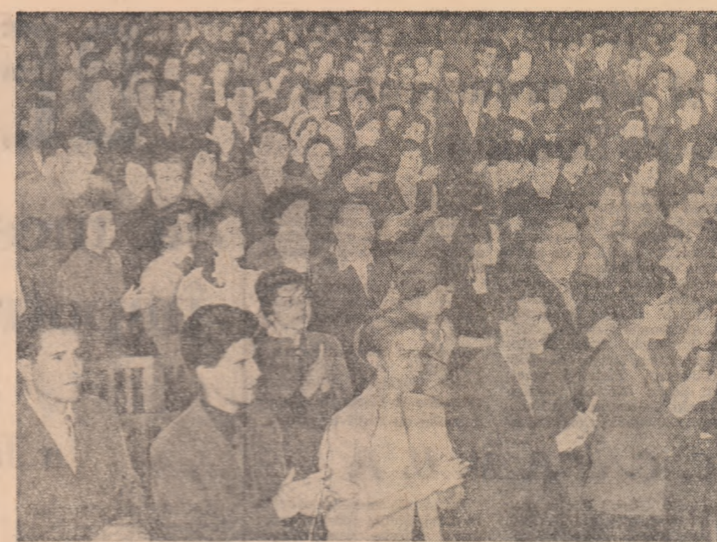
Aspect din timpul educării tineretului din Capitală consacrată „Zilei mondiale de luptă a tineretului împotriva colonialismului, pentru coexistență pașnică”