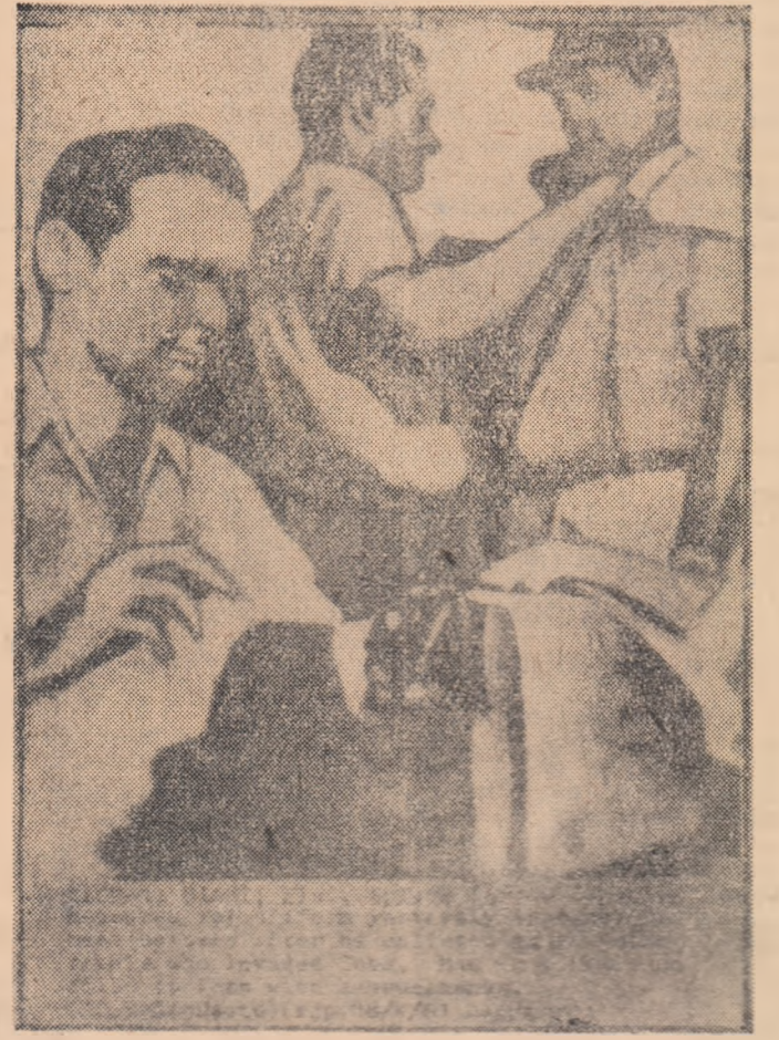
În orașul american Miami bandiții contrarevoluționari li se confecționează uniforme... americane. Această imagine a fost transmisă de Agenția americană Associated Press în preajma invadării Cunei

În încheiere, Castro a declarat că acea parte a umanității care se pronunță pentru pace este uriașă. Astăzi Cuba este o parte a întregii lumi și în cazul unei agresiuni a imperialismului american împotriva Cubei, acesta din urmă va fi nevoit să intre în conflict cu întreaga lume.