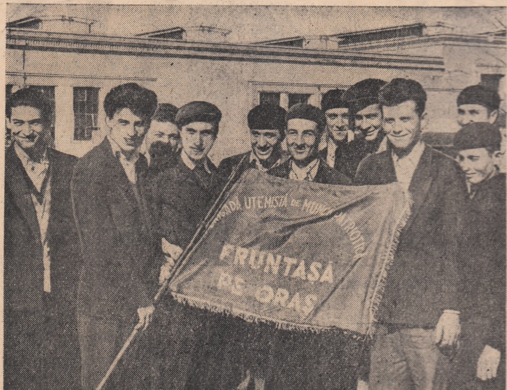
Brigada utemistă de muncă patriotică din secția forje a Fabricii de rulmenți din Bihor a primit pentru rezultatele sale drapelul de brigadă fruntașă pe orăș...