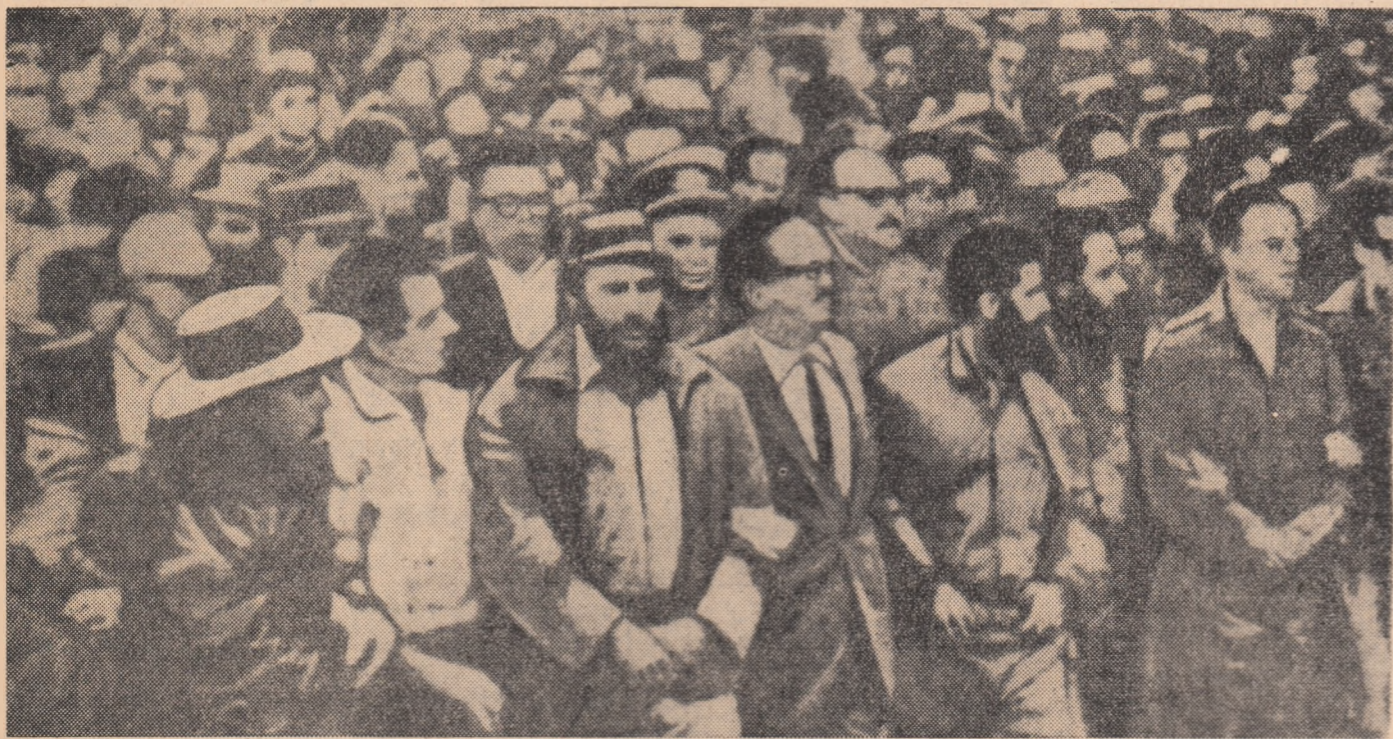
Fidel Castro și Osvaldo Dorticos înconjurați cu dragoste de oameni ai muncii din Cuba