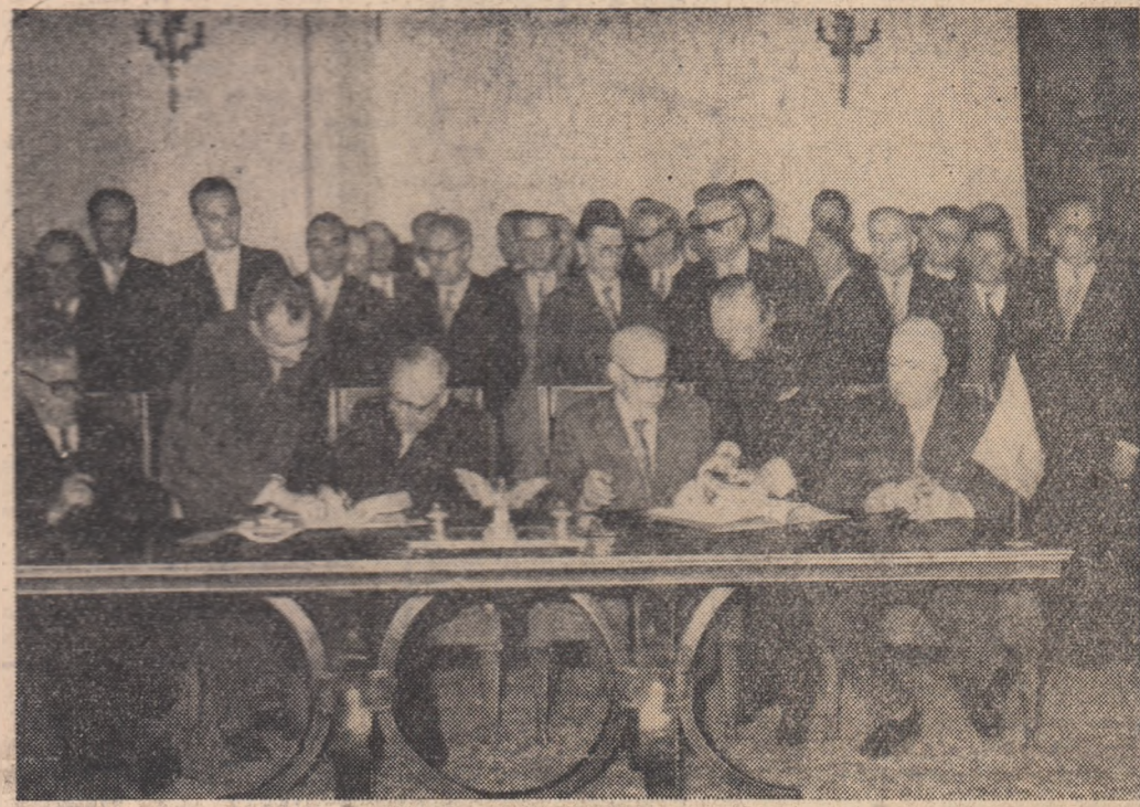
Aspect de la semnarea Declarației