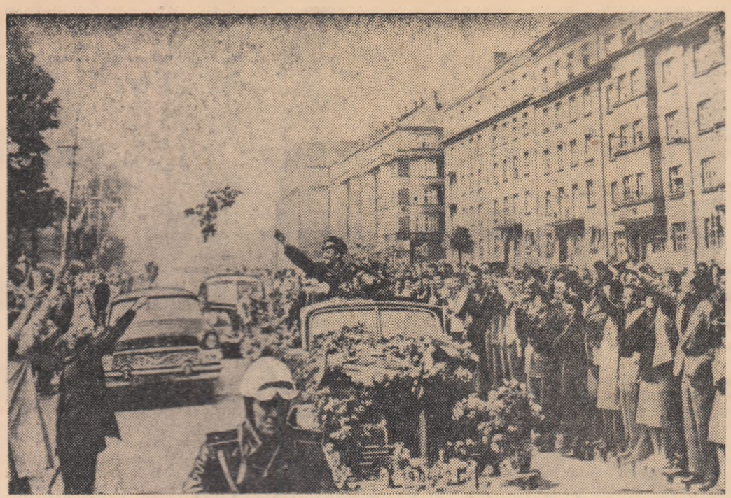
Sosirea lui Iuri Gagarin la Praga

HANOI 29 (Agerpres). — Un purtător de cuvînt al Ministerului Afacerilor Externe al Republicii Democratice Vietnam a făcut la 29 aprilie o declarație în care a protestat cu fermitate împotriva faptului că S.U.A. continuă livrările militare pentru rebelii laotieni. Gravitatea acestor acțiuni, a declarat purtătorul de cuvînt, constă în faptul că aceste livrări au început chiar îndată după ce copredinții conferinței de la Geneva au dat publicității mesajul lor cu privire la reglementarea pașnică a situației din Laos.