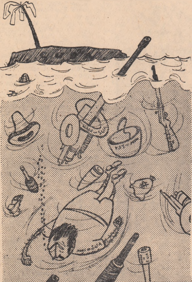
Peisaj sub... marin din marea Caraibilor. Desen de V. VASILIEV

menii nu se mișcă din loc. „Nu!”, „Nu!” scandează și în cor. Cineva începe un vechi cîntec negru, devenit în ultima vreme extrem de popular printre luptătorii pentru pace americani: „Vom trăi în pace, vom trăi în pace. Pe noi nu ne veți speria!”. Cîntecul este reluat de toți ceilalți. Polițiștii mîtășoși îi înșfacă pe demonstranții și-i țîră cu forța în automobile. Mulțimea însă nu se împrăștează. Demonstrații de protest împotriva ațîșării isteriei războiului și cursei înarmării au avut loc și la Uni-versitatea Columbia, ca și într-o serie de colegii și școli din New York.