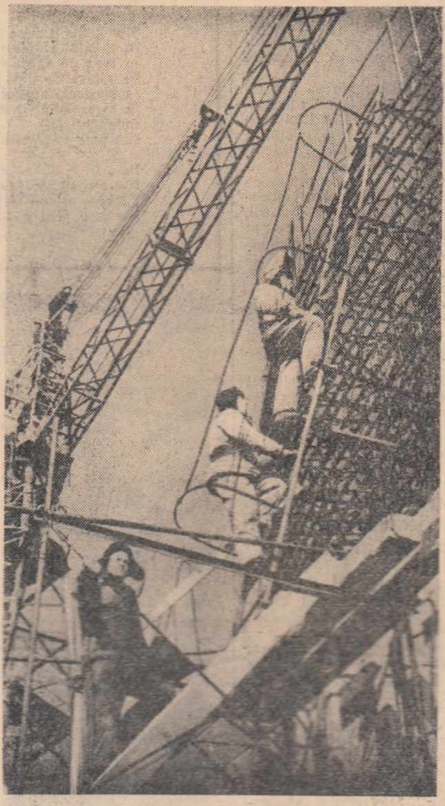
Pe șantierul marei combinat de ciment de la Djelgor din (ținuturile destelenite)