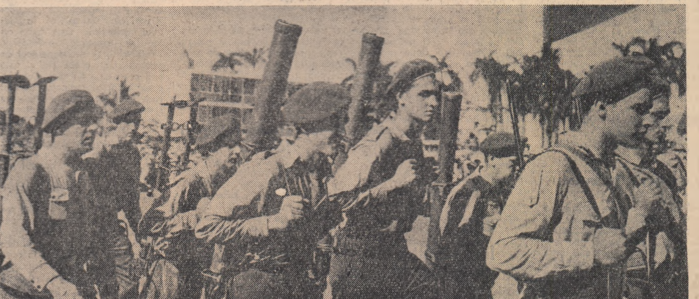
De strajă cuercinilor revoluționare ale poporului cuban

Lupta tineretului englez dovedește că el este pe deplin conștient de importanța pe care o au în zilele noastre acțiunile menite să contribuie la dezarmarea, la înfrângerea și la