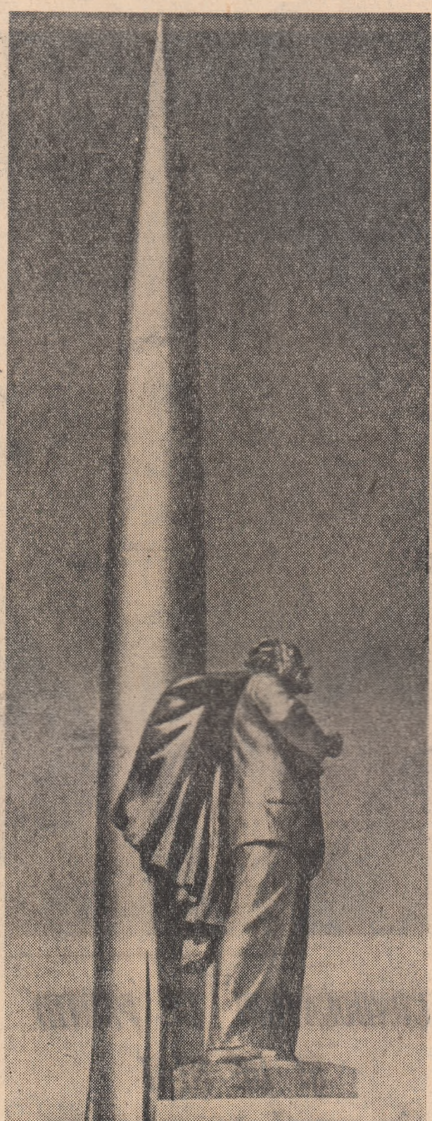
Monumentul ridicat lui C. E. Iliovskii în orașul Koluga.