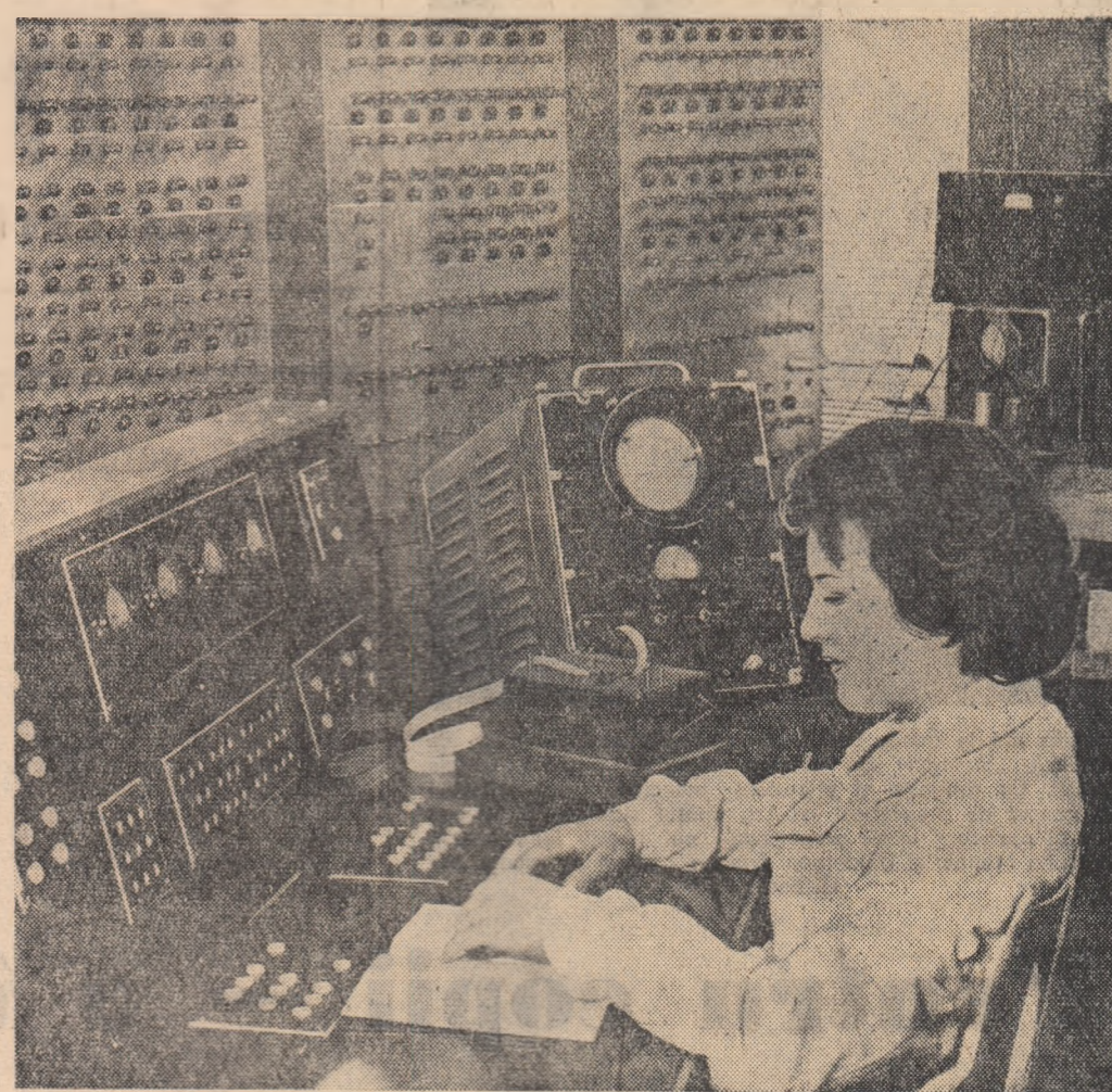
Mașină de calculat — CIFA-2