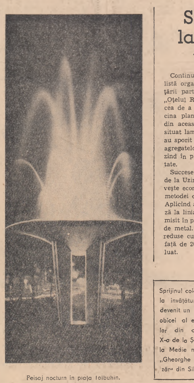
Peisaj nocturn în piața Tolbuhin.

Există pe lângă volumele tipărite, un număr impresionant de cărți, deocamdată numai în manuscris, în paginile cărora se ascund nenumărate povestiri, poeme și romane, trăite și relatate fără pretenții literare, și, poate tocmai din această cauză vii și palpabile ca viața însăși. Am citit citeva din aceste cărți inițiale, școlărești, „jurnale de unitate”. Unele dintre marile personalități ale istoriei ne-au oșignuit cu jurnalele, scrierile de cele mai multe ori pentru uzul posterității, jurnale în care conturile personale sint mistificate mai mult sau mai puțin abil și în care subiectivismul se plimbă ca la el acasă. Fără să cunoașcă existența acestor cărți în sate și sate de jurnale din care posteritatea va putea reconstitui cu ușurință viața tumultuoasă și fericită pe care ei o trăiesc astăzi.