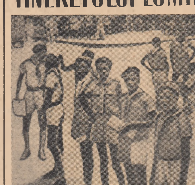
Fotografia de mai sus a fost luată din Conakry. Ea înfățișează un grup de cei mai tineri căștîeni ai tinerii republici africane Guineea — pionieri