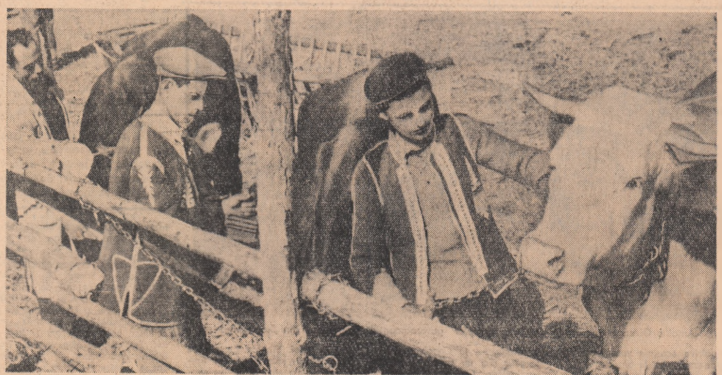
Îngrijirea atentă a vacilor proprietate obștească este o preocupare de fiecare zi a tinerilor colectivști crescători de animale din comuna Vasluiș, raionul Oltenița

„Încă din primele zile ale primăverii pomii aceștia au înflorit, iar mulți dintre ei au dat de-a dreptul în floare. Pe coamele dealurilor, pînă mai deunzi golase, au apărut acum mari înfloriri de livezi care-și vor lărgi marea împărăția fiindcă de fapt, în raionul 19, jumătate de plantare de pomi fructiferi și vișă de vie prin munca patriotică a tineretului abia a început. Așa încît nu va trece multă vreme cînd, primăvara urcînd pe piatra Parîngului și privind jos, pe firul Vîșii Jiului, marea aceea cu valuri statornice îi va apare călătorului albă ca de spumă din albul pomilor în plină floare.