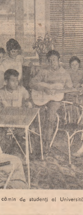
Moment muzical în noul cămin de studenți al Universității „C. I. Parhon” din București.