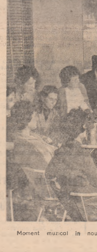
Moment muzical în noul cămin de studenți al Universității „C. I. Parhon” din București.

— Și care sint rezultatele? — Pînă acum, la propunerea organizațiilor U.T.M., au fost create în întreprinderile orașului 54 de noi cursuri