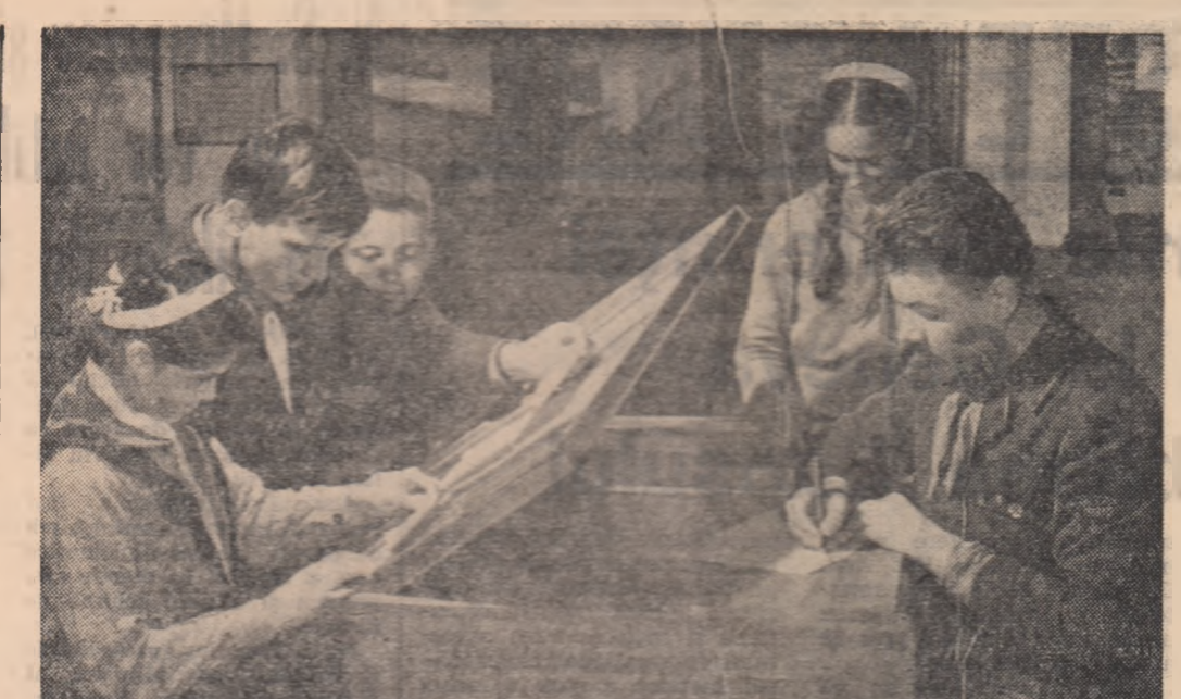
Pregătind un nou număr al gazetei de perete. (La Școala de 7 ani nr. 110 din Copitole).