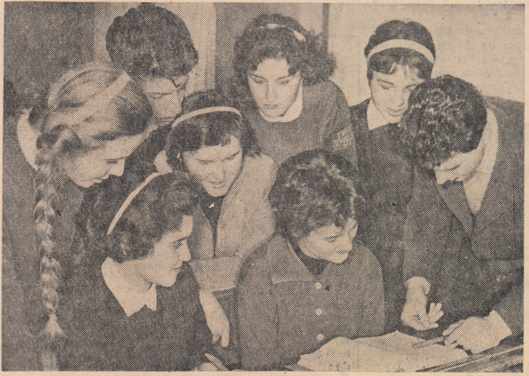
La pregătirea semenilor, în colectiv.