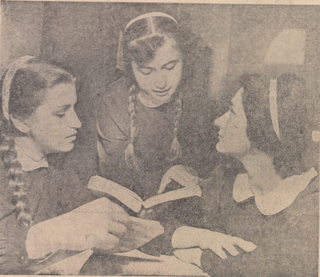
Pregătirile pentru sfîrșitul anului școlar se desfasoară cu intensitate și în biblioteca Școlii profesionale „Partizanul Roșu” Brașov