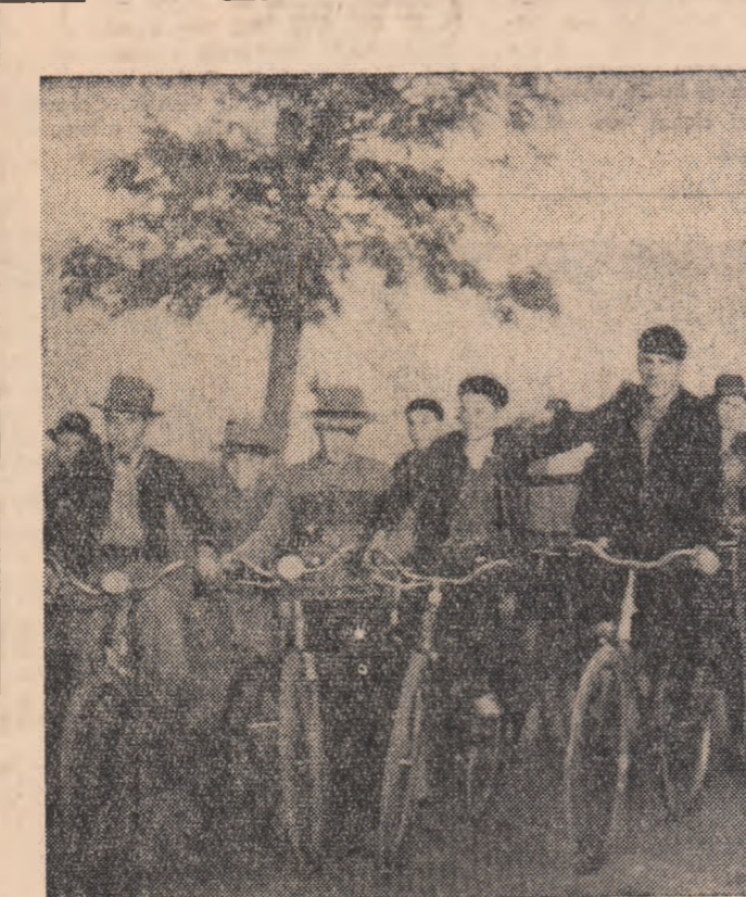
O cursă ciclistă? Nu! Imagiunea noastră reprezintă tinerii din comuna Țibucani, raionul Alexandria, plimbându-se într-o zi de repaus.