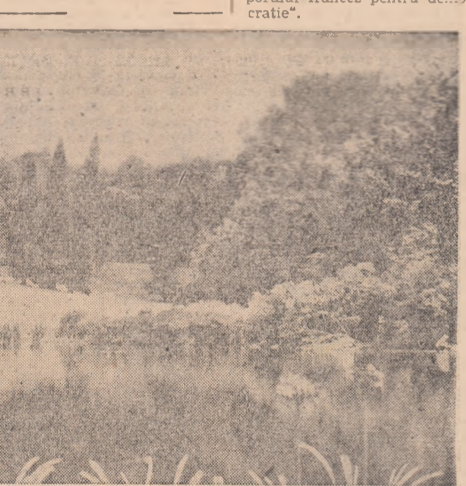
INDONEZIA. Un aspect al grădini botanice „Tjibodas” pentru plante subtropicale de lângă Sindanglaj.

Duminică și luni, mil de partizani ai păcii din întreaga Franță au sosit în localitatea Evian. Delegațiile compuse din muncitori, tineri, soldați demobilizați, mame, au fost alocate în adunări publice pentru a exprima cererea poporului francez ca tratativele să se poarte pe baza respectării drepturilor algerienilor la autodeterminare și la unitatea teritoriului algerian. În timp ce delegația franceză a refuzat să primească pe reprezentanții partizanilor păcii, între aceștia și membrii delegației algeriene au avut loc numeroase întâlniri. Primind pe partizanii păcii, Ben Fahia a declarat: „Lupta poporului algerian pentru libertatea sa este inseparabil legată de lupta poporului francez pentru democrație”.