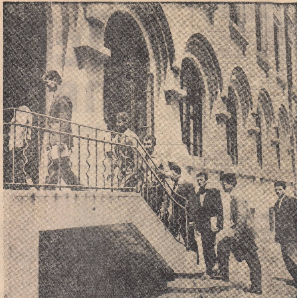
Grupa 152 a Institutului agronomic din Craiova s-a prezentat în întregime la examene. Iată-i îndreptîndu-se spre sala de examene