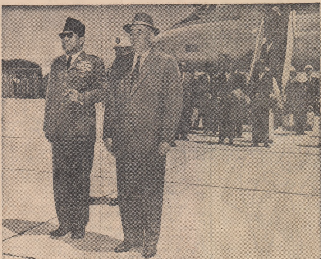
Pe aerodrom, la sosirea înaltului oaspete

Președintele Republicii Indonezia, dr. Sukarno, a sosit miercuri în Capitală. Înaltul oaspete face o vizită de prietenie în țara noastră.