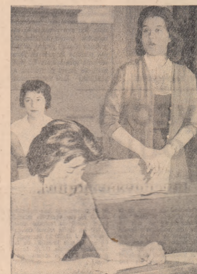
Ord de consultație pentru cei din clasa a XI-a