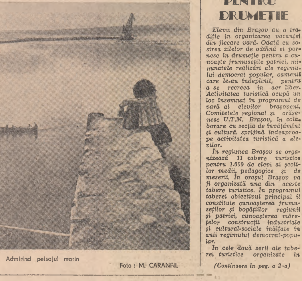
Adminînd peisajul marin.