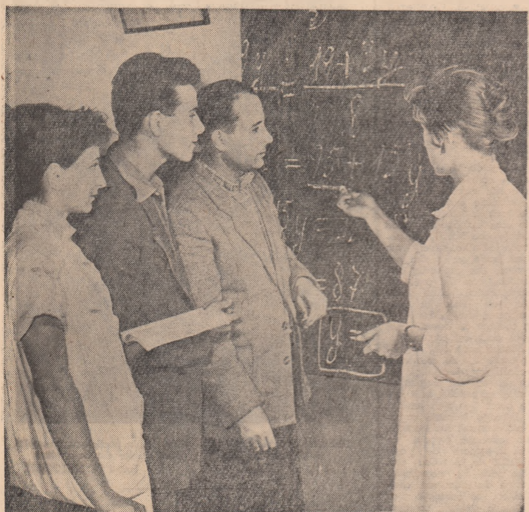
La cursul de pregătire pentru viitorii seraliști, ce se desfășoară pe lângă Uzinele „Grigora Protopoșo” din Capitală

Elevii claselor a XI-a de la Școala medie nr. 1 — Giurgiu trăiesc din plin emoția apropiatului examen de maturitate. Emoția aceasta se împletește cu dorința fiecăruia dintre ei de a se prezenta cât mai bine pregătit la examen. Marea majoritate a elevilor privesc cu multă seriozitate activitatea ce trebuie să o desfășoare în această perioadă cînd la școală se organizează pentru ei lecții speciale ajutoare în vederea examenului de maturitate. S-au constituit grupe de învățare, în cadrul cărora elevii se pregătesc împreună. Rezultate frumoase s-au obținut și în ajutorarea unor elevi slabi la învățare.