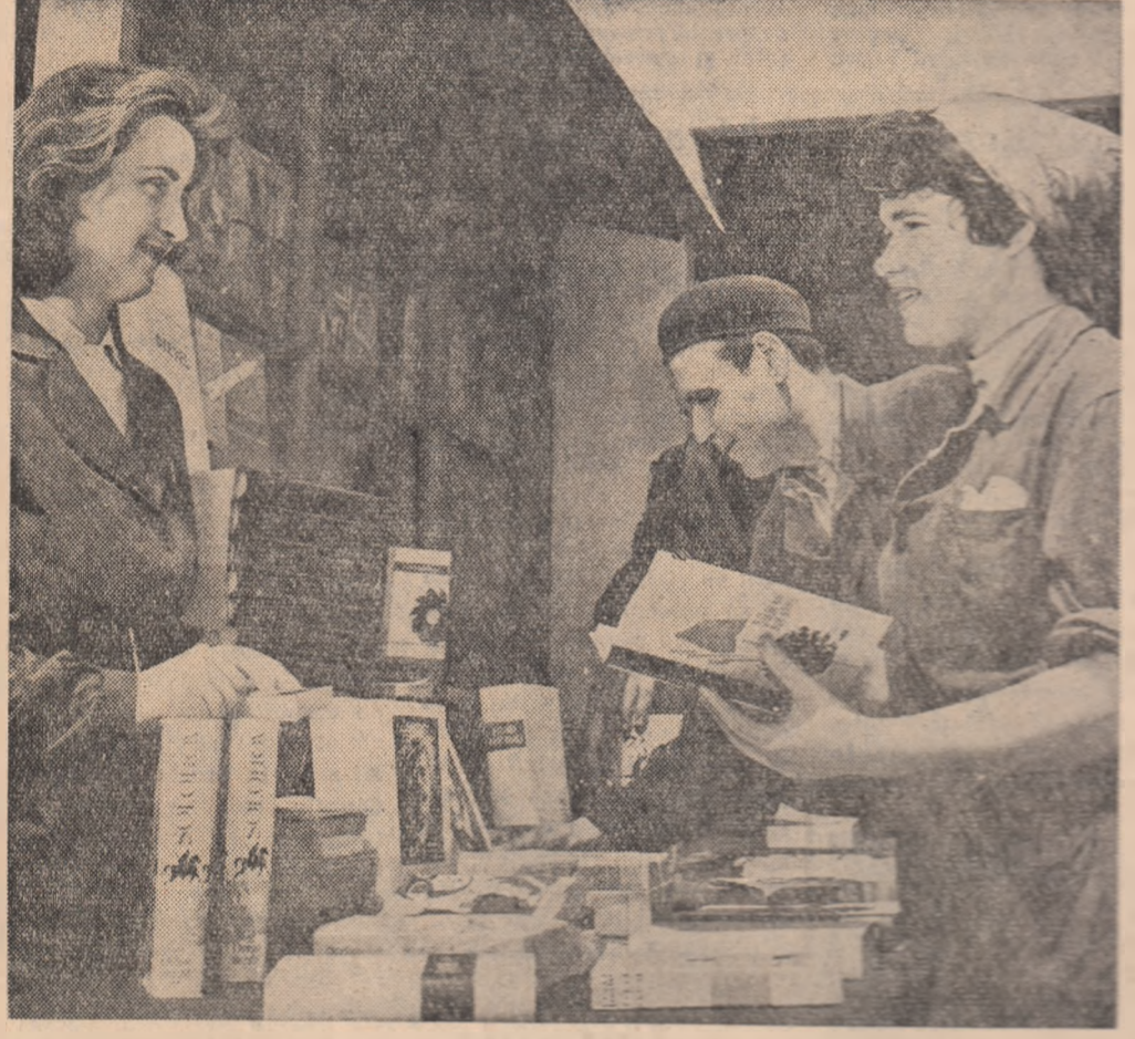
Cartea la locul de muncă.