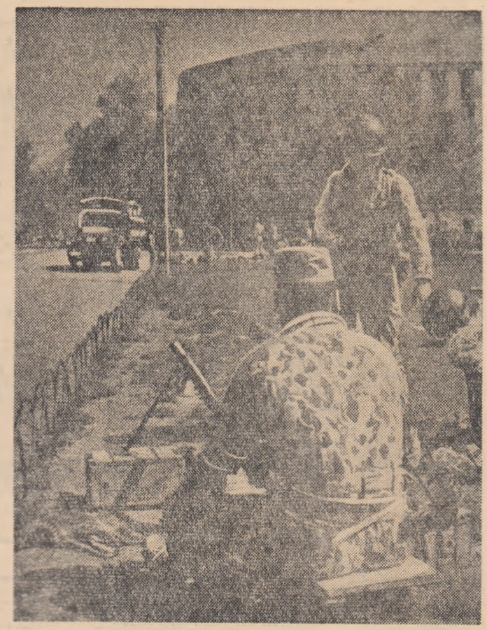
Seul. Pe străzile capitalei Coreei de Sud pot fi văzute unități militare gata să atace orice manifestație a populației

Malek a subliniat că guvernul algerian nu intenționează să facă discriminare față de locuitorii de origine europeană. Toți locuitorii Algeriei vor avea aceleași drepturi și aceleași îndatoriri, a spus Malek.