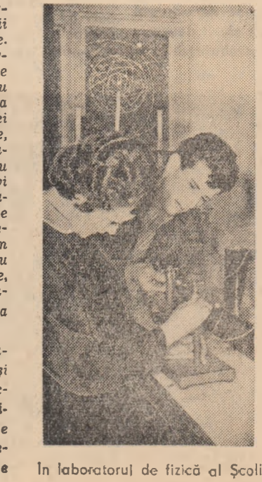
În laboratorul de fizică al Școlii medii serale nr. 1 Sibiu