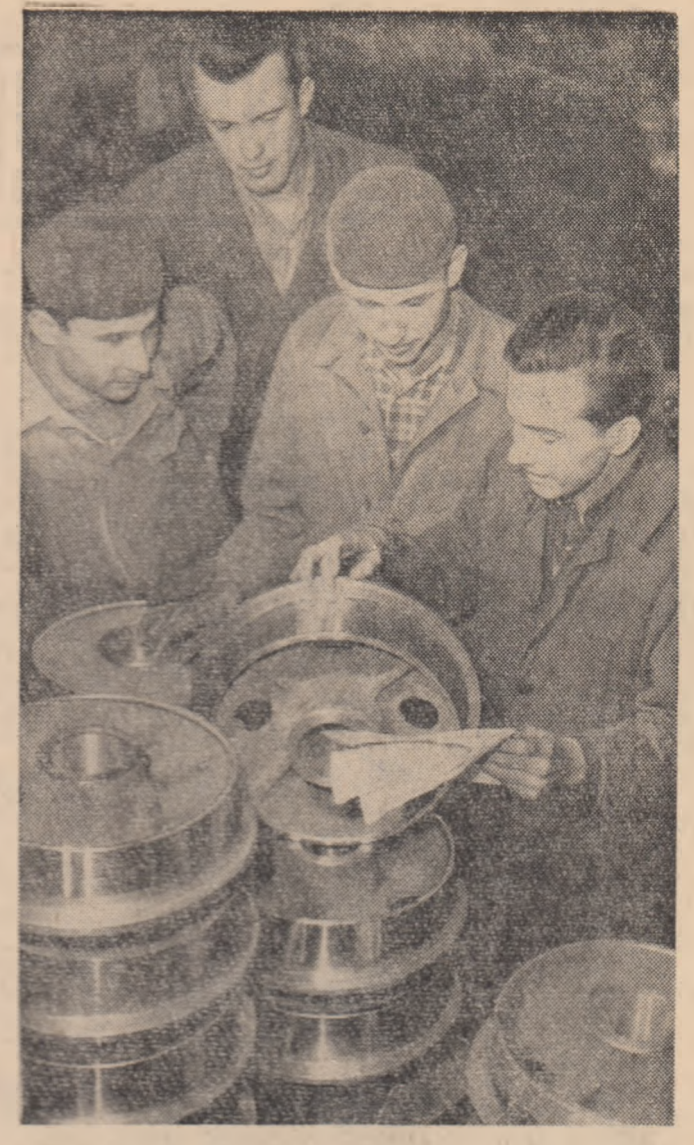
Discuțiind despre bunul mers al muncii în secția mașini-unelte a Uzinelor de mașini și utilaj minier din Baia Mare.

Minerii din industria carboniferă au încheiat primele 5 luni ale anului cu un bilanț rodnic atât în privința sporirii cantităților de cărbune extras, cât și a îmbunătățirii calității lui. Debitul introducerii în subteran a unor noi utilaje cum sint combine, haveze, transportoare etc., mai bune folosiri a capacității de lucru a utilajelor existente și extinderii procedurilor moderne de armare, minerii din întreaga țară au extras peste prevederile planului în această perioadă 185.950 tone de cărbune. Minerii din Valea Jiului au adus o contribuție deosebită la aceste realizări realizind o producție peste plan de mai mult de 100.000 de tone din care aproape un sfert cărbuni coalsificabili. În perioada amintită, minerii din acest bazin, ca și din numeroase alte exploatări carbonifere, cum sint cele din Anina, Ponor, Văisoai și celele, s-au evidențiat prin extragerea unui cărbune cu un conținut de cenușă mai redus decit cel prevăzut. Bilanțul activității minerilor cuprinde, de asemenea, realizări importante și în privința reducerii pierzului de cost al cărbunelui, la 4 luni din acest an s-au realizat în întreaga industrie carboniferă economii suplimentare, prin reducerea pierzului de cost în valoare de peste 5.790.000 de lei. Cea mai mare parte a economiilor provine din reducerea cheltuielilor de producție, ca urmare a creșterii productivității muncii în majoritatea exploatărilor. (Agerpres)