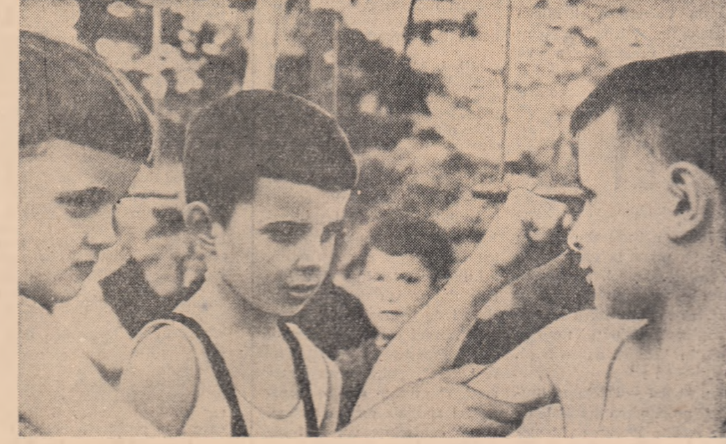
la să vedem, ești mai tare?