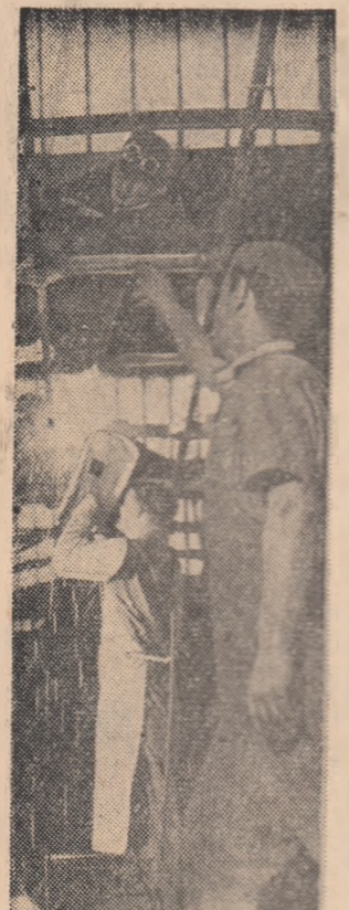
Harnici constructorii ai autobuzelor de la Uzinele "Tudor Vladimirescu" din Capitală