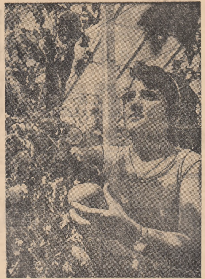
Culegînd roșii de seră