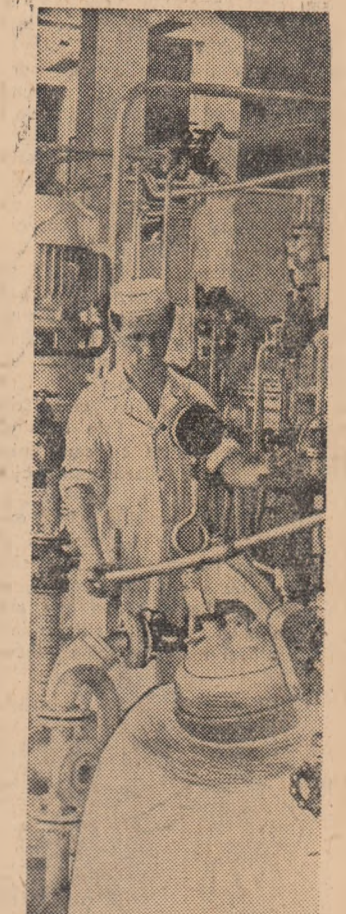
Urmîrind parametrii de lucru la aparatele intermediare și fermentatoarele de regim cu care este utilată Fabrica de antibiotice din Iași