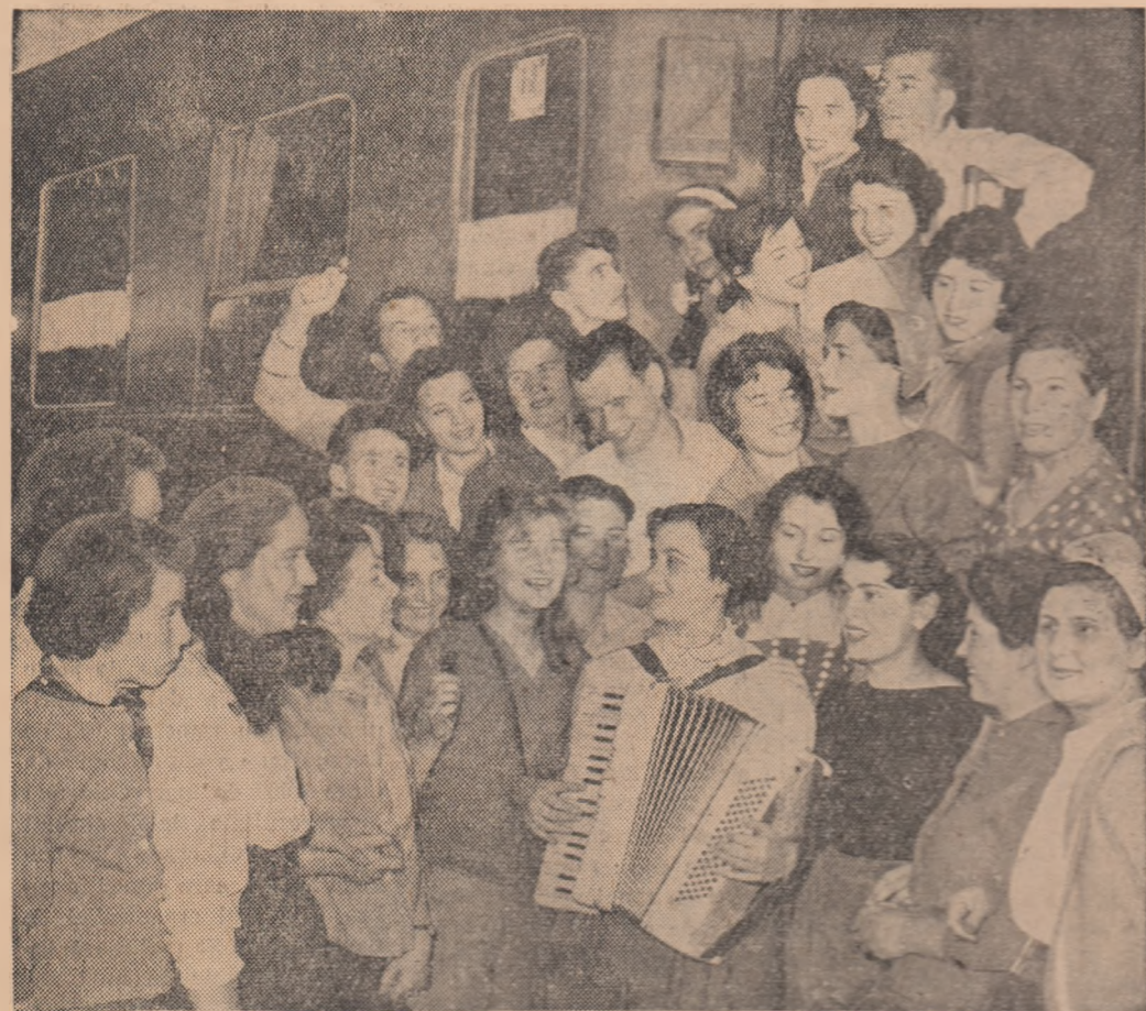
Un cîntec înainte de urcarea în vagoane

(Grupul muncitorilor de la „Cauciucul Quadrat” pică în excursie pe Valea Frăvoșei)