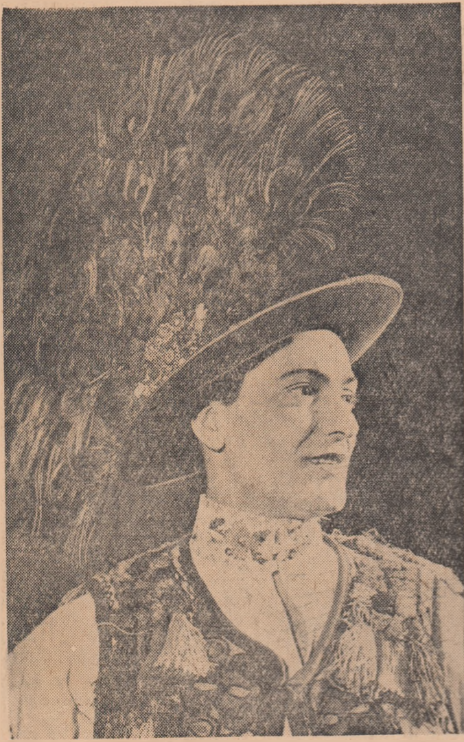
Costum din Năsăud