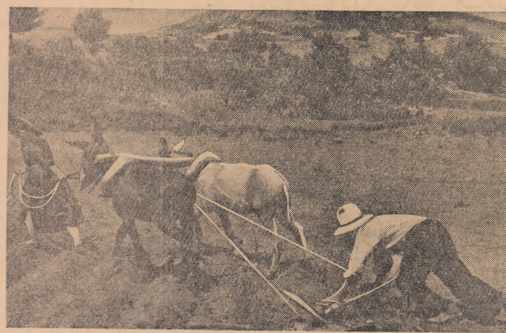
Sub regimul dictaturii Franco, oamenii mușcii duc o viață plină de lipsuri și mizerie. Prima fotografie înfățișează condițiile în care muncește țărănul spaniol. Cu unele primitive, acești țărani lucrează pămîntul nîspioase, lipsite totalmente de fertilitate, din care uneori nu scot nici măcar oțla de otă și semănat. În suburbii orașelor spaniole mizeria este de nedescris (fotografia a doua). Un oraș atît de mare ca Sevilla nu are nici pînă astăzi canalizate la periferie. Groapa întinsă din prim plan a fotografiei este tot ce a oferit administrația orașului în materie de igienă locuitorilor romanticei Sevilla.