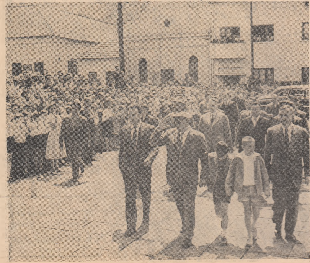
Pe străzile orașului Reșița