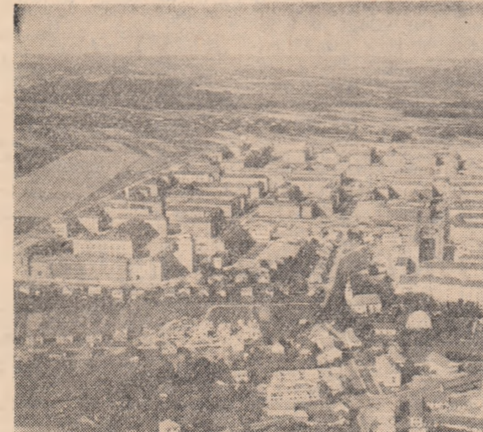
O mare așezare construită în Cehoslovacia în ultimii ani este Poruba lângă Ostrava, care găzduiește peste 35.000 de locuitori

Un grup de specialiști sovietici de la Institutul de stat pentru proiectarea uzinelor metalurgice din Dnepropetrovsk a elaborat proiectul unei oțelării care va fi una din cele mai mari din lume.