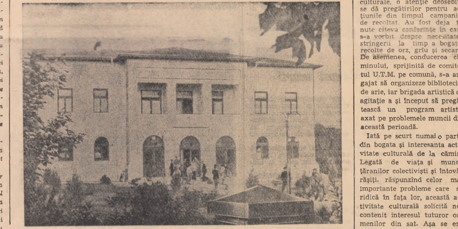
Noua Casă raională de cultură din Curtea de Argeș.