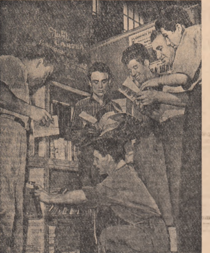
La standul de cărți din secția montaj a Uzinelor "Mao-Tzedun" din Capitală, au sosit noii. În poză, tinerii se grăbesc să și le aleagă pe cele care le lipsesc din biblioteca personală.