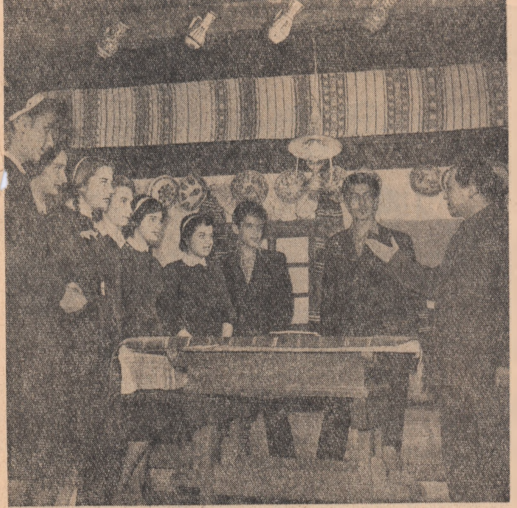
Pentru educarea comunistă a elevilor, comitetul U.T.M. de la Școala medie nr. 1 „Gh. Lazăr” din Sibiu inițiază numeroase acțiuni adunări generale U.T.M. cu temă, conferințe, reuniuni, excursii etc. De data aceasta elevii vizitează în colectivul Muzeului „Bruckenthal”