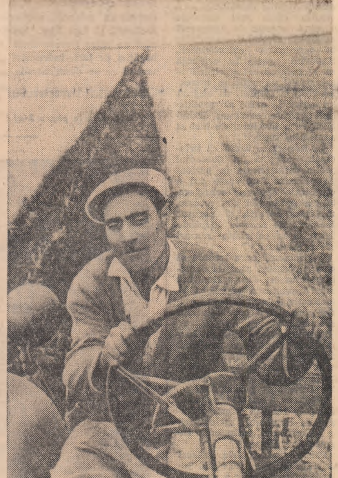
La G.A.S. Ivănești din raionul Slobozia, îndată după recoltat plugurile au început să tragă brazde adînci în mîriște.