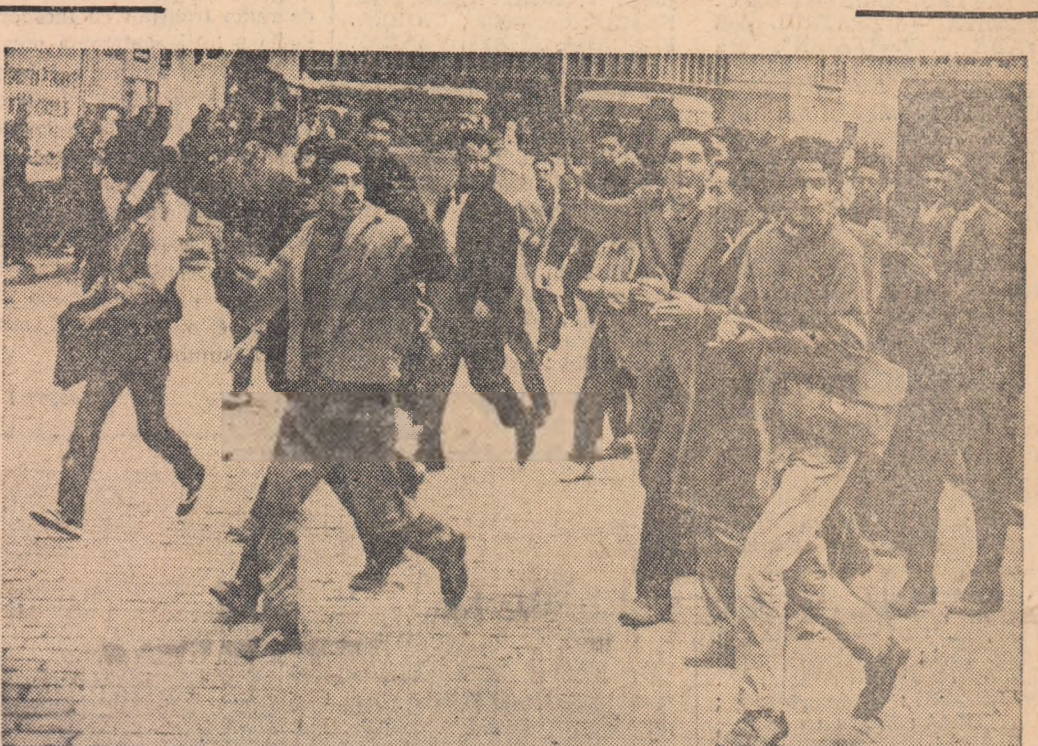
Alături de întregul popor algerian tineretul participă activ la lupta pentru eliberarea națională. În fotografie: tinerii algerieni manifestând în centrul orașului Alger.

Conferința iubitoare de pace cere să fie reluate imediat tratativele directe dintre guvernul francez și guvernul provizoriu al Algeriei, pe bază de egalitate reciprocă, asupra condițiilor de aplicare a dreptului de autodeterminare a întregului popor algerian și a încheierii războiului colonialist în Algeria.