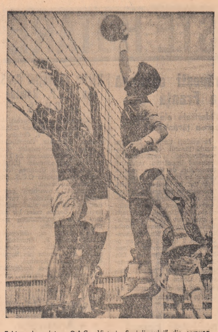
Echipa de volei a G.A.C. „Victoria Socialismului” din comuna Basarabi, raionul Calafat, în timpul antrenamentului.