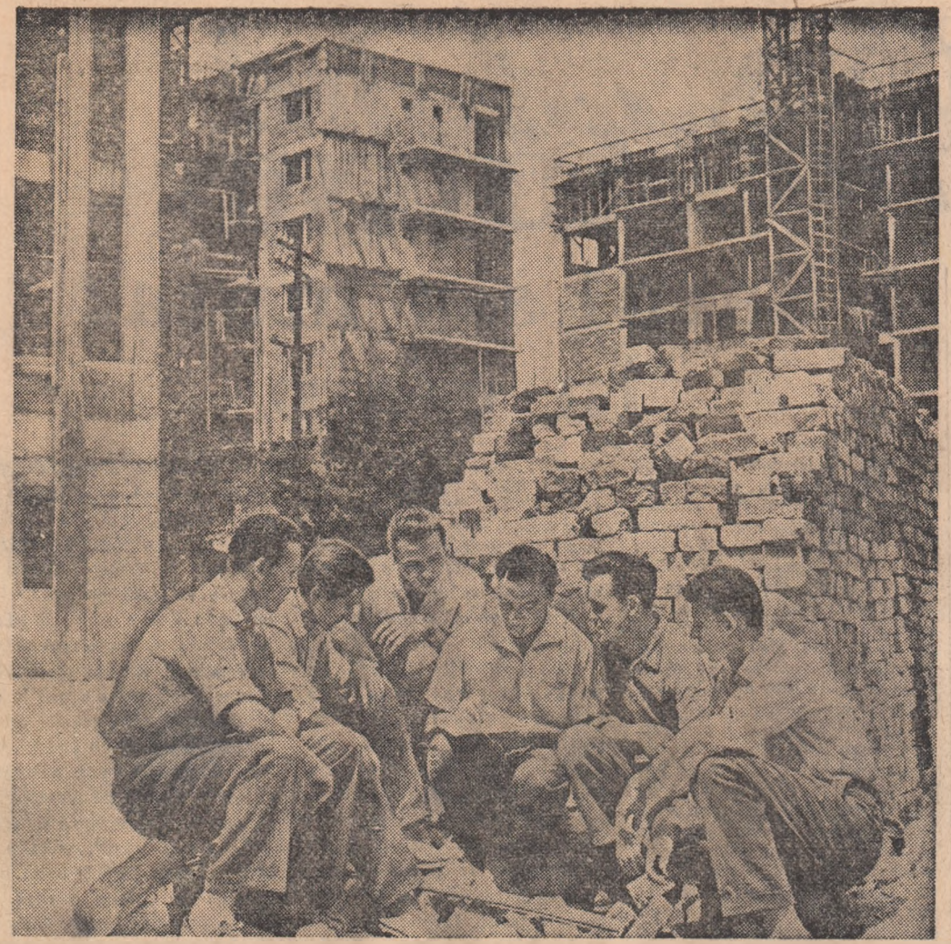
Un scurtă consfătuire de producție pe unul din șantierelor de pe Calea Griviței

Citiți pagina a 2-a: Pagina tineretului de la sate