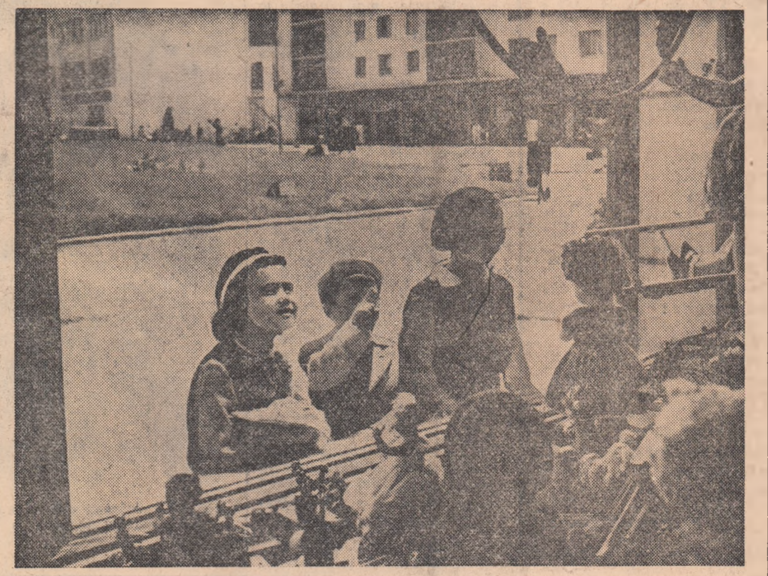
Ce jucării frumoase...

Îndreptați-vă deci alegerea voastră spre învățământul agronomic superior. Veți avea bucurii și satisfacții pe care nici nu le bănușiți încă.