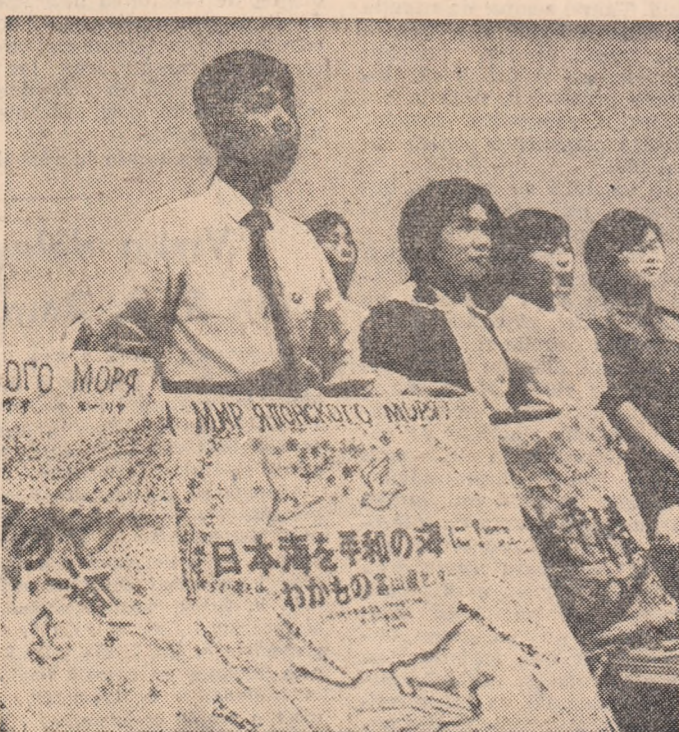
Aspect de la o demonstrație a tineretului japonez împotriva bazelor militare americane. Pe pancartă se poate citi: „Pace în Marea Japoniei”.