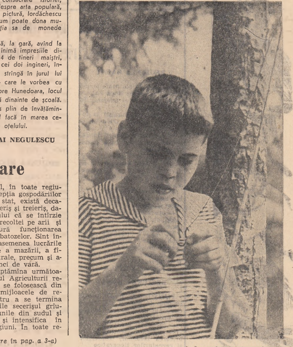
O treabă foarte serioasă... pregătirea unidiei.