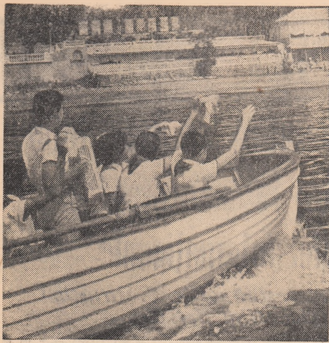
În tabăra pionierască de vară „Artek”