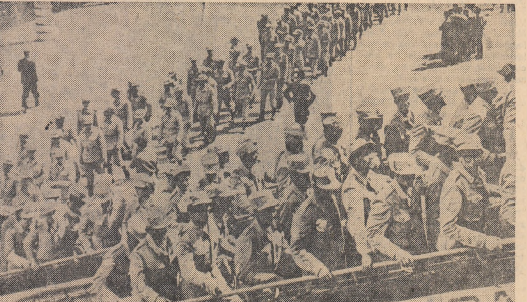
Colonialiștii portughezi trimis reșeau noi trupe în Angola pentru a înăbuși revolta populară. Fotografia noastră reprodusă după „The New York Magazine” înfîlțeză îmbarcarea unor trupe de reștensiune la Lisabona.