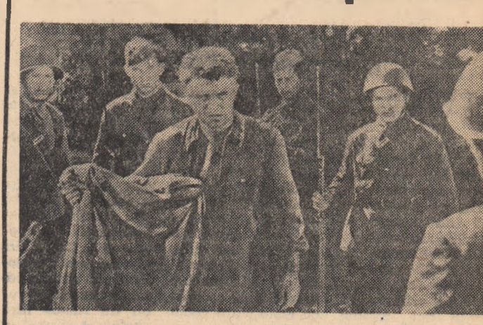
O producție a studioului Belorussfilm