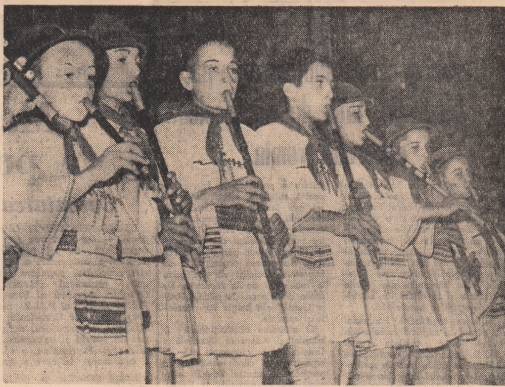
Formația de tineri a Căminului cultural din comuna Polovraci, raionul Gi-lor.

Adrian Popescu — Bacău, Valentin Mihai — Craiova Masivul Făgăraș dispune de numeroase cabane care oferă turiștilor condiții bune de refacere a forțelor după o zi de mers. Plecînd din Valea Olteului în masivul Făgăraș vom întâlni următoarele cabane: cabana Suru (la o altitudine de 1450 m.), Poiana Neamțului (706 m.), Negoiu (1546), Bilea Cascadă (1234 m.), Bilea Iac (2034 m.), Podragu (2136 m.), Arpașu (600 m.), Sîmbăta (1401 m.), Urlea (1533 m.), Refugiul Iezer (2165 m.), și Voina (950 m.).