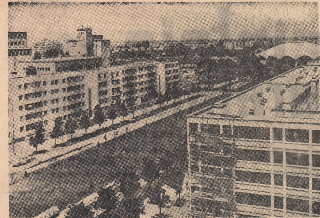
Construcții noi în Capitală: Aleea Circului de Stat

Combinatul siderurgic de la Galați, alte uzine și fabrici își vor mări capacitatea prin creșterea unor secții noi. În toate aceste mari întreprinderi industriale vor lucra și viitorii absolvenți ai Facultății de metalurgie. Ei vor conduce uriașele agregate. De aceea, sarcinile care stau în fața Facultății de metalurgie sînt deosebit de mari. În lumina Directivelor cel de-al III-lea Congres al partidului, Facul-