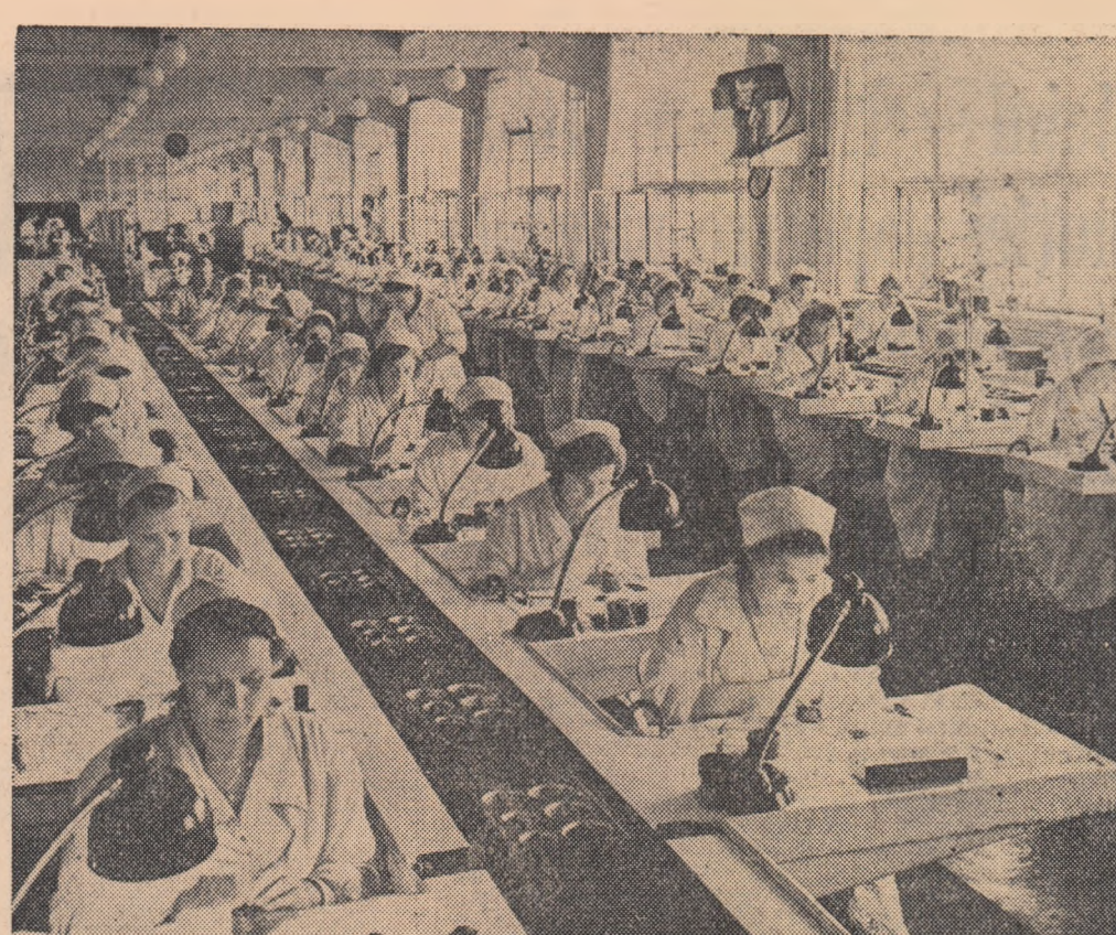
Aspect de la Uzina de optică mecanică GOMZ din Leningrad căreia i s-a decernat recent titlul de onoare de Uzina-fabrică pentru rezultatele foarte bune obținute în muncă. Actualmente, întreaga colecție uzinei luptă pentru cucerirea titlului de întreprindere de muncă comunistă. În fotografie: linile de asamblare a aparatelor fotografice „Neva”.

Încheierea Tratatului de prietenie, colaborare și asistență mutuală între Uniunea Sovietică și Coreea ca și semnarea Tratatului de prietenie, colaborare și asistență mutuală între China și Coreea reprezintă nu numai un eveniment important în viața politică a popoarelor celor trei țări — Coreea, Uniunea Sovietică și China, ci și un indiciu important al strinsei uniunii a lagărului socialist.