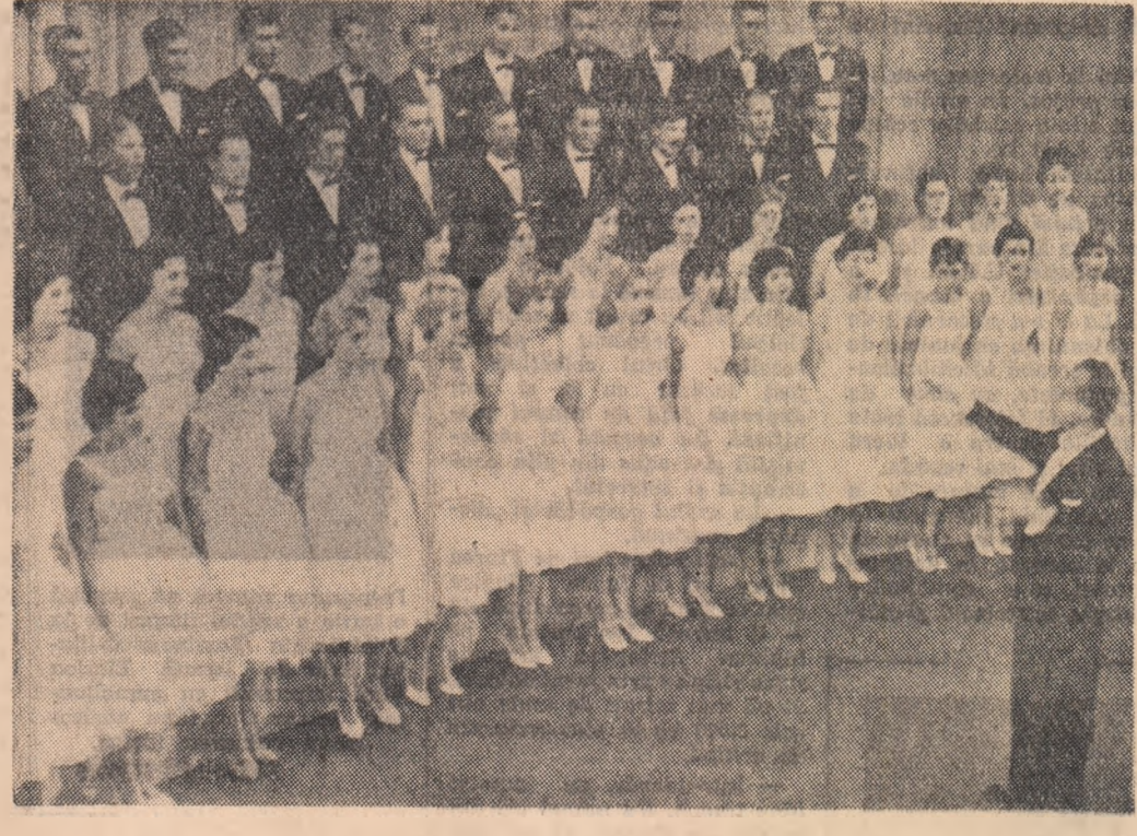
Formația corală a ansamblului asociației cultural-artistice „Branko Krsmanovici“.