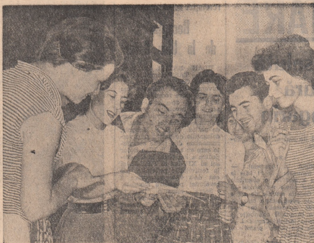
Tînăra profesoară a primit repartizarea într-una din mîile de școli ale patriei. Colegii o întâmpină bucurînd, o felicită. Urările de succes în noua viață pe care o încep acum sînt reciproce. Căci peste puțin timp toți acești tînez vor trece prin fața comisivilor și-și vor primi repartizarea la locul de muncă.