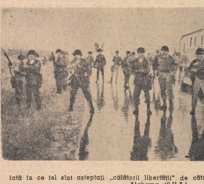
Iată în ce fel sint așteptați „călătorii libertății” de către autoritățile rasiste din statul Alabama (S.U.A.).

Ziarul „News” care apare la Jackson și care are o orientare vădit rasială este totuși nevoit să recunoască că, „călătorii libertății” sint finiți în celule mici și aglomerate, ca sint îmbrăcați în haine vîrgate și explică că „această îmbrăcăminte este menită celor care trebuie ținui sub pază armată permanentă”.