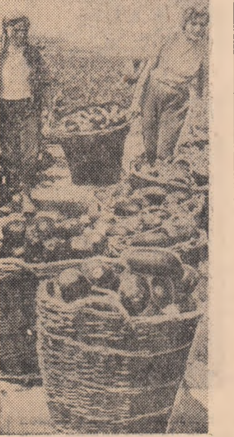
20 tone de vișetă s-au recoltat pînă acum din culturile forțate în răscăla, la G.A.S. Mogoșoaia.