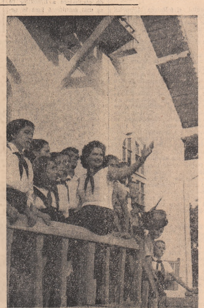
În tabăra de la Păușu, regiunea Argeș, școlarii și pionierii petrec zile minunate.

Lucrările de pe șantierul noilor construcții de la Combinatul siderurgic Hunedoara sînt avansate față de grafic. La jurnalul nr. 7, montorii au terminat, cu aproape o lună mai devreme, bîndajul furnalului, precum și instalațiile metalice de susținere. La noul laminor de sîrmă, benzii și profilele au fost asamblate în ultimele 6 luni, mai mult de 8000 tone de construcții metalice, pentru ridicarea haderelor.