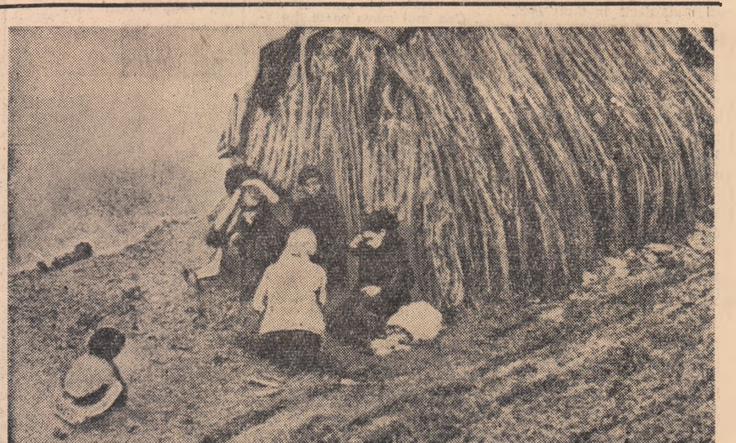
Ită cum sînt nevoiți să trăiască nenumărați oameni ai muncii pe malurile Guadalquivirului.

— O femeie din Sevilla care săt alături intervine în discuție: