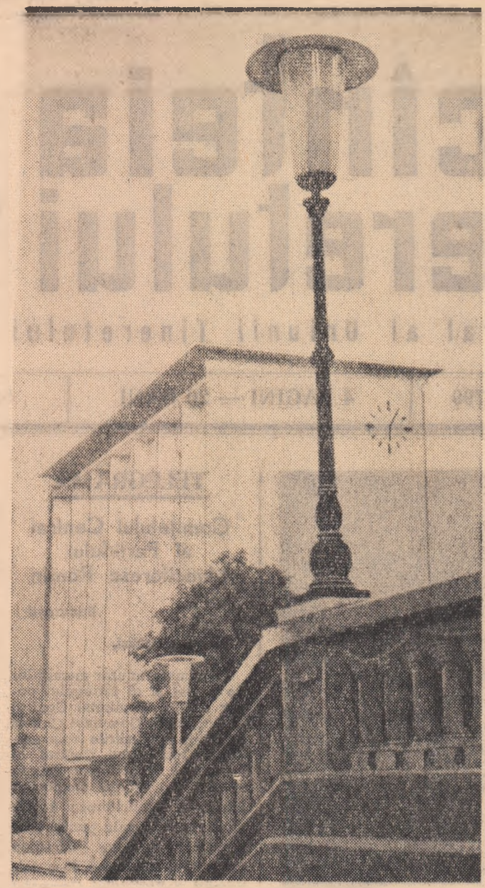
Construcții noi la Piatra-Neamț.