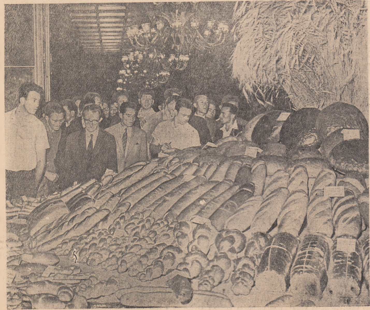
Vizitînd expoziția de produse de panificație realizate de participanții la concurs.