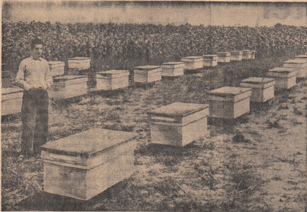
La marginea lanului de floarea-soarelui colectiviștii din comuna Baldoinești, regiunea Galați și-au adus stupii. Astfel albinele vor avea o bază meliferă bogată și vor ajuta totodată la polenizarea plantelor.