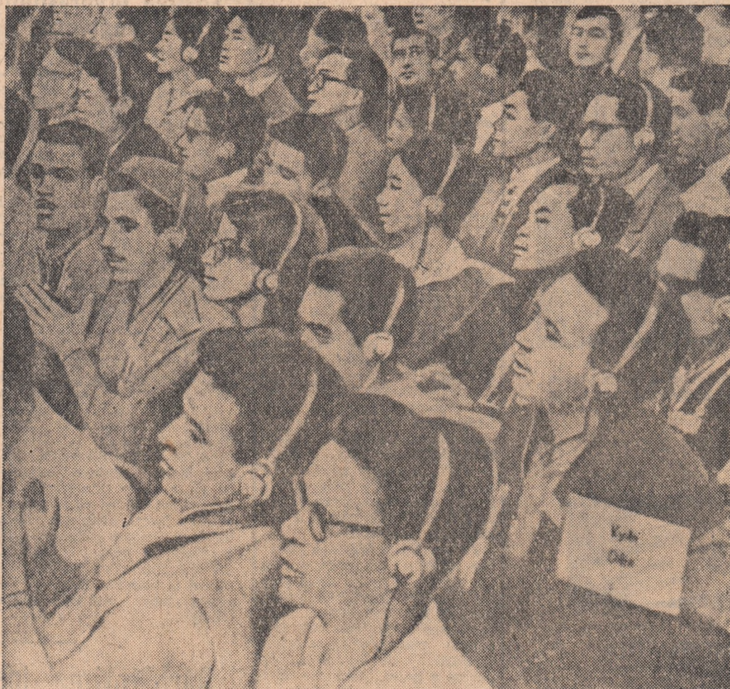
Aspect din timpul lucrărilor Forumului.

E noapte târziu. Tinerii români și greci discută împreună, vorbesc despre năzuințele lor comune. Răsund cîntec de pe meleagurile Greciei și României. Este o seară deosebit de plăcută, care fără îndoială contribuie la întărirea relațiilor prietenești dintre tineretul celor două țări.