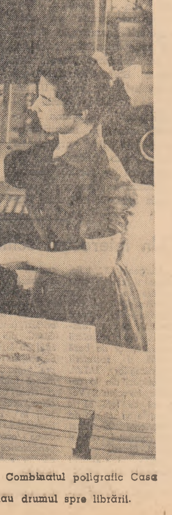
O imagine de actualitate la Combinatul poligrafic Casa...