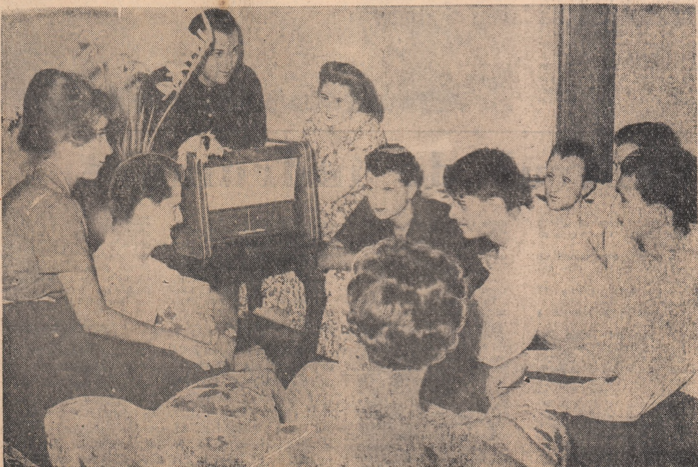
La Casa de cultură a tineretului din raionul I. V. Stalin, tinerii s-au strâns în jurul aparatului de radio. Ei ascultă cu un deosebit interes și bucurie Hotărârea Comitetului Central al Partidului Muncitoresc Român și a Consiliului de Miniștri privind creșterea salariilor, precum și reducerea prețurilor la unele bunuri de consum.

Președintele Consiliului de Miniștri al Republicii Populare Române Ion Gheorghe Maurer