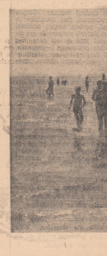
Zile călduroase la Mamaia