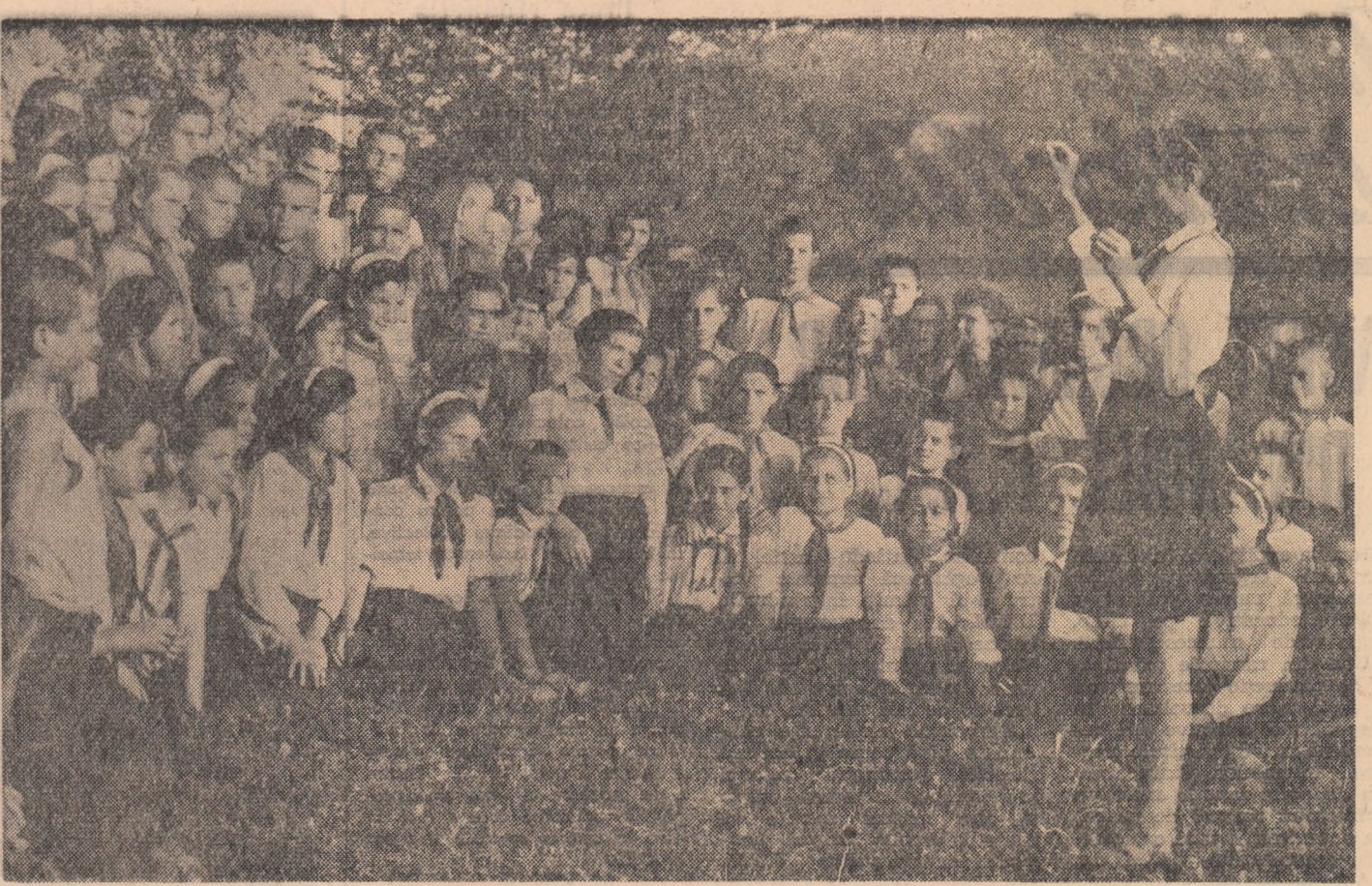
În tabăra de la Păușa, regiunea Argeș, școlarii și pionierii învață azi un nou cântec.