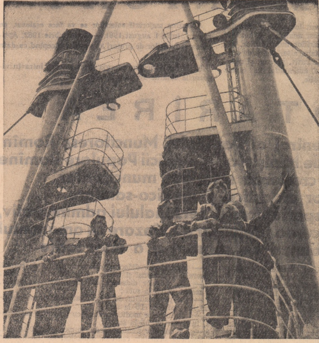
La prînz după terminarea practicii studenții mai rămîș cîteva clipe pe șantier și privesc uriașele cargouri ce se construiesc la șantierul naval Galați.