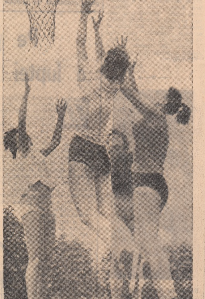
Lotul feminin studentesc de baschet se pregătește intens pentru Universiada de la Sofia.