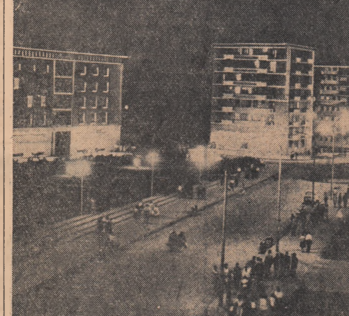
Aspect-nocturn din Galați