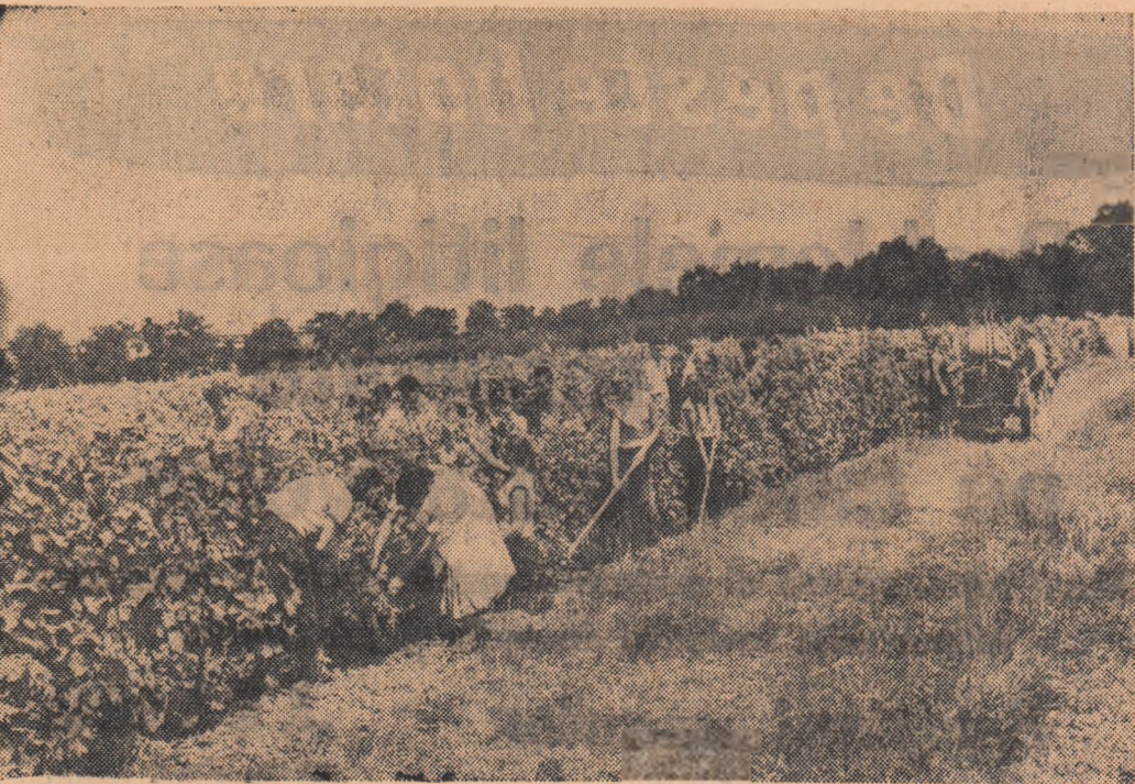
Elevi ai școlilor profesionale hortivite din Voinești, Odobești, Minii, Pietroasele, Făl-ticeni la practica de vară la Institutul de Cercetări hortivite din București.

A fost de față Franz Herbat-schek, ministrul Austriei la București.