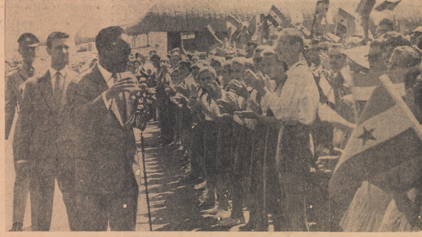
Kwame Nkrumah întâmpinat cu entuziasm de cetățeni ai Capitalei.