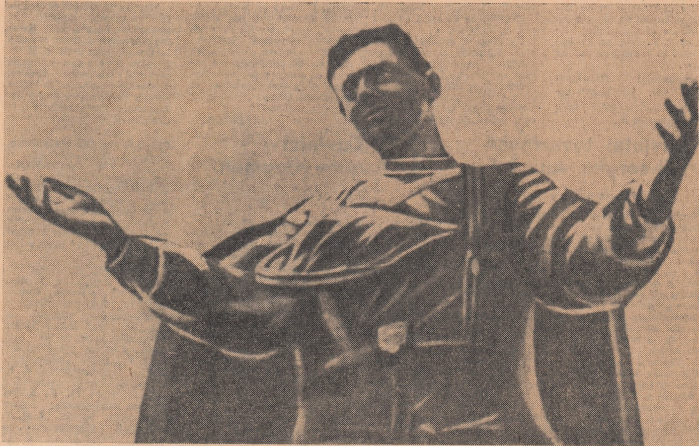
„SALUT PĂMÎNT IUBIT AL PATRIEI MELE!”. Pilotul cosmonaut Gherman Titov la întoarcerea din marșul său zbor.

ta cu nerăbdare clipa cînd pe tribuna mausoleului vor urca conducătorii Partidului comunist și guvernului sovietic și eroul Cosmopolis — Gherman Titov.