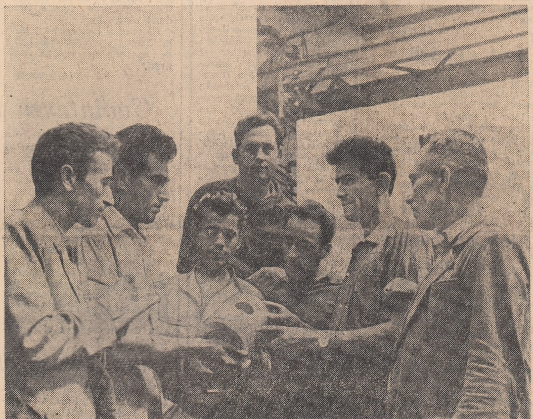
La Uzinele „23 August” din Capitală au sosit pentru specializare un grup de 17 mecanici din industria petroliferă. Lată clișa dintre ei discutind despre calitatea piscinelor de motor.