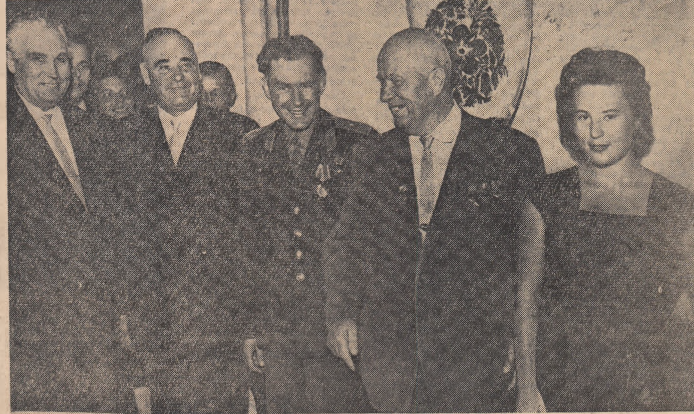
În timpul recepției.

IN PAG. A 3-A: In mijlocul colhoznicilor ucraineni (Prin telefon de la trimisul nostru special).