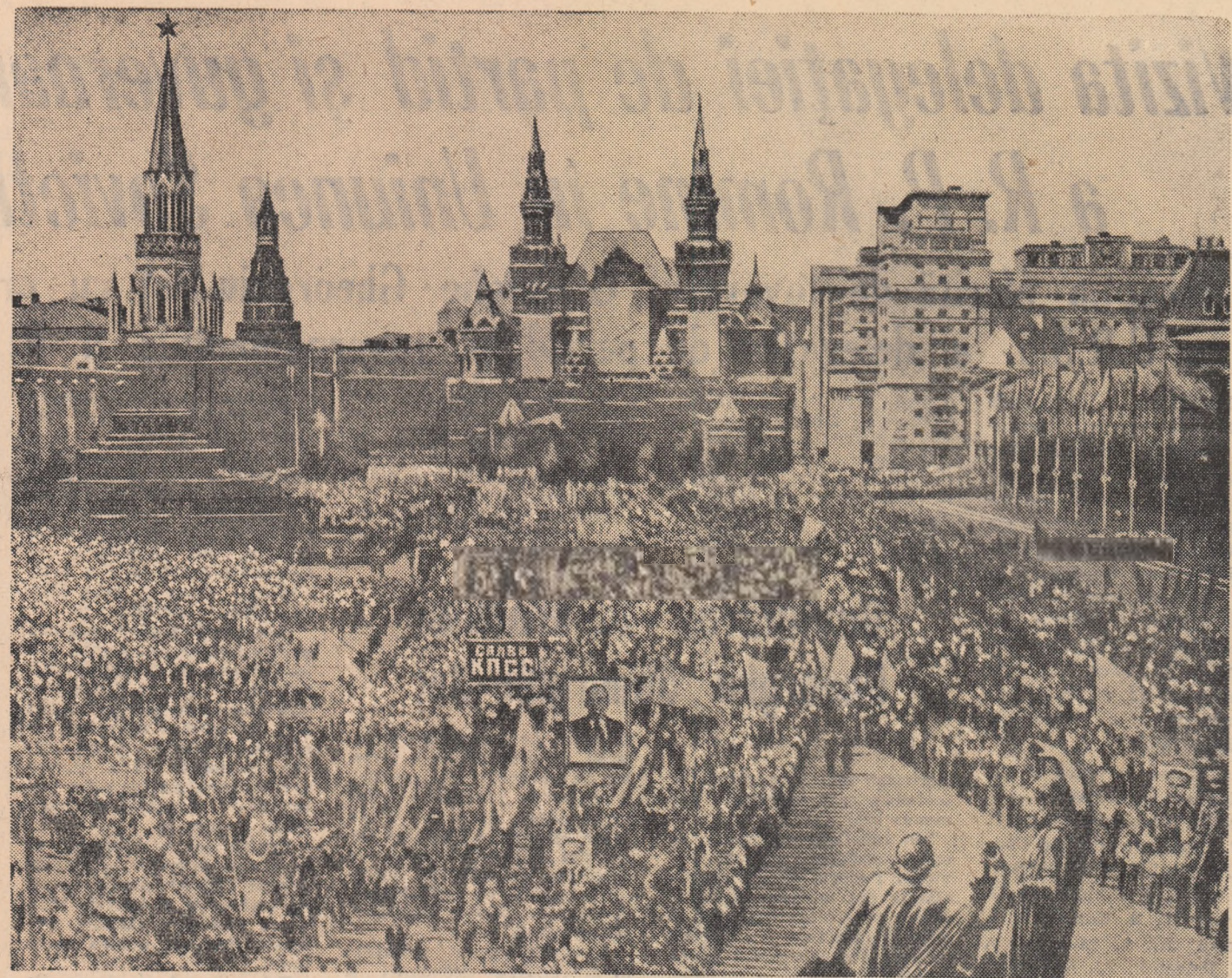
Moscova, 9 august 1961. Iată un aspect din Piața Roșie în timpul demonstrației în cinstea cosmonautului G. S. Titov

BERLIN. — Presa din R.D.G. publică știri care de-insușește al defunctului său îndreptat oamenii muncii din Praga pentru a-și lua rămas bun de la eminentul conducător al partidului și statului.