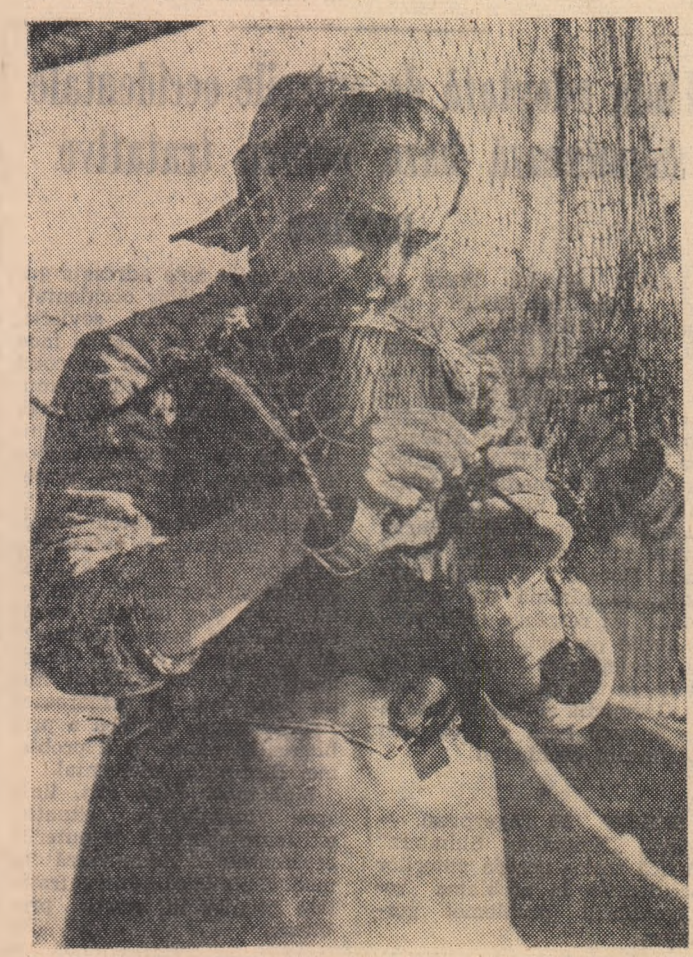
Repararea talenelor.