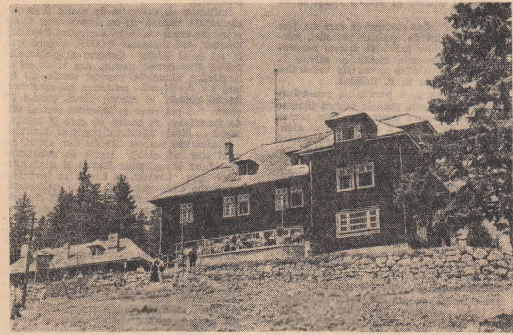
Cabana Cristianu Mare din Muntele Postăvaru

Mai auzisem despre acest maștru. Era în vara anului trecut. Abia se înfrînge construcția. Oamenii se uitau în schițele proiectului și vedeau parcă avea cum din quadron vor ieși gaze, benzine, motoare și altele pînă la bulgării strălucitori, negri, gri