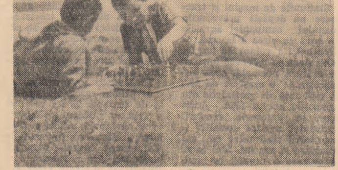
Disputa șahistă pe malul Argeșului, în tabăra de pionieri și școlarii din Aducașii Copăceni.