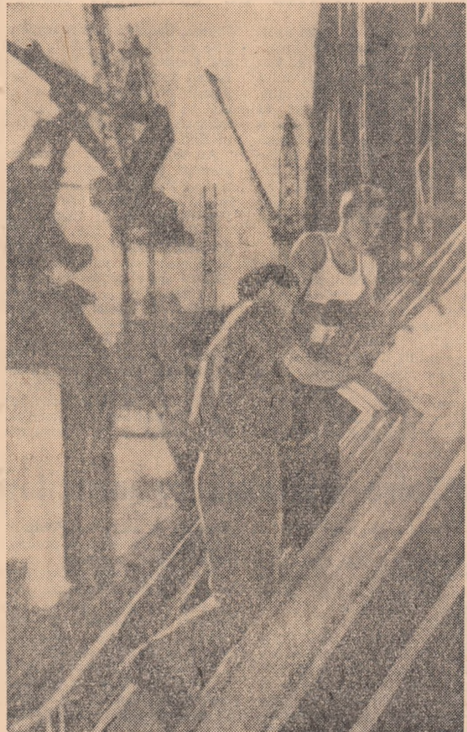
Construcții hidrocentrale de la Bratsk s-au angajat cu în cinstea Congresului P.C.U.S. să pună în funcțiune primul agregat. În fotografie: Comsomolștii pe șantierul hidro-centralei de la Bratsk.

în exploatare primul grup electrogen al centralei elec-trice de termoficare și o fa-brică de betonate celulare.