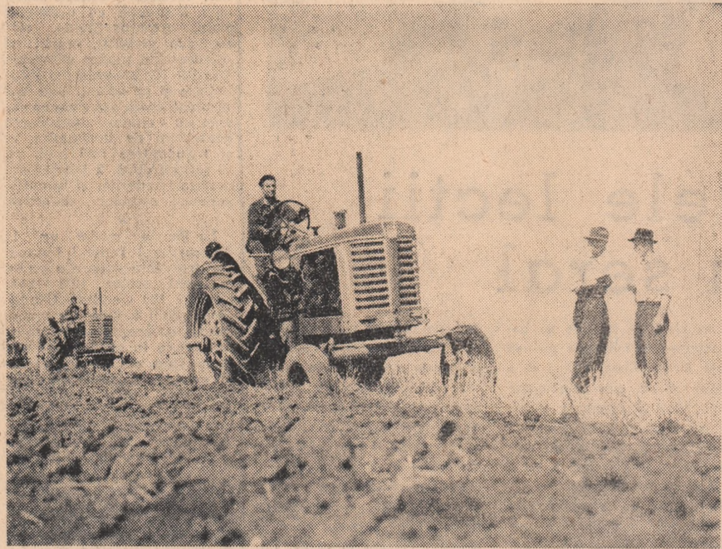
Arături adînci de vară pe țărilele G. A. C. „Ștefan Gheorghiu” din comuna Frumușani, regiunea București

Alături de furnaliștii și laminatori au dobîndit realizări remarcabile oțelarii, precum și muncitorii de la Uzina cocs-chimică și de la Fabrica de aglomerare a minereurilor. Din blămură încheiat la sfîrșitul celor 8 luni rezultă că planul a fost depășit cu 2.357 tone de coec, cu peste 24.900 tone de aglomerat și cu 16.000 tone de oțel Martin și electric. (Așerpes)