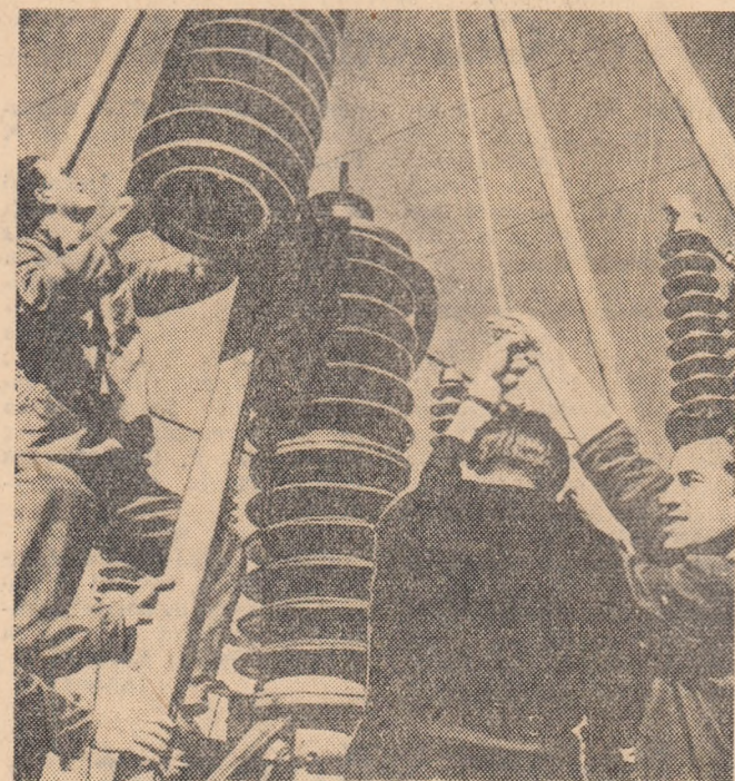
În cursul acestui an va fi terminată electricizarea liniei de cale ferată Sofia-Plovdiv. În fotografie: Constructorii lucrînd la instalațiile de electricificare.