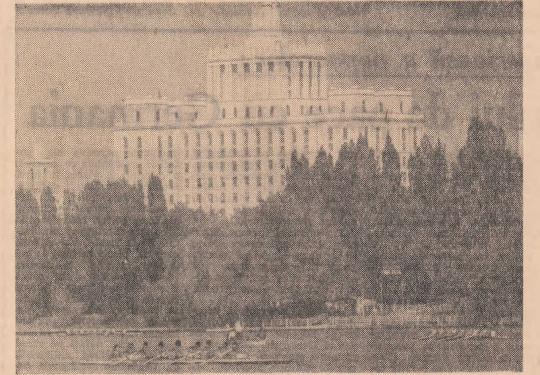
Interese de canoia pe lacul Herăstrău