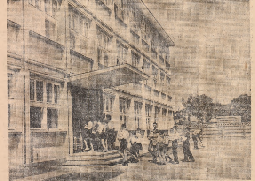
An nou în școală nouă. La Școala de 7 ani nr. 128 din Capitală se aduce de către elevii înșiși manualele ce le vor fi distribuite, tot lor, grațiat.