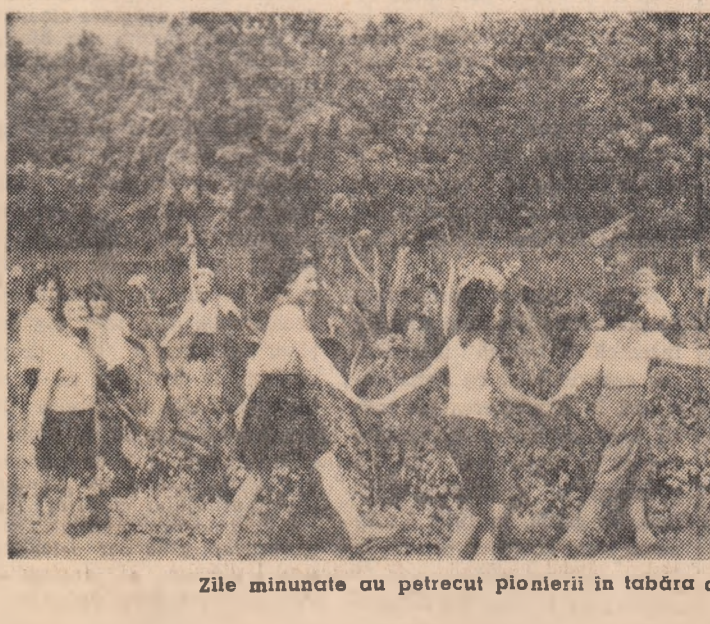
Zile minunate au petrecut pionierii în tabăra de la Brănești.