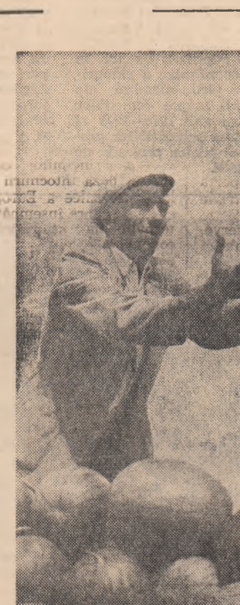
La culesul pepenilor în G.A.C. „Viața Nouă” din comuna Poenarii Vulpești, regiunea București.