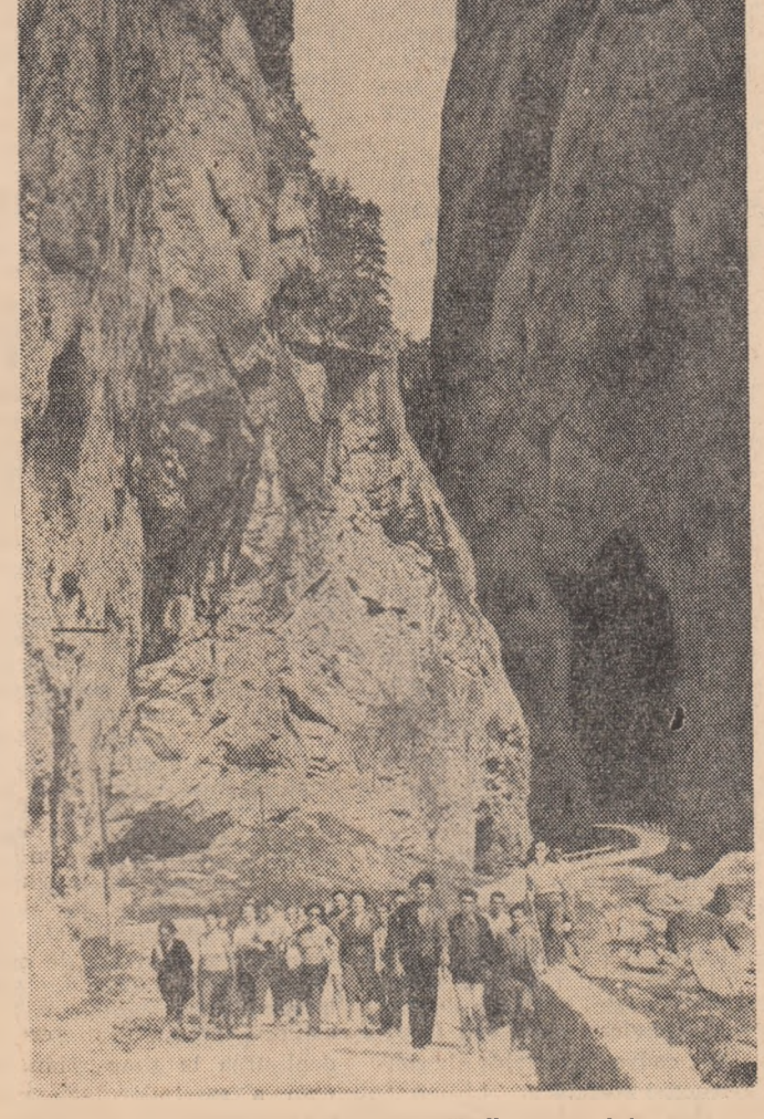
Un grup de tuișiți în Cheile Bicazului.

Trebuie spus însă că cei 600 de tineri au fost cuprinși în cursuri diferențiate numai pe criteriul meseriei, fără să se țină seama de nivelul de pregătire al fiecăruia. La cursuri participă, de pildă, laolaltă lăcătuși țevari, absolvenți ai școlilor profesionale, cu lăcătuși țevari care s-au