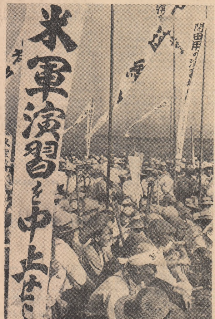
Tărani japonezi din apropierea muntelui Fujiyama au protestat împotriva manevrelor militare S.U.A. Pe pancourile participanților la mitingul de protest scria: „Dați-ne napoi pământul!“