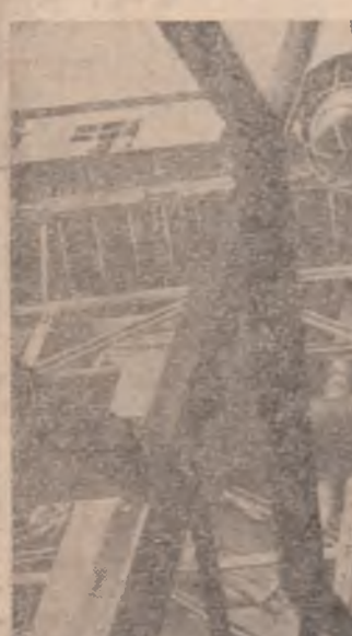
instalația de cocare catalitică de la Onești.