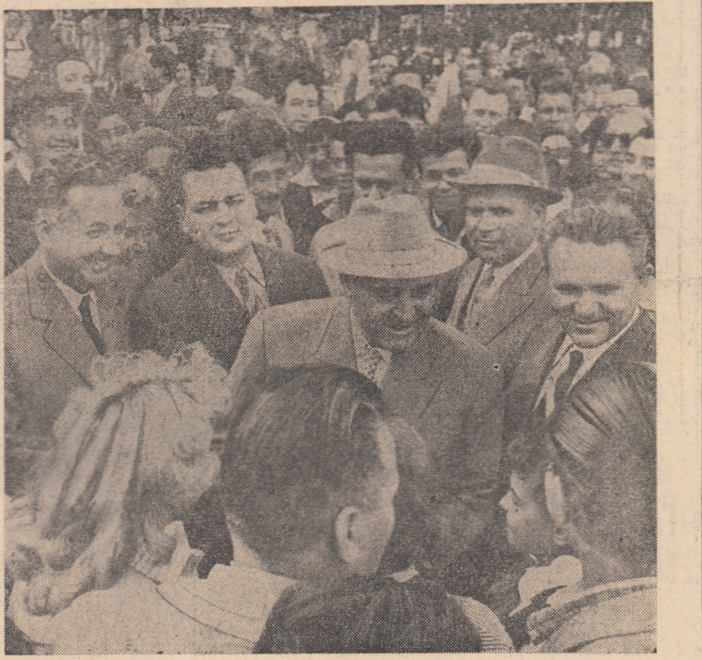
Vizitatorii pavilionului întîmpinînd cu căldură pe conducătorii de partid și de stat.

Expoziția de mostre de bunuri de consum de la șosea atrage un numeros public. De la deschiderea lui Pavilionul a fost vizitat de circa 65.000 oameni ai muncii din București și provincie. Cărțile de impresii ale diferitelor standuri — confecții, textile, tricotate, blănuri, încălțăminte, produse alimentare, — stau măturie aprecierilor pozitive de care se bucură din partea publicului consumator varietatea sortimentelor și calitatea mărfurilor expuse. De mult succes se bucură chestionarele distribuite în expoziție, care dau posibilitate fiecărui vizitator să-și comunice observațiile și sugestiile cu privire la produsele expuse. Duminică, așa cum s-a mai