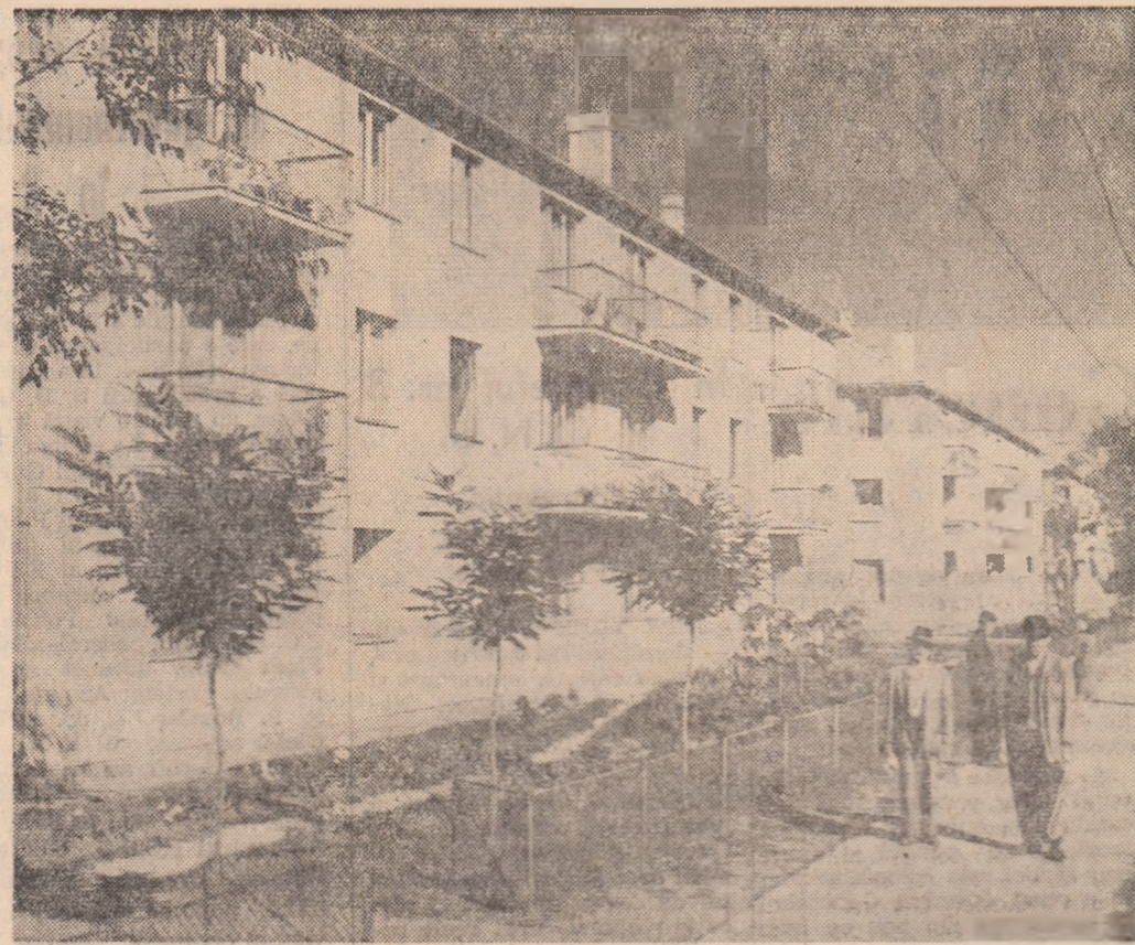
Ludus, regiunea Mures-Autonomă Maghiară. În fotografie: o vedere asupra noulor blocuri de locuințe de pe Strada Gării. Aici locuiesc muncitorii de la fabrica de zahăr.