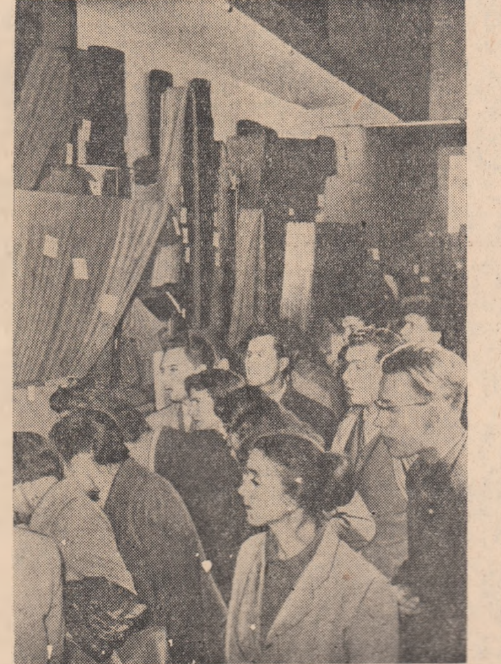
Vizitatorii Pavilionului de mostre privesc cu atenție expozițiile

La 9 octombrie a.c. Consiliul General al R. P. Romine la Damasc a adus la cunoștința guvernului sirian că guvernul Republicii Populare Romine a hotărît să recunoască Republica Arabă Siria, să stabilească relații diplomatice și să facă schimb de misiuni la rangul de ambasade. Hotărîrea a fost luată ca urmare a declarației guvernului sirian din 30 septembrie a.c. prin care propunea recunoșterea Republicii Arabe Siria și stabilirea de relații diplomatice între cele două țări.