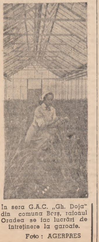
În sera G.A.C. „Gh. Doja” din comuna Bera, raionul Oradea se face lucrul de întreținere la gaoaca.

După o serie de concerte în orașele Berlin, Leipzig, Dresda și Erfurt, filarmonica bucureșteană, sub conducerea dirijorilor George Georgescu,