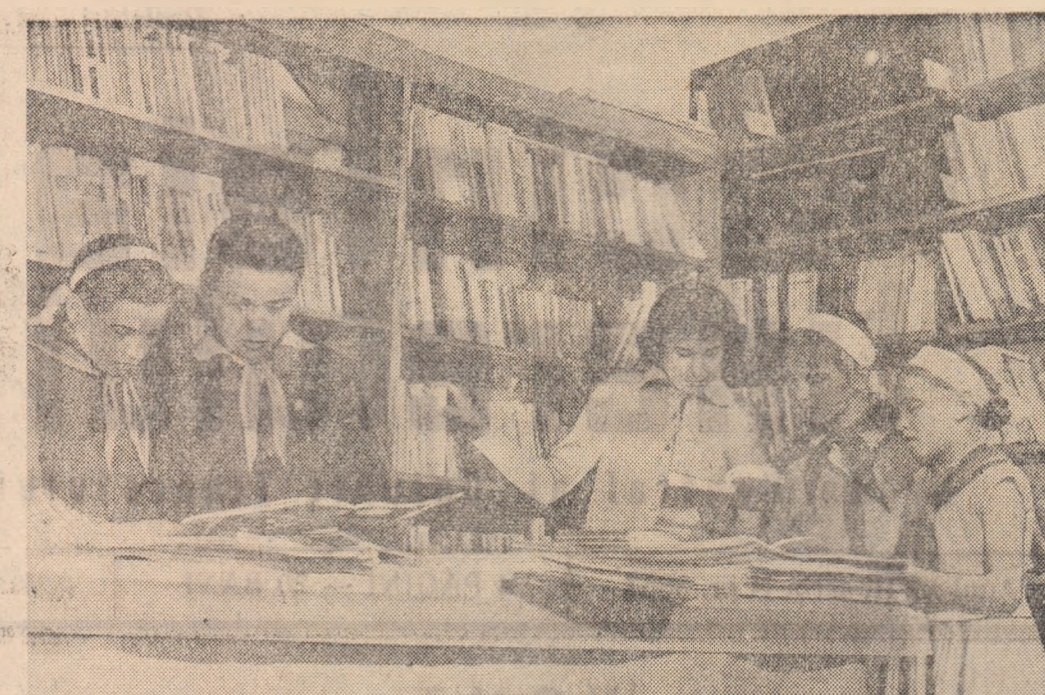
Cititori la biblioteca din comuna Epurești, raionul Drăgănești-Vlașca.