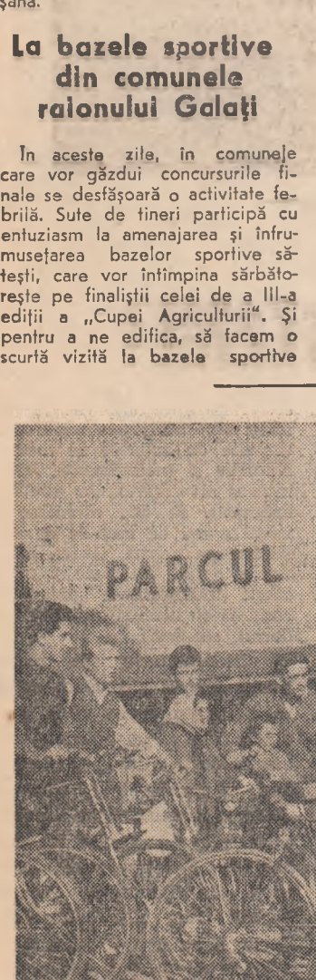
Cicloturiișii bucureșteni au efectuat duminică o nouă excursie. Înainte de... start o ultimă discuție asupra itinerariului.