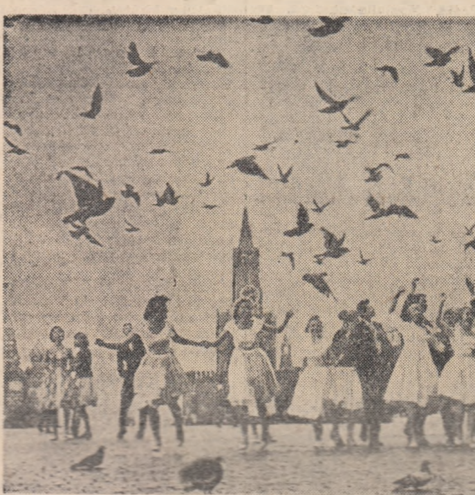
Absolvenții ai unor școli moscovite sărbătoresc fericiti acest important eveniment din viața lor.

„Departe, spre dreapta este o vale. Acum un an, acolo se termina bulevardul Lenin. Acum el se termina acolo unde se ridică imobilul pe care-l termina brigada lui Ghenadi Maslennikov. Intocmai cum sculău un vechi cunoscut se îndreaptă macaraua-torn spre puternica mașină care transportă blocurile întinzîndu-i amabil un braț de oțel. Blocurile direct montate și cu gaurile puse, plătuse lin spre locul unde, la etajul IV, se remarcă prinse colțuși, silueta înaltă a brigadierului. La 17 octombrie brigada se va muta la o adresă nouă, acolo unde acum se vede abia țeșt din pămînt fundamentul de beton al unui nou imobil. În ziua aceea bulevardul Lenin se va mări cu încă o casă.