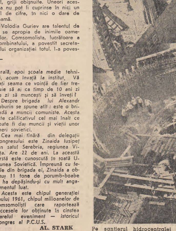
Pe șantierul hidrocentralei Ciukurgan angajamentele în cinstea Congresului au fost dușe la îndeplinire.